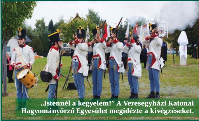
„Istennél a kegyelem!” A Veregyházi Katonai Hagományőrző Egyesület megidézte a kivégzéseket.