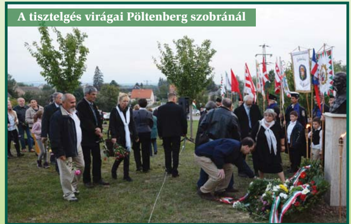
A tisztelgés virágai Pöntenberg szobránál