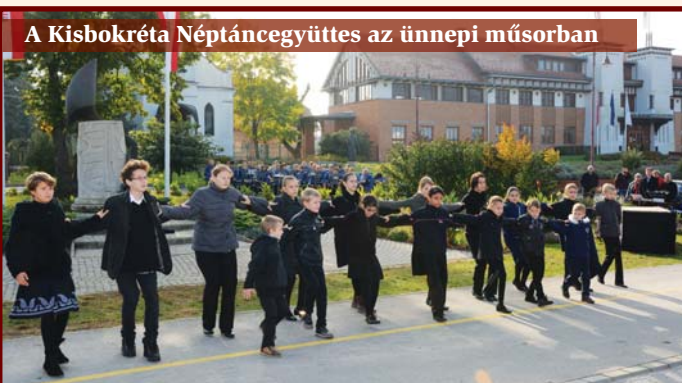
A Kisbokréta Néptáncgyűjtés az ünnepi műsorban