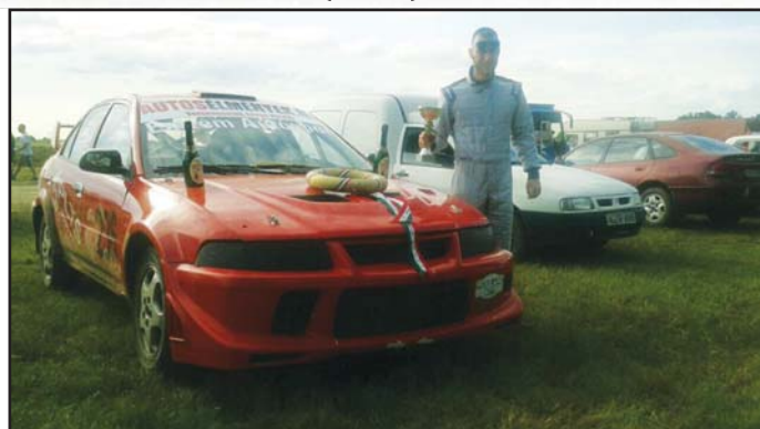
A bajnok és autója

És ha már elindultak, meg is nyerték! Harmincegy pontot vertek a mezőnyre újoncként! Kezdetnek nem rossz! Egy verseny három előfutamból állt, ahol 5 kört kellett teljesíteni. A döntőben 7 kör várt az autósokra. Egy kör 1-1,5 km hosszú. A futamok 10-12 percig tartanak, ami alatt maximális koncentráció szükséges. A védő öltözékben nyáron akár 50 fok feletti hőmérsékletet is el kell viselni. A Nyírádon rendezett utolsó versenyükön úgy nyertek, hogy a célba érkezés előtt másfél körrel eldurant a vízcső, de addigra már akkora volt az előny, hogy ez sem befolyásolta