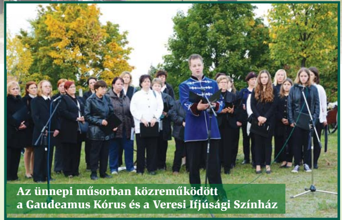
Az ünnepi műsorban közreműködött a Gaudeamus Kórus és a Veresi Ifjúsági Színház