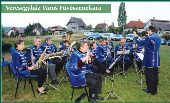
Veregyház Város Fúvószenekara