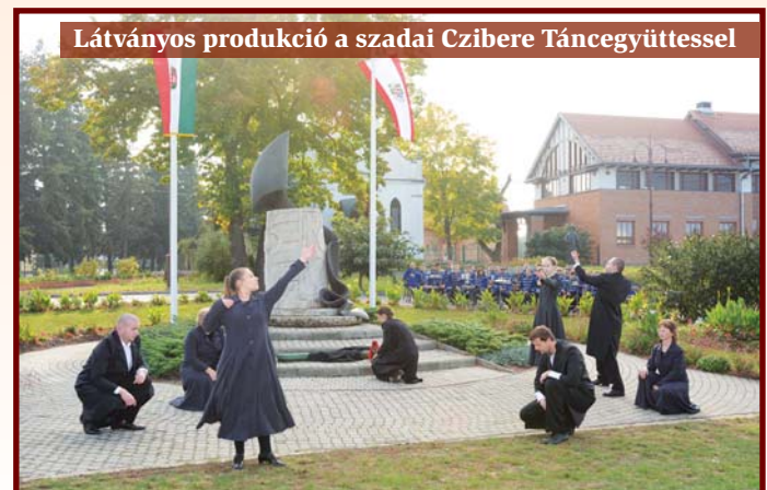
Látványos produkció a szadai Czibere Táncgyűjtéssel