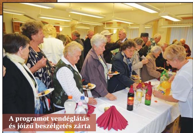
A programot vendéglátás és jóízű beszélgetés zárta