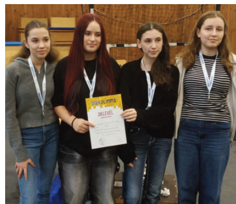
Felső lány csapat