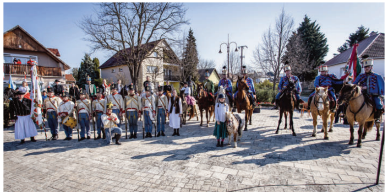
Veresegyház Katonai Hagyományörző Egyesület