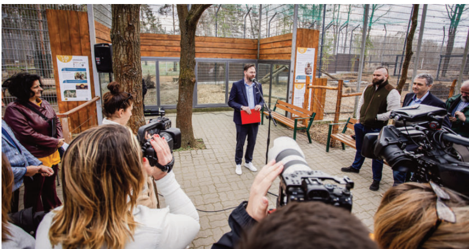
Cserháti Ferenc az ünnepélyes sajtótájékoztatón