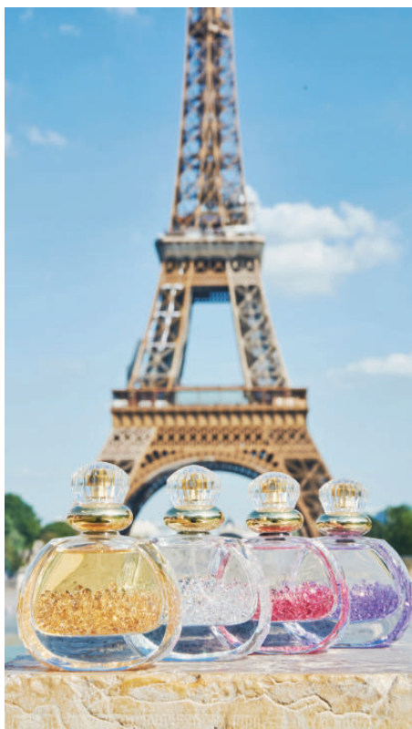
Minya Viktória parfümjei

amely tisztelgése a világ első feljegyzett modern parfümje, a „Magyar királyné vize” előtt. Az illatot a Tokaji aszú nemessége ihlette a méz, a szantálfa és a jázmin jegyeivel. A Magyar királyné vize (Aqua Reginae Hungariae) Európa első alkoholos alapú parfümje és gyógyvize volt, amely a 14. században vált világhírűvé. A legenda szerint az udvari gyógyszerésze készítette Károly Róbert felesége, Erzsébet királyné számára, aki a szernek köszönhetően nyerte vissza fiatalságát és egészségét. Ez volt az első olyan illatszer, ahol az illóolajokat tiszta alkoholban oldották fel, megelőzve ezzel a híres kölnivizeket. Egyszerre használták illatszerként és belsőleg, orvosságként (például köszvényre vagy fejfájásra). A középkori és kora újkori Európa egyik legkeresettebb „csodaszere” lett, még a francia udvarban is népszerű volt. Viktória ennek a legendának az újraélesztésével, a „tokaji aszús illattal” öregbíti a magyar borászat hírnevét.