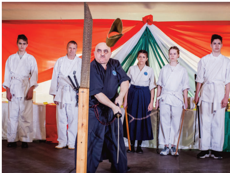
Két Kard Iskolája bemutatója