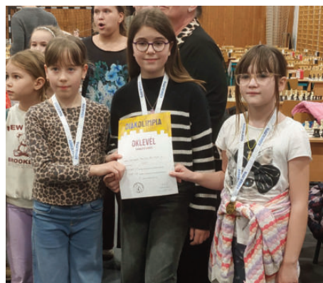
Alsós lány csapat