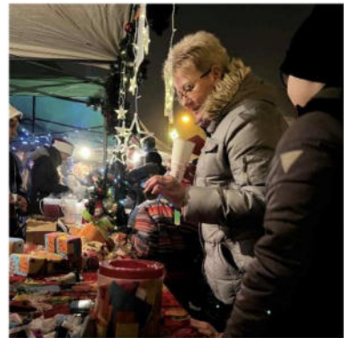
14. ábra - Mindenki Karácsonya

Új Esély Központ Veresegyház Cím: 2112 Veresegyház, Szabadság utca 18. Tel: 06/70-646-05-19 E-mail: veresegyhaz@btesz.hu