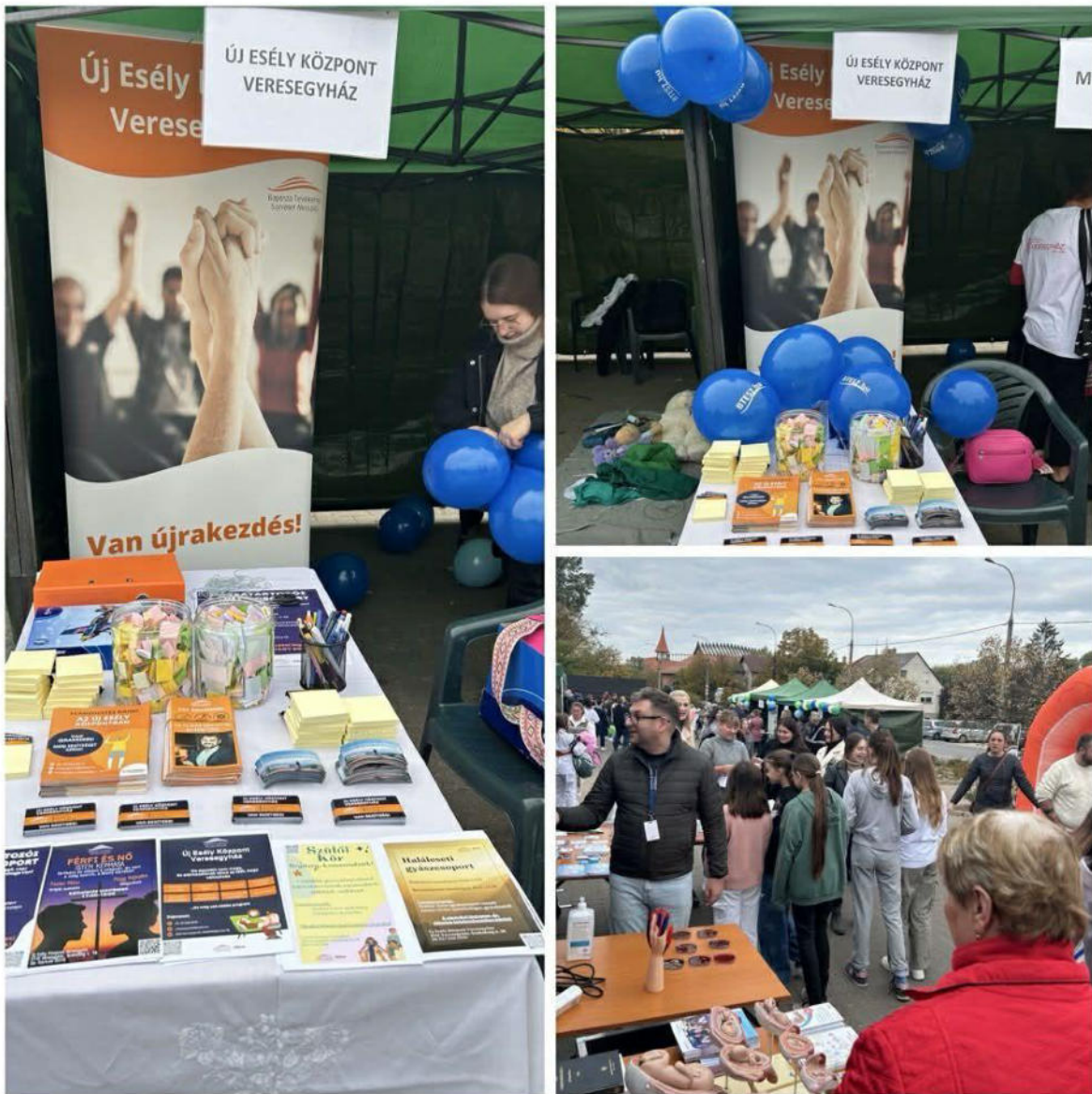
12. ábra - Kitelepülés

Új Esély Központ Veresegyház Cím: 2112 Veresegyház, Szabadság utca 18. Tel: 06/70-646-05-19 E-mail: veresegyhaz@btesz.hu