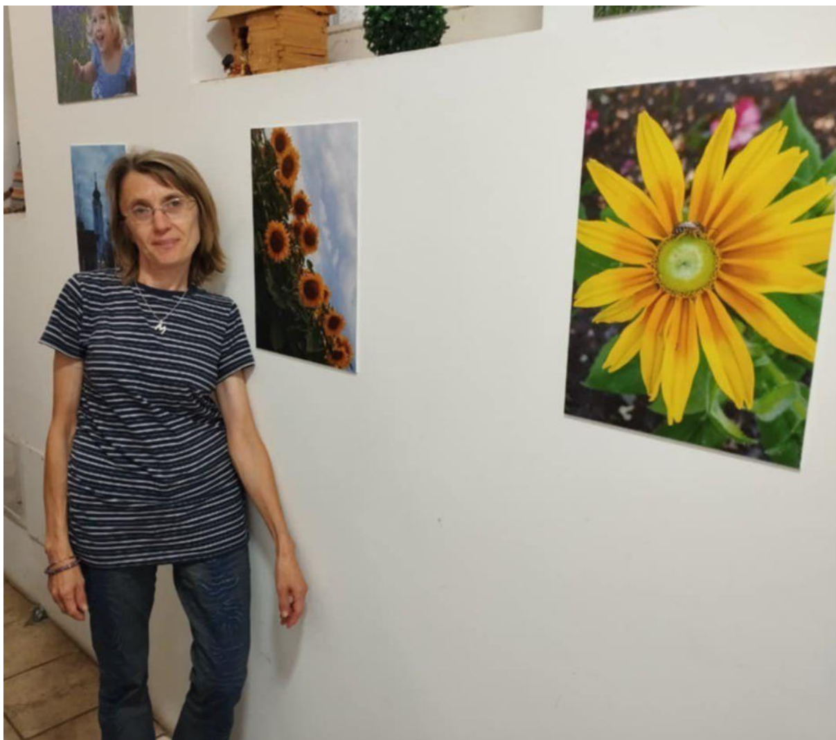
8. ábra – Fotóklub munkái