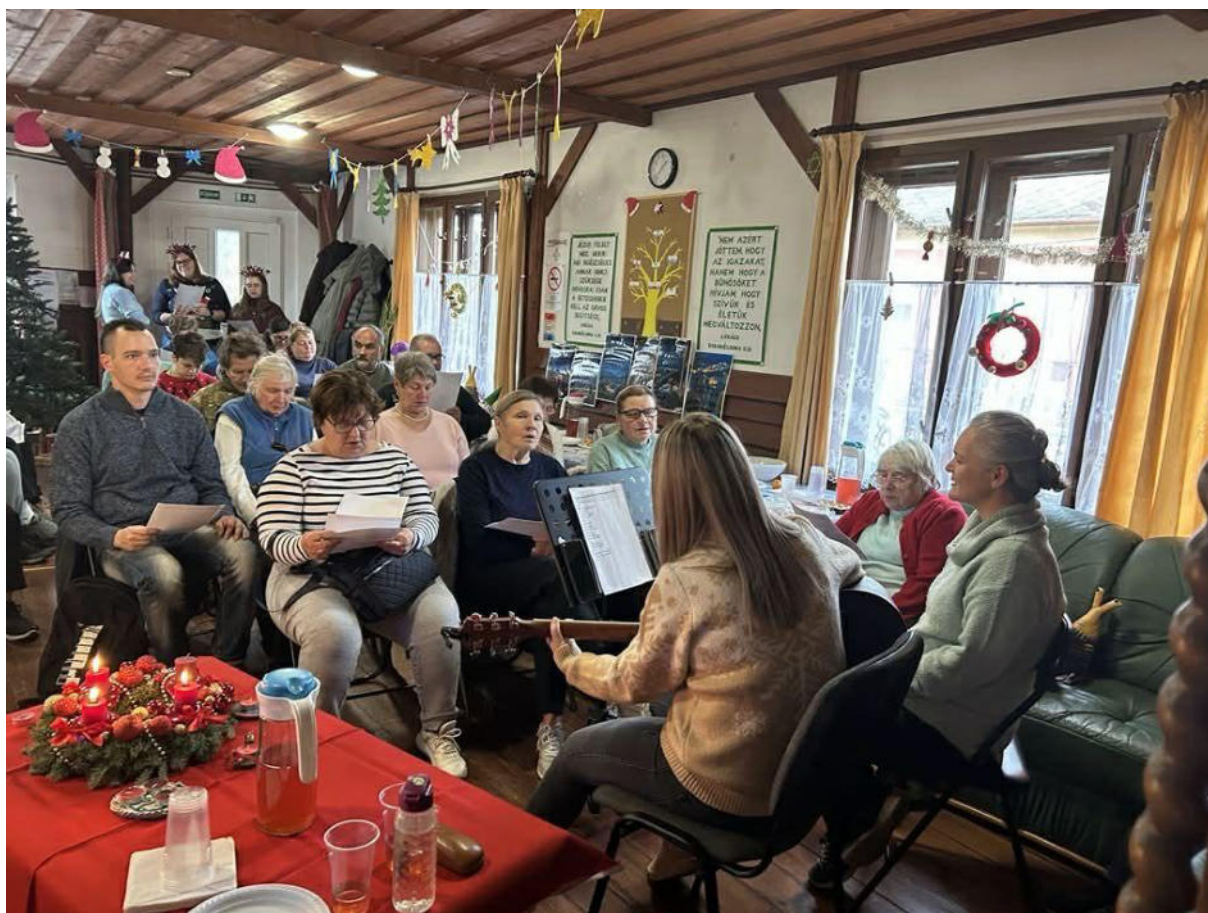
17. ábra - Ellátotti karácsony