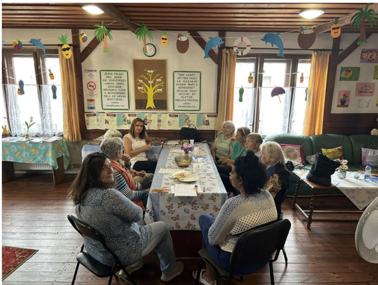
2. ábra - Bibliai csoport