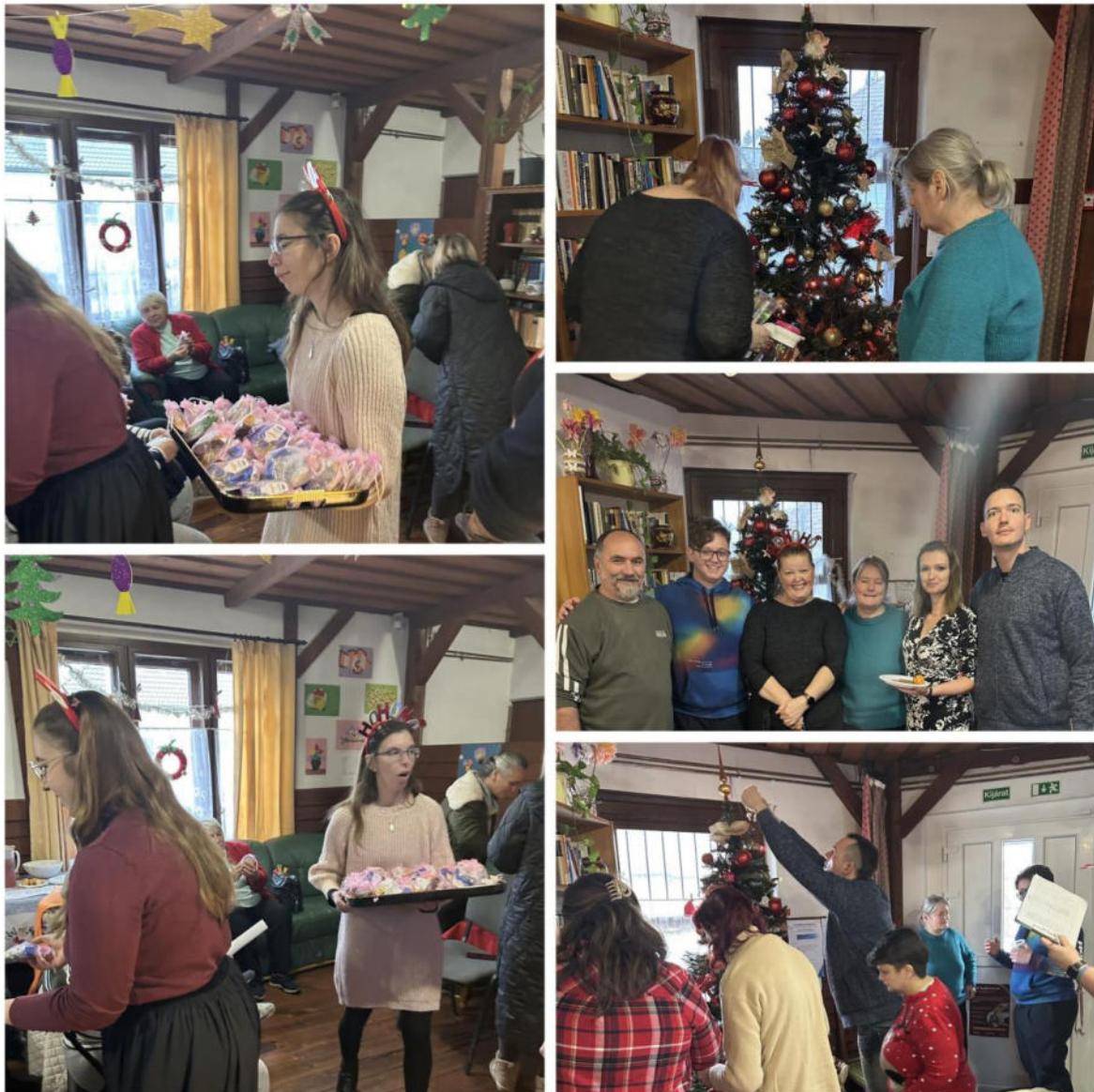
15. ábra - Ellátotti karácsony

Új Esély Központ Veresegyház Cím: 2112 Veresegyház, Szabadság utca 18. Tel: 06/70-646-05-19 E-mail: veresegyhaz@btesz.hu