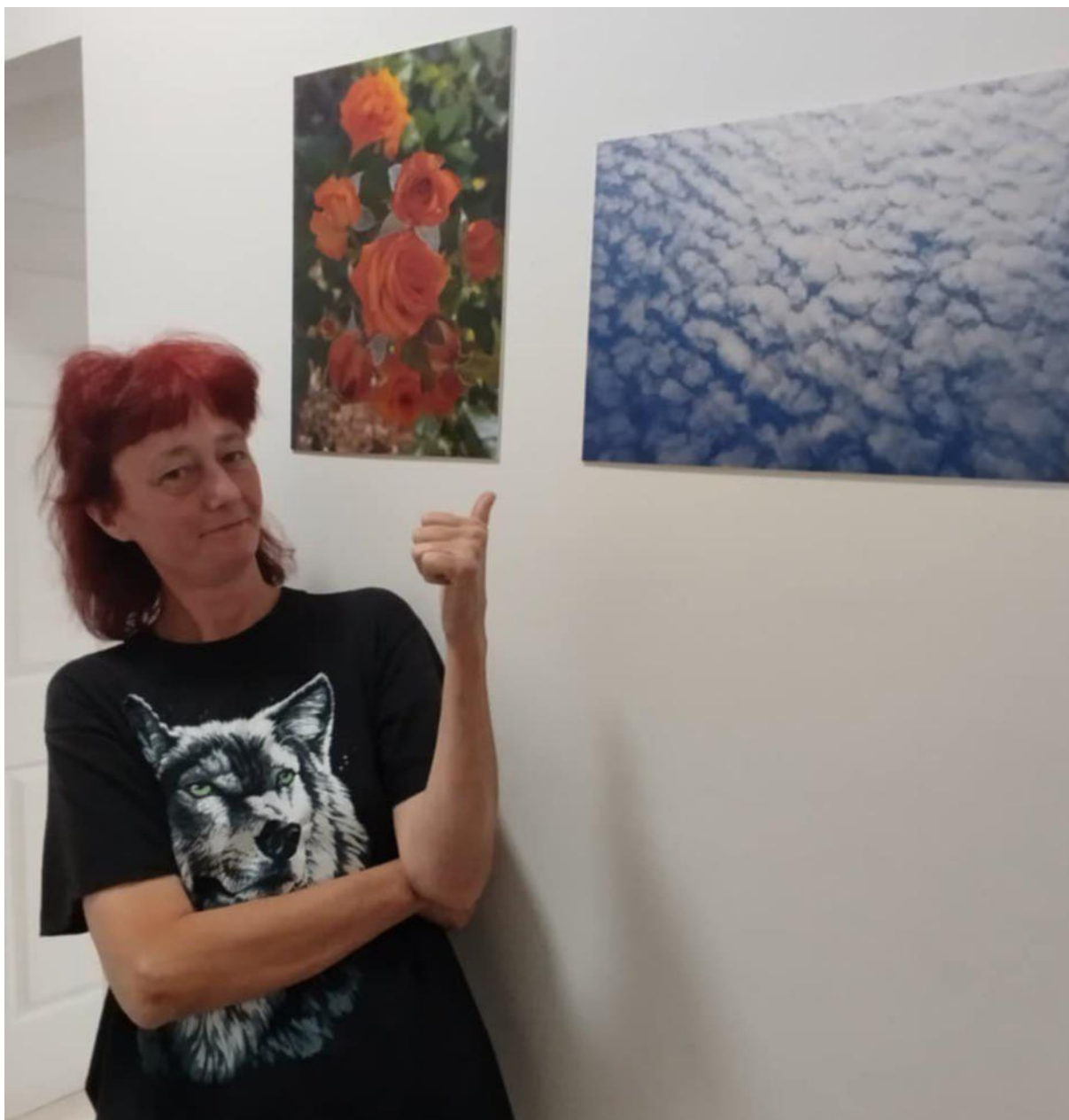
7. ábra – Fotóklub munkái