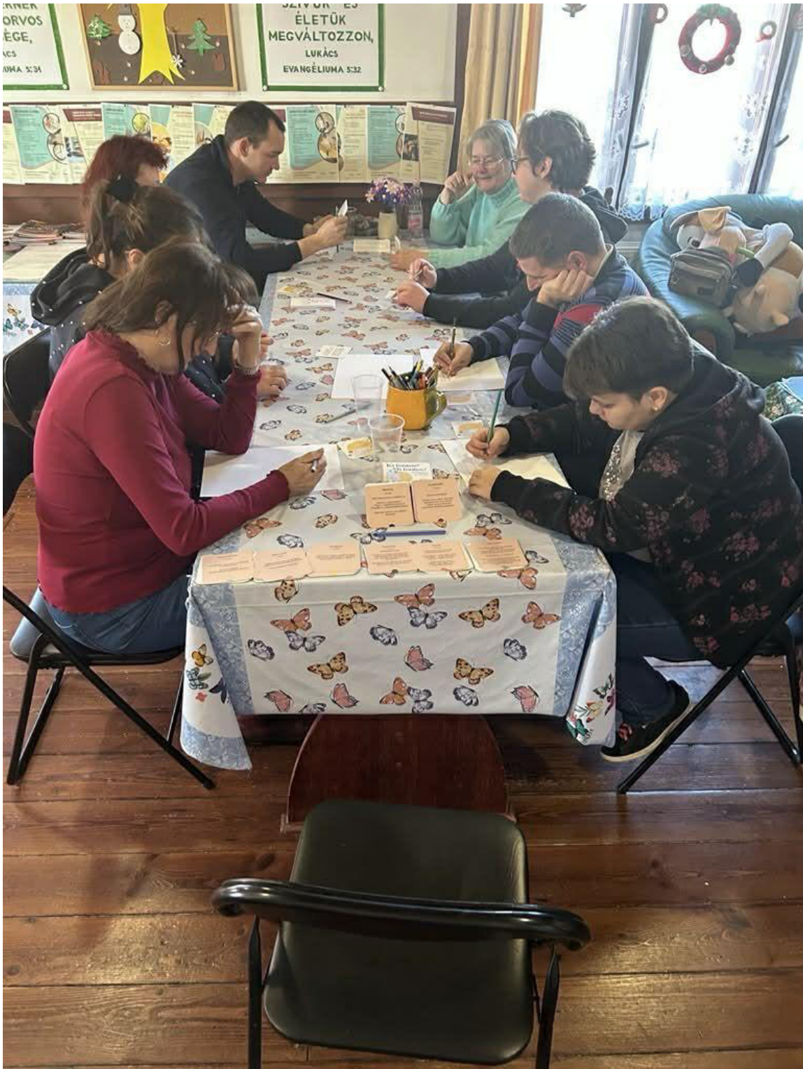
3. ábra - Érzés csoport

Új Esély Központ Veresegyház Cím: 2112 Veresegyház, Szabadság utca 18. Tel: 06/70-646-05-19 E-mail: veresegyhaz@btesz.hu