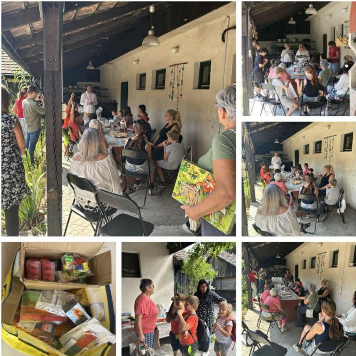
10. ábra - Tanszerosztás

Új Esély Központ Veresegyház Cím: 2112 Veresegyház, Szabadság utca 18. Tel: 06/70-646-05-19 E-mail: veresegyhaz@btesz.hu