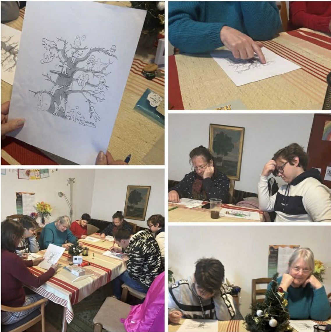
13. ábra - Érzés csoport