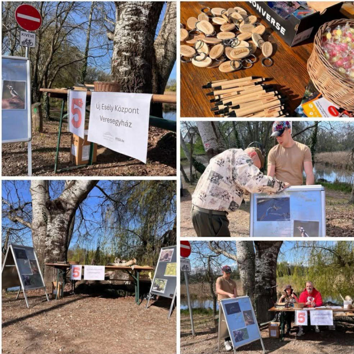
11. ábra - Kitelepülés – Rinya túra

Új Esély Központ Veresegyház Cím: 2112 Veresegyház, Szabadság utca 18. Tel: 06/70-646-05-19 E-mail: veresegyhaz@btesz.hu