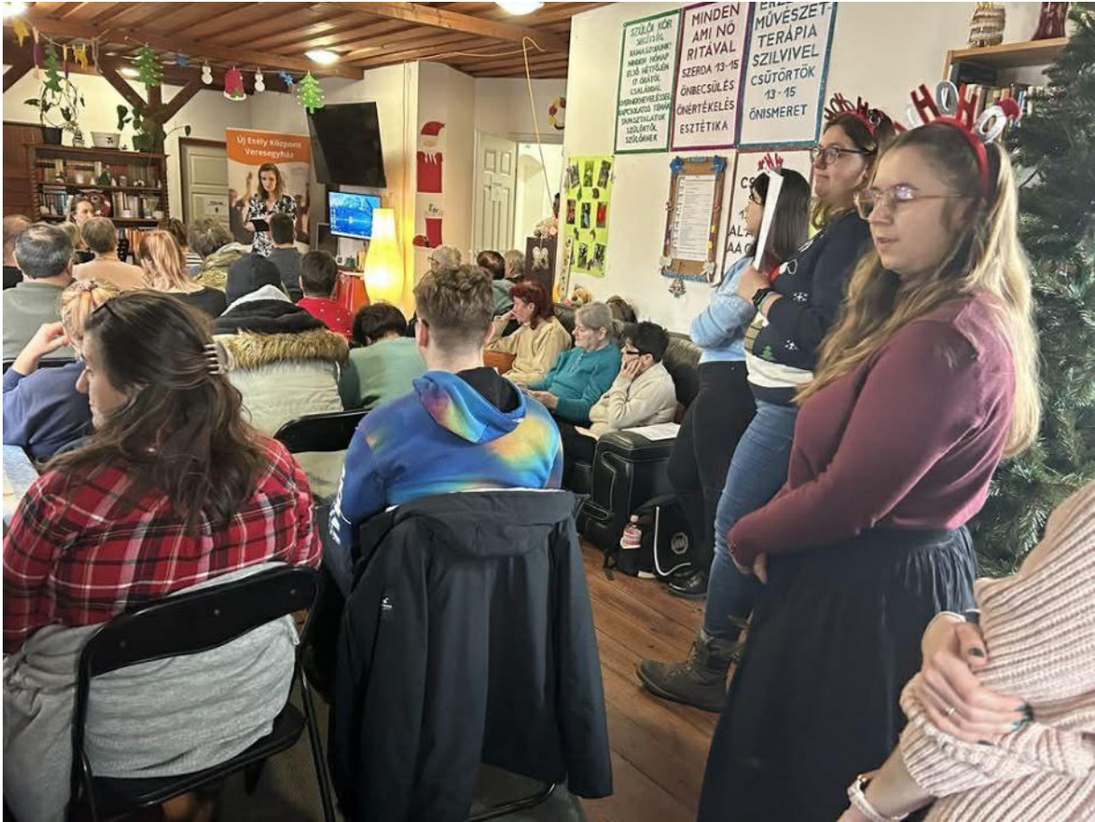
16. ábra - Ellátotti karácsony