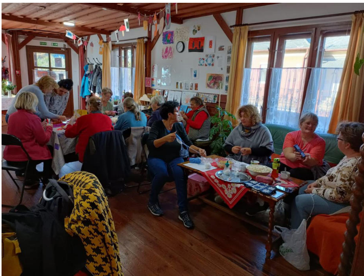
5. ábra - Minden, ami nő csoport