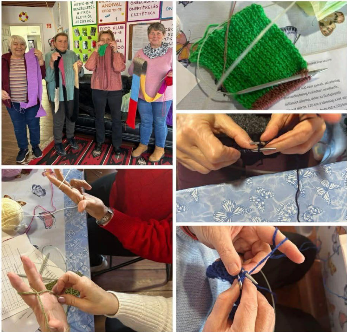
9. ábra - Köttusa kampány