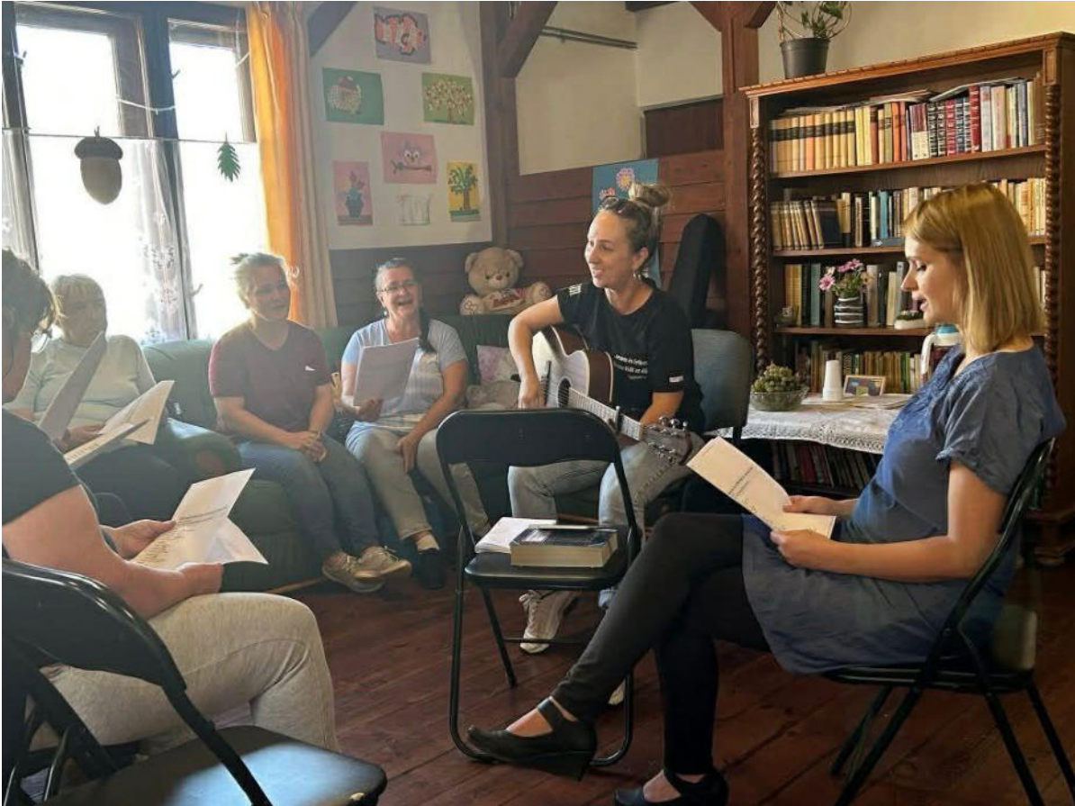
4. ábra - Dicsőítőink