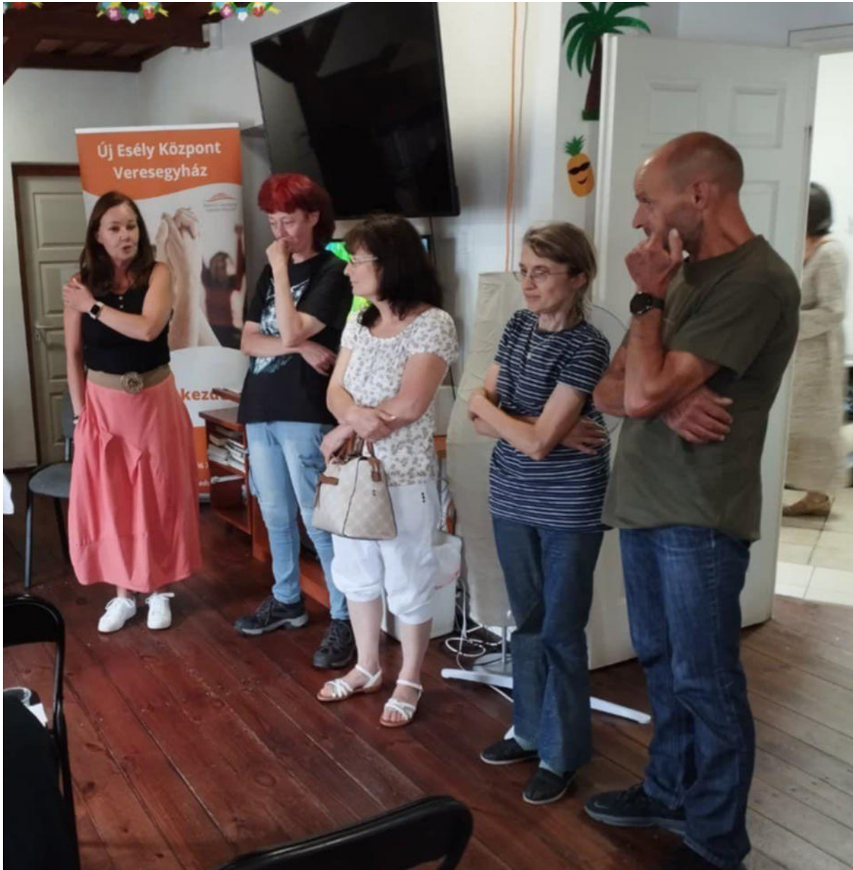
6. ábra - Fotóklub csapata

Új Esély Központ Veresegyház Cím: 2112 Veresegyház, Szabadság utca 18. Tel: 06/70-646-05-19 E-mail: veresegyhaz@btesz.hu