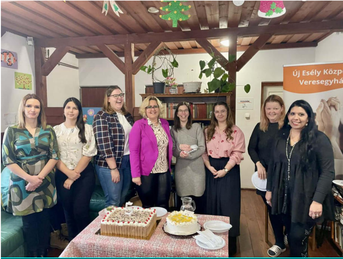
1. ábra A veresi stáb