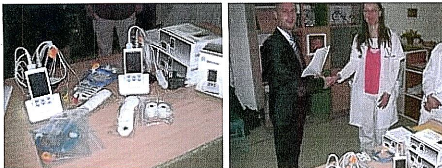
2014-ben a Kistarcsai Flór Ferenc Kórház Gyermekosztály részére egy infúziós pumpát is adományoztunk