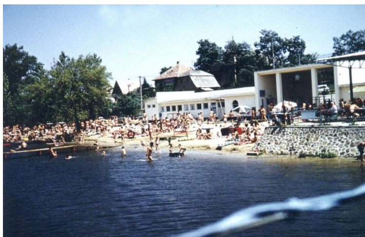
A strand 1974-ben, a hídról fotózva

1996-ban mindenki abban reménykedett, hogy az átadott szennyvíztisztító megszünteti a Malom-tó külső kommunális terhelését, azonban a tervektől eltérő kivitelezés, a rossz üzemeltetés, majd a telep túlterhelése miatt paradox módon másfél évtizedig a tisztómű lett a térség legnagyobb vízszennyezőforrása.