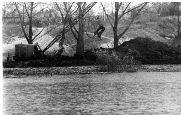
Úszóláp kotrás a Malom-tó keleti partján (1971)

1996-ban mindenki abban reménykedett, hogy az átadott szennyvíztisztító megszünteti a Malom-tó külső kommunális terhelését, azonban a tervektől eltérő kivitelezés, a rossz üzemeltetés, majd a telep túlterhelése miatt paradox módon másfél évtizedig a tisztómű lett a térség legnagyobb vízszennyezőforrása.