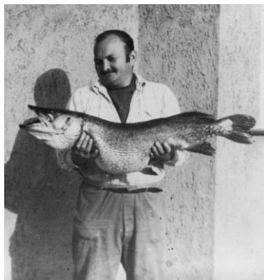
Egy természetes csuka a Malom-tóból