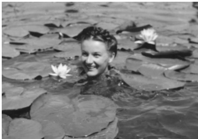
Tavirózsák közt, 1950 körül