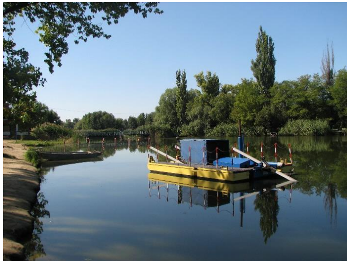
Iszapszivattyúzó hajó a strand területén (2010)

2009-2010 folyamán végezték el a Malom-tó rehabilitációját, melynek célja a belső szennyezettség csökkentése (iszap eltávolítása), és a természetes öntisztító-képesség növelése volt (hínárpusztító amur állomány gyérítése, eredeti hínárnövényzet visszatelepítése stb.). A rehabilitáció csak részben sikerült (a visszatelepített hínár nem maradt meg, részben azért, mert keveset telepítettek, és az amurokat nem sikerült jelentősen visszaszorítani), de a tóvíz bakteriális minősége javult, a fürdőélet hosszú évek után ismét el kezdett fellendülni.