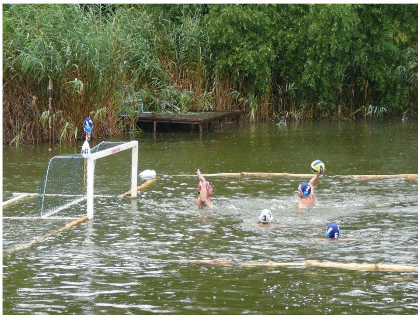
Vízilabda meccs a Malom-tavon az Octopus BVSE szervezésében (2010)

2009-2010 folyamán végezték el a Malom-tó rehabilitációját, melynek célja a belső szennyezettség csökkentése (iszap eltávolítása), és a természetes öntisztító-képesség növelése volt (hínárpusztító amur állomány gyérítése, eredeti hínárnövényzet visszatelepítése stb.). A rehabilitáció csak részben sikerült (a visszatelepített hínár nem maradt meg, részben azért, mert keveset telepítettek, és az amurokat nem sikerült jelentősen visszaszorítani), de a tóvíz bakteriális minősége javult, a fürdőélet hosszú évek után ismét el kezdett fellendülni.