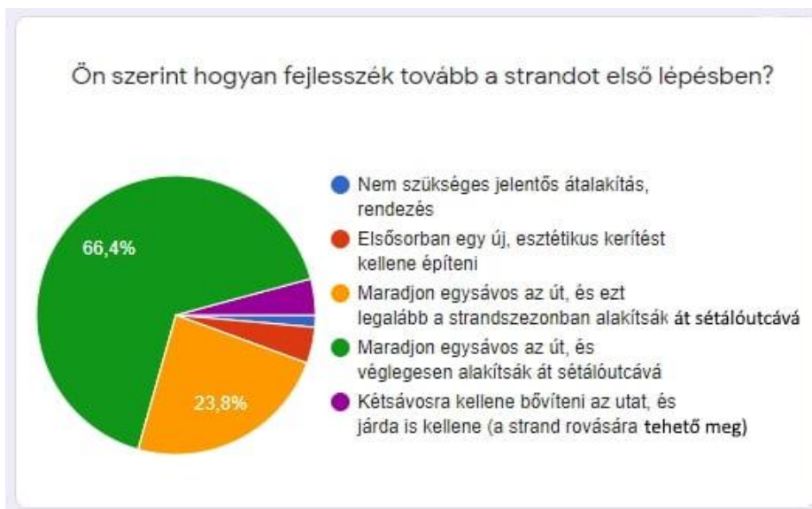
A 2021 őszén készült online lakossági felmérés eredménye (144 válasz)