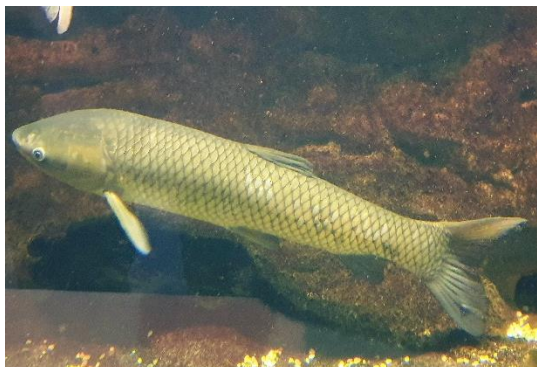
A víztisztító hínárt kipusztító amurt először 1966-ban telepítették a Malom-tóba