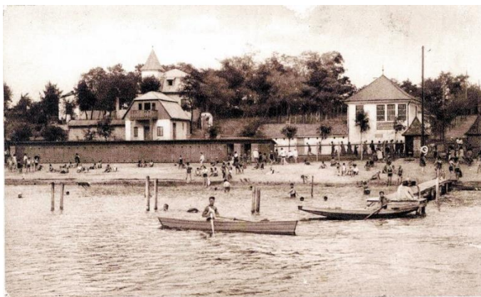
Veresegyház. Strandfürdő. Wekerle-pensio.