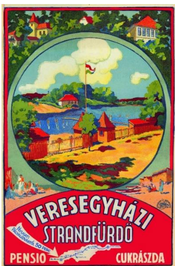
Pádlly Aladár plakátja az 1930-as évekből

A tónak minden korban meg volt a gazdasági, társadalmi és környezeti szerepe/jelentősége. Míg a középkortól egészen a XX. század közepéig a vízimalom működtetése, a halászat és a rákászat volt a meghatározó, addig az 1930-as évektől a strandolás, majd a horgászat került előtérbe. A tóstrand 1928-ban nyitotta meg kapuit, és nagyon élénk fürdőélet jött létre: a Nyugati pályaudvartól különvonatok indultak (átszállással együtt 50 perces menetidővel!), úszó- és vízilabdaversenyeket szerveztek, hétvége pedig alig akadt kiadó szállás a környéken. A II. világháború után ismét fellendülés jött, és egészen az 1980-as évek végéig töretlen népszerűségnek örvendett a strand. Ha valaki nem érkezett időben, akkor az összehajtott (!) törölközőjének is alig jutott egy talpalatnyi hely.