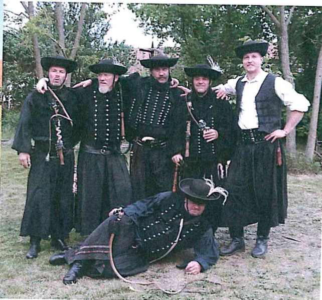
És egyéb rendezvények- főzőversenyek: