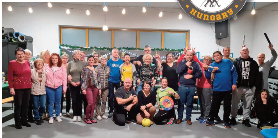
SE évzáró csapatkép 2024