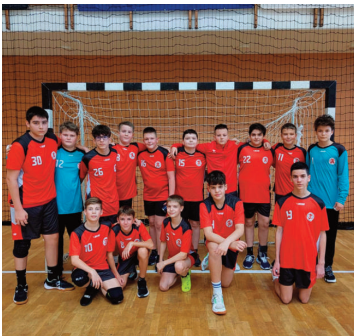
IV. korcsoport fiú kézilabda csapat