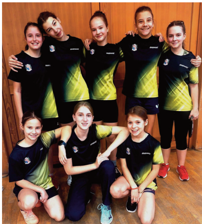
Két versis iskola egy csapata