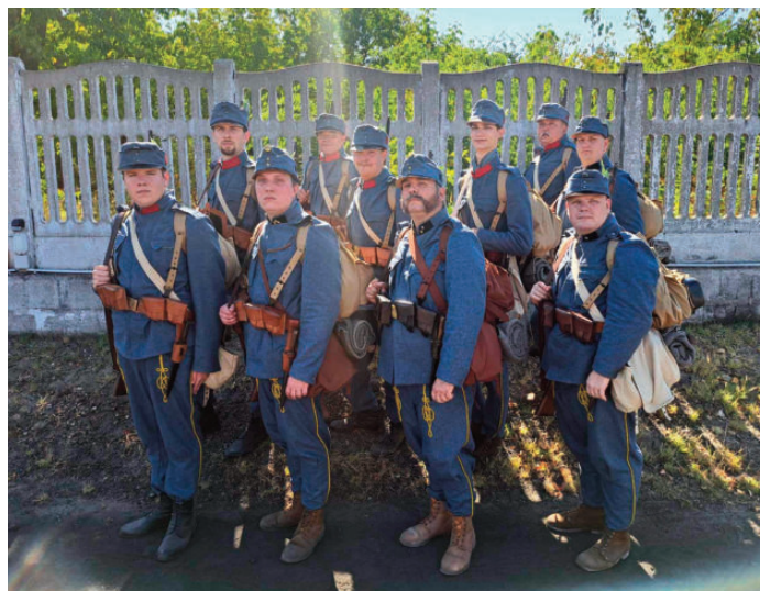
Első világháborús egyenruhákban