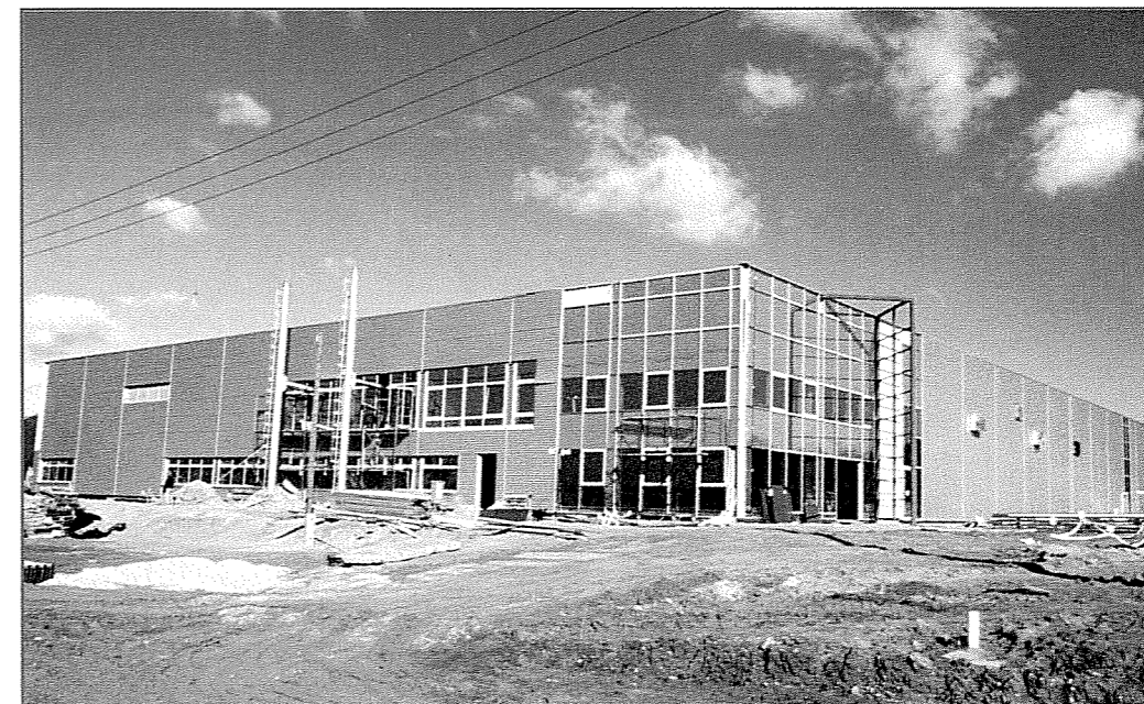
A General Electric épülete