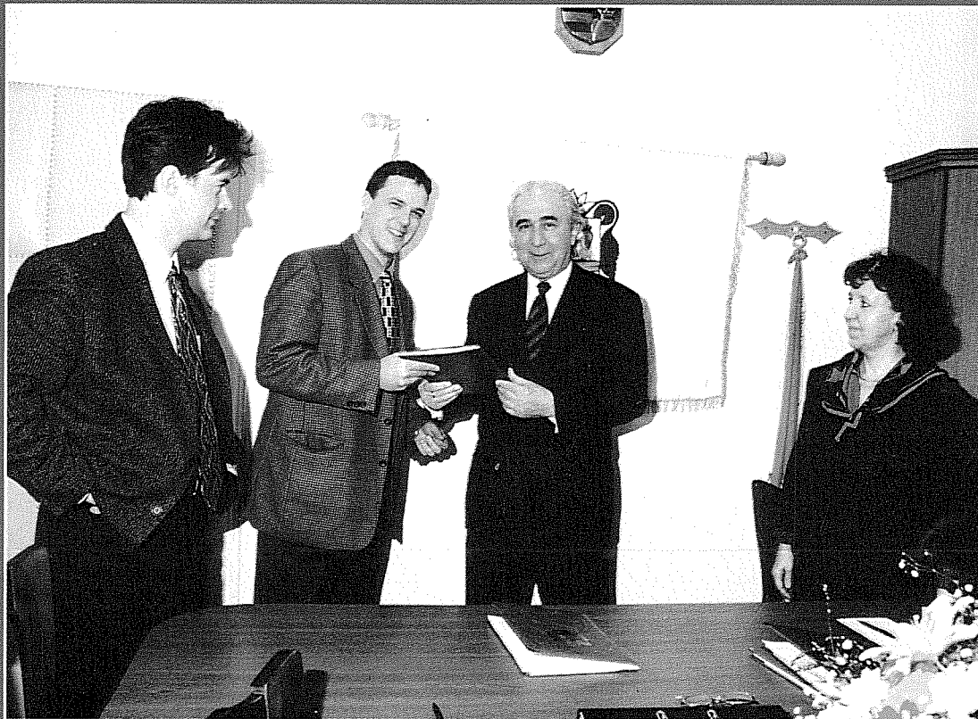
A zöldmezős beruházás aláírás utáni pillanatkép. A szerződő felek: a General Electric képviselői és Veresegyház polgármestere

A veresegyházi polgármesteri hivatalban – április 6-án – ünnepélyes keretek között az érdekelt felek aláírták azt a szerződést, mely többek között azt is tartalmazza, hogy General Electric Hungary Rt. földterületet vásárol a veresegyházi önkormányzattól, ahol zöldmezős beruházással gyárat létesít.