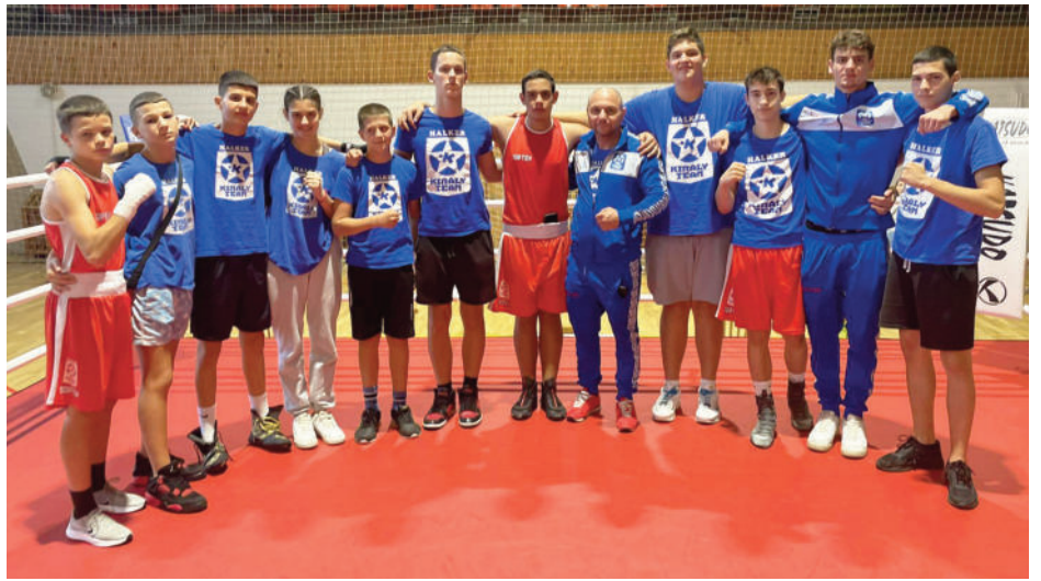
A versenyzői csapat

Egyáltalán nem, ez inkább egy technikai sport, amihez nagyon komoly állóképesség kell. Vannak szülők, akik azért hozzák be a gyereket, mert vere-