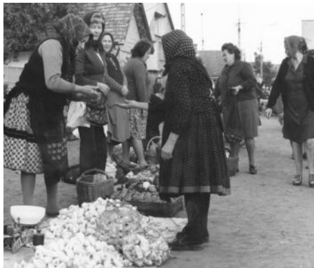
Piaci árusok az 1970-es években

Piac az 1930-as években, háttérben most a Coop épülete van.