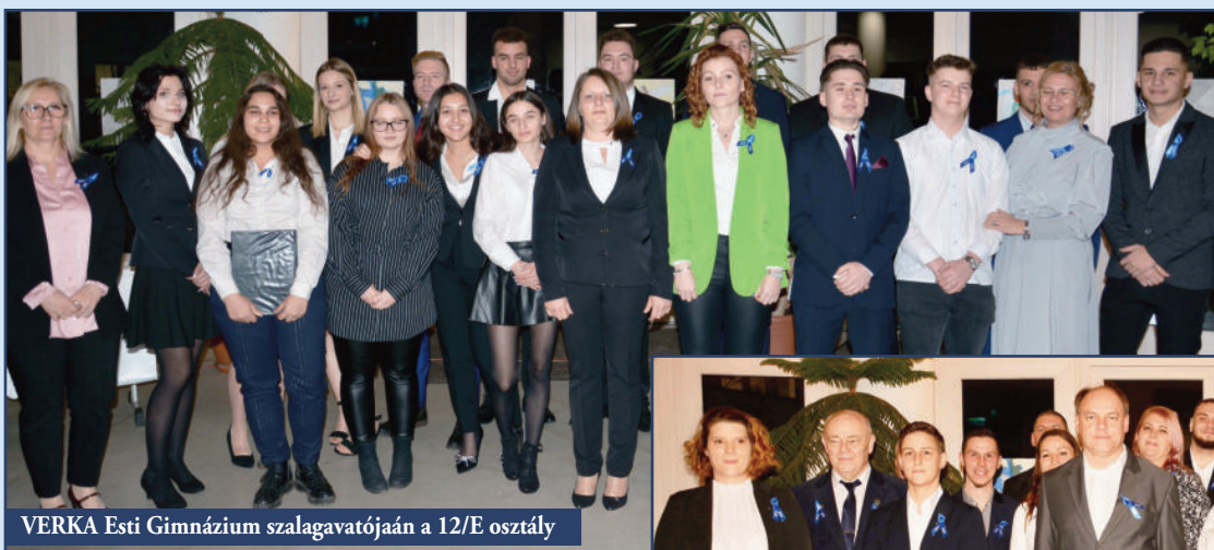
VERKA Esti Gimnázium szalagavatójaán a 12/E osztály