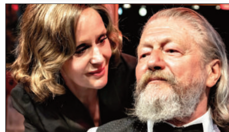
Winston és Garbo

A történelmi tényeken alapuló és anekdotákból jól ismert bonmot-kal operáló darab mégsem a két világhíresség miatt volt megkapó a veresegyházi színpadon. Két olyan kaliberű honi színészegyéniséget