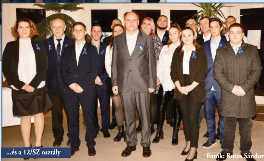
...és a 12/SZ osztály