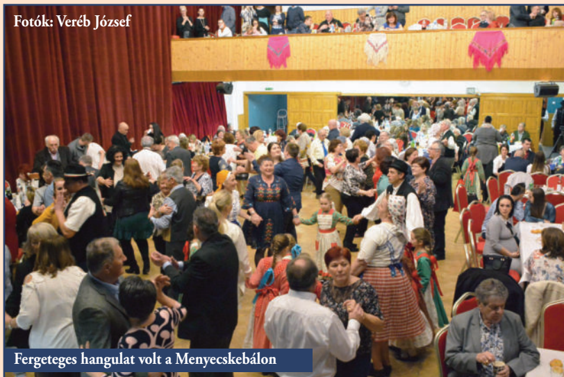
Fergeteges hangulat volt a Menyecskebálon