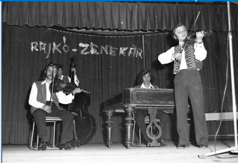
A veresgyházi RAJKÓ ZENEKAR az 1970-es években