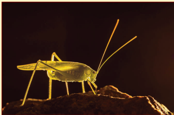
Természet és táj kategória I. helyezettje: Halmos Endre – Marsjáró