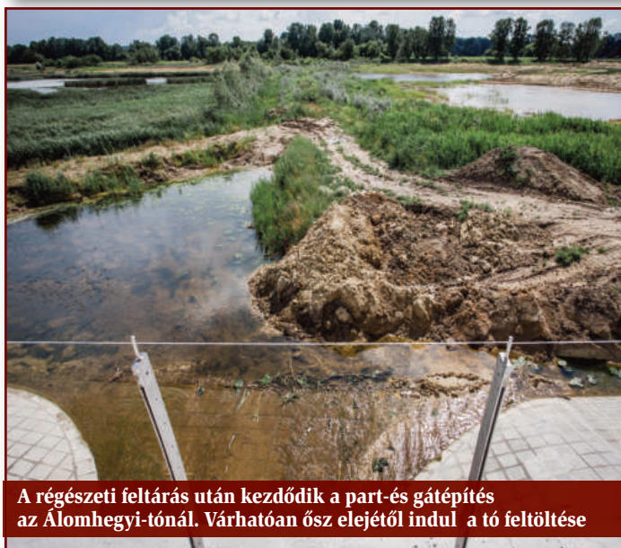
A régészeti feltárás után kezdődik a part-és gátépítés az Álomhegyi-tónál. Várhatóan ősz elejétől indul a tó feltöltése