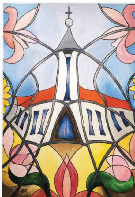
2. helyezett: Haraszin Flóra Napsugár: Rózsaablak