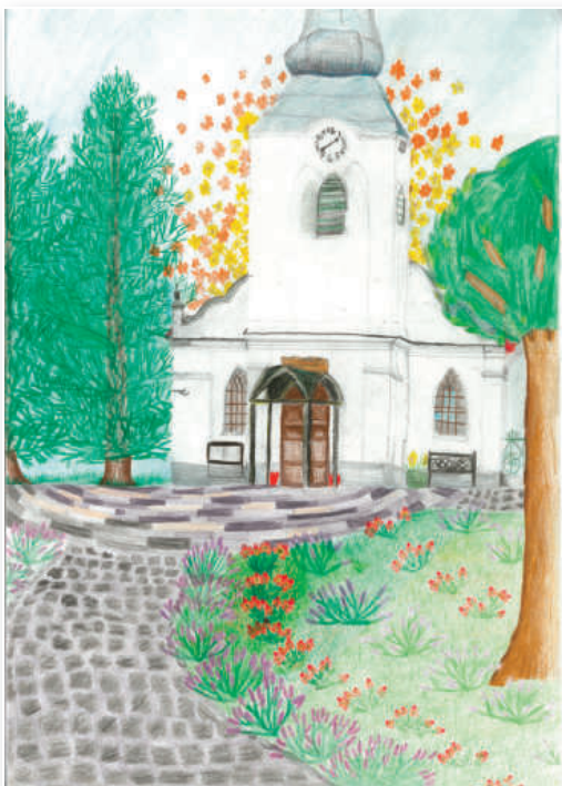
3. helyezett: Kurucz Virág: Kálvin téri virágáradat