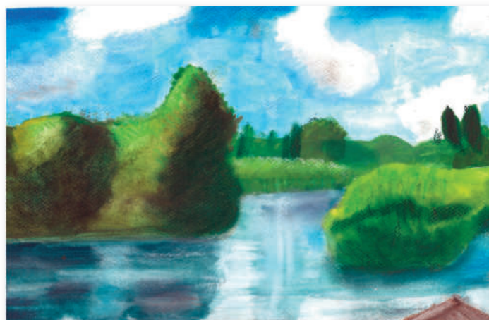
1. helyezett: Nyári Léna Boróka: Tóparti nyugalom