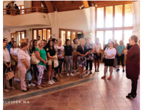
Látogatás a Fabriczius József Általános Iskolában

ként a szakmai kapcsolat, hiszen sok esetben már évekre visszatekintő barátságról beszélhetünk. Elég, ha csak az általános iskolások közös sportversenyeire, vagy akár a művészeti kiállításokra gondolunk.