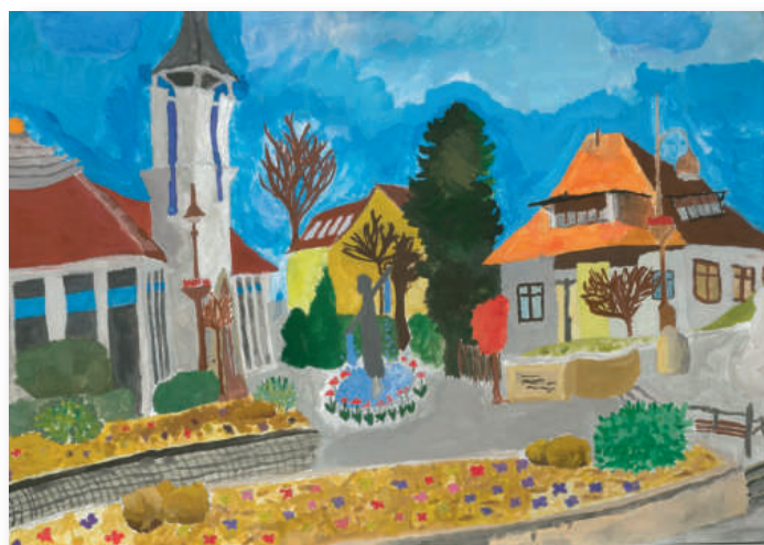
2. helyezett: Sasi-Szabó Hanna: Új szobor a Szentlélek téren