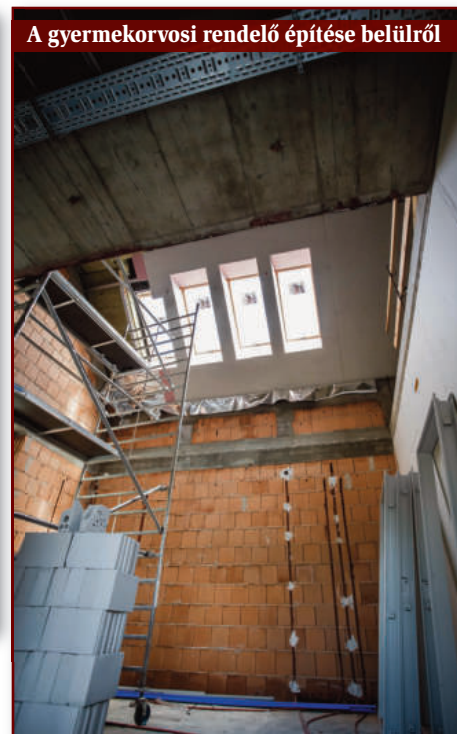
A gyermekorvosi rendelő építése belülről