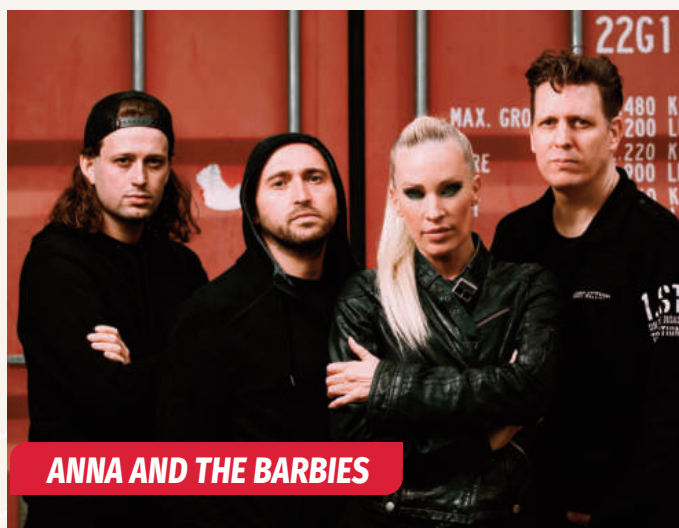
ANNA AND THE BARBIES