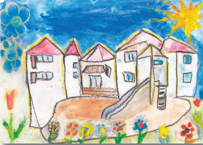
1. helyezett: Szabó Hajnalka: Iskolám