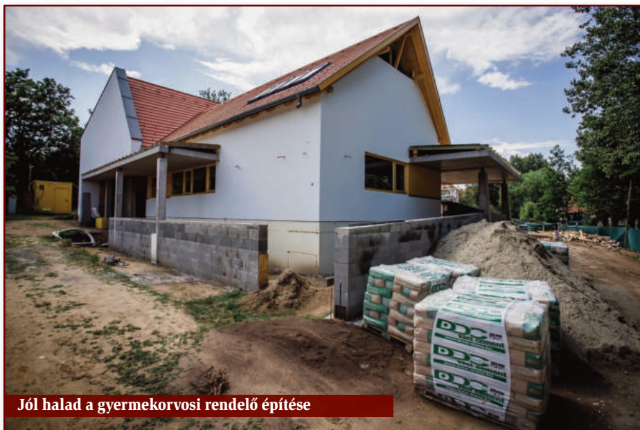
Jól halad a gyermekorvosi rendelő építése