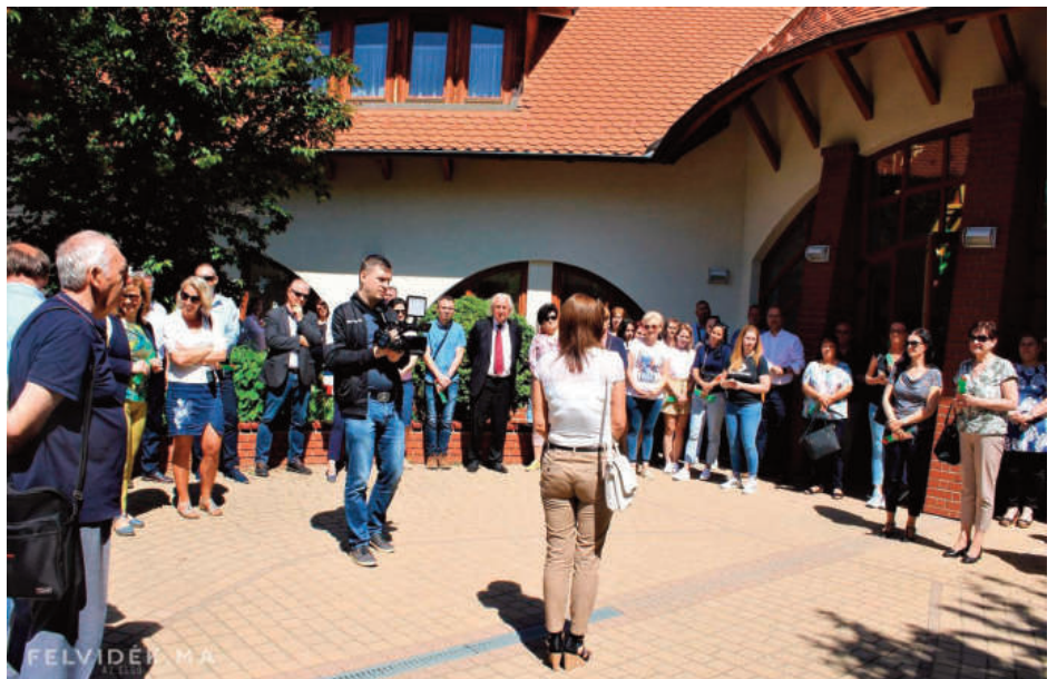
Betekintettek a Csonkási Óvodába

A kötetlen, őszinte eszmecsere hozó látogatás e hangneme megmaradt a Csonkási Óvodában, a Kucsa Tamás Városi Sportcsarnokban, majd a Veresegyházi Katolikus Gimnáziumban is, ahol folytatódott a veresegyházi oktatási helyzettel való ismerkedés. Nem minden intézmény esetében új egyéb-