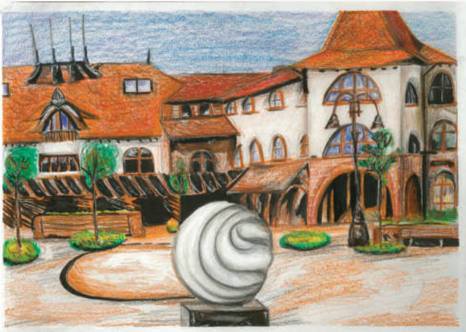
2. helyezett: Kóti Liliána: Fő tér