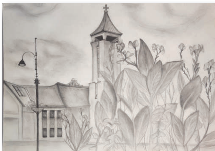
3. helyezett: Csibi-Kuti Gergely: Szentlélek-templom