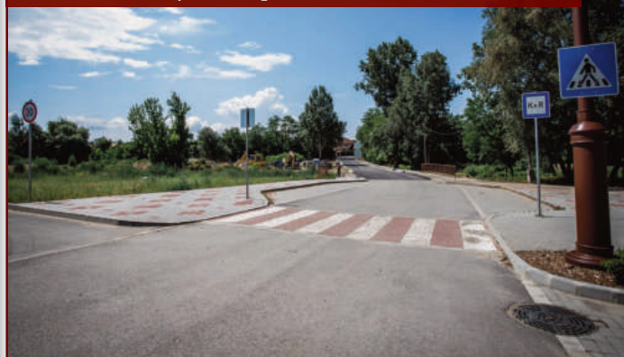
Elkészült a Mézesvölgyi Iskola és a Pacsirta út összekötése. Az útszakaszhoz járda is épül