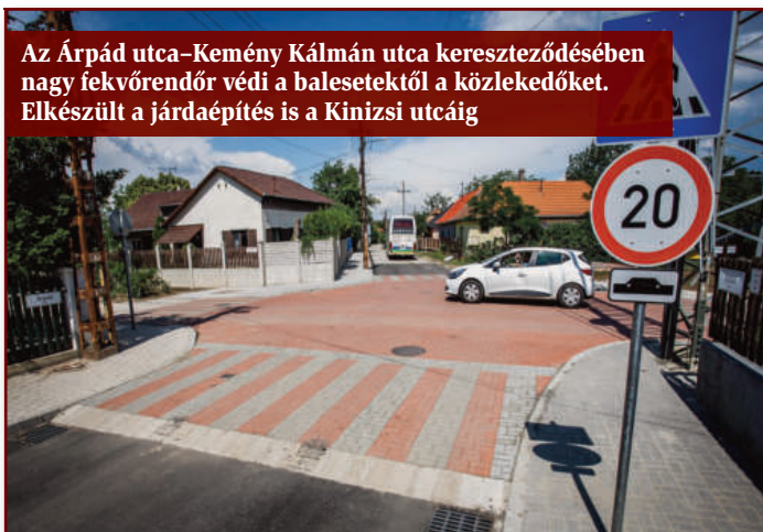
Az Árpád utca–Kemény Kálmán utca kereszteződésében nagy fekvőrendőr védi a balesetektől a közlekedőket. Elkészült a járdaépítés is a Kinizsi utcáig