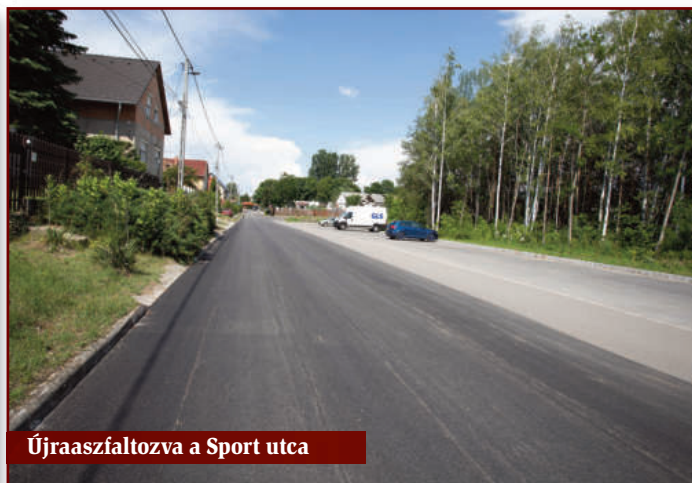
Újraaszfaltozva a Sport utca