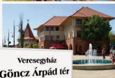
Veresegyház Göncz Árpád tér

16.00 „Göncz Árpád Veresegyházon” Emlékkiállítás és ünnepélyes térnévadó rendezvény