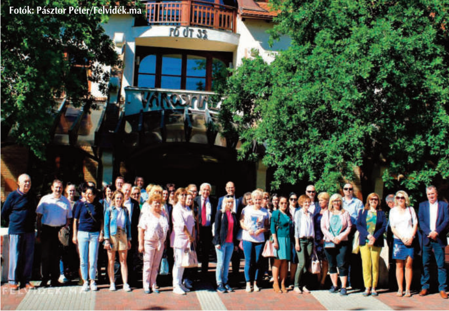
Az ipolysági delegáció a veresegyházi városháza előtt

Kettős célja volt a félszáz fős delegáció érkezésének: az ismerkedés és a szakmai eszmecsere. A Štefan Gregor ipolysági polgármester vezette delegációt Pásztor Béla, Veresegyház polgármestere fogadta a Városháza dísztermében. Mint köszöntőjében kiemelte, Ipolyság mindig is közel állt a szívéhez, hiszen ipolybalogi származású gyerekként Ipolyság volt az első város, amiben járt és a mai napig is tapasztalja az ott lakó emberek barátságát, közvetlenségét. Révész Angelika, az Ipolysági Városi Hivatal tanügyi munkatársa leszögezte, hogy olyan szempontból min- denképpen egyedülálló a mostani látogatás, hogy most először fordul elő, hogy Ipolyság minden tanintézménye (szlovák és magyar iskolák és óvodák egyaránt) képviseltetik magukat a veresegyházi szakmai ismerkedésen.