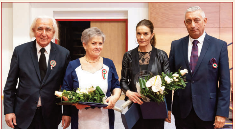
A március 15-i ünnepi eseményen vehette át a Veresegyházi Hagyományörző Népi Együttes a részére a Pest megyei közgyűlés által 2021-ben odaítélt, PEST MEGYE NÉPMŰVÉSZETÉÉRT DÍJÁT. Gratulálunk!