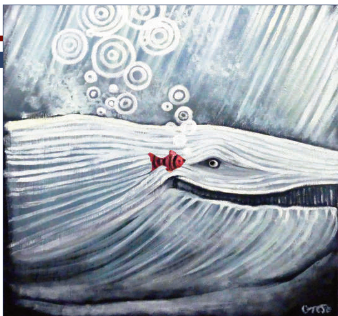
Barátság (40×40 cm, vászon, olaj)