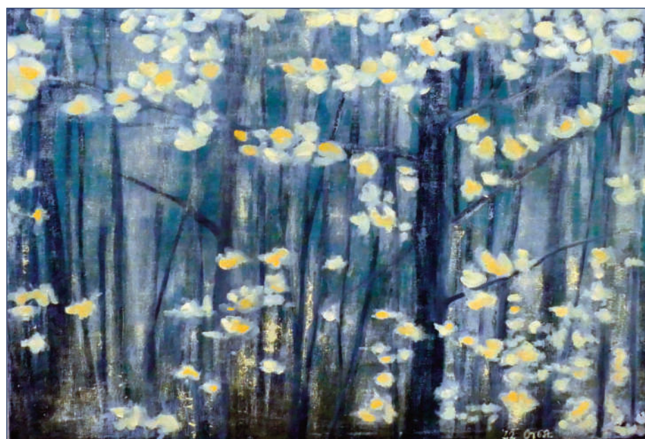
Szakrális helyek III. (90×110 cm, feszített vászon, olaj)