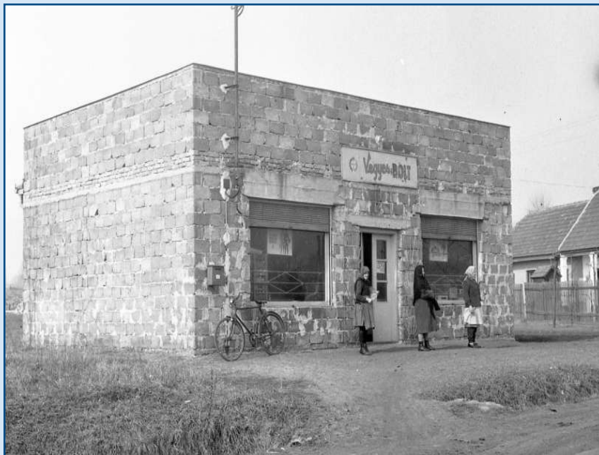
Vegyesbolt a Mogyoródi út és a Csomádi út sarkán az 1960-as években. Később bővítették, ma a Veresegyházi Tánciskola épülete