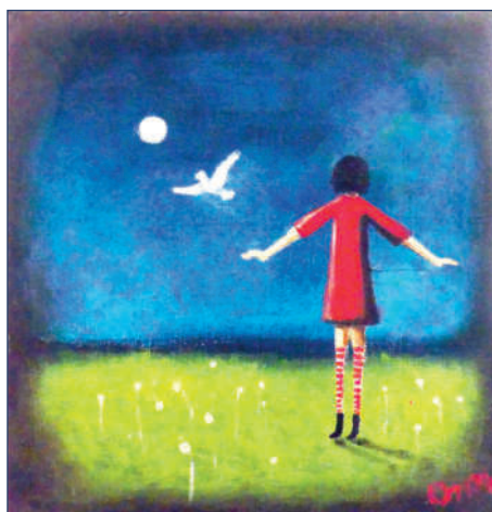
Lányka galambbal (20×20 cm, vászon, olaj)

magam, hogy az első évfolyamban végezhettem. Mindig is filozofikus szemlélettel éltem az életem, a diploma után pedig pláne, de tanítási módszereimre közvetlenül nem az ott tanultak hatottak, inkább csak tovább csiszoltak szemléletemen, életfilozófiámon, mely viszont alapvetően meghatározza tanítási módszereimet. Valójában első igazi munkahelyemen, a budapesti Hallássérültek Intézetében volt módom gyógypedagógusoktól, pszichológusoktól sokat tanulni e téren. Kutattam is sokat és maximalista ember lévén, próbáltam hatékony, eredményes munkát végezni. Mivel rajzot, művészetet tanítottam ott hosszú ideig, így volt rá lehetőségem, hogy alaposan kidolgozzak olyan új oktatásmódszertant a kollégák segítségével, amely a művészeti nevelést helyezi új alapokra. Miközben a Nyíregyházi Egyetemen a szakdolgozatomat