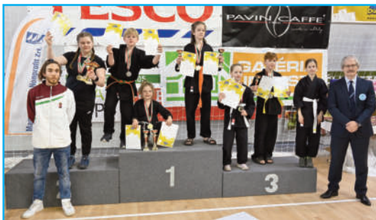
A Diákolimpán dobogós helyezetteink

A formagyakorlat csapatunknak – pontszerző versenyként – ez nagyon fontos volt, hisz nem más volt a tét, mint a szeptemberi Írországban megrendezésre kerülő WAKO Kick-box Utánpótlás Világbajnokság. Szerencsére ez jó irányba sarkallta a csapatot, így mindenki