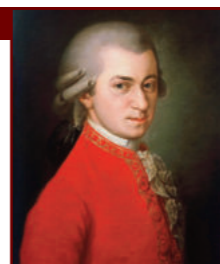
Wolfgang Amadeus Mozart

„Bár vitatott, hogy a mű mekkora hányada magáé Mozarté, a zene minősége minden aggodalmat eloszlat – főleg a bevezető hét ütem, az erőteljes duzzadó Dies irae, a Confutatis tisztaság és magasztos harmónia közötti ragyogó elentéte, vagy a Kyrie által keltett sebesség és csodálat érzésének vegyülete, nem is beszélve a lélegzetelállító Lacrimosa téletről, ami egyetlen nagy ívben fokozódik sóhajtaból ívöltéssé és vissza az Amenig.” FORRÁS: WIKIPÉDIA