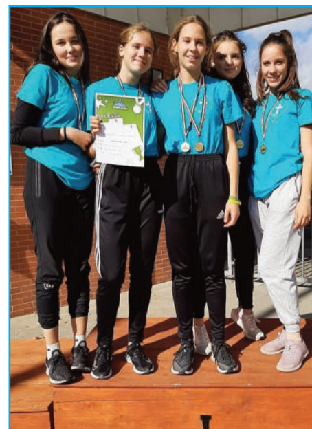
VERKA távolugró csapat