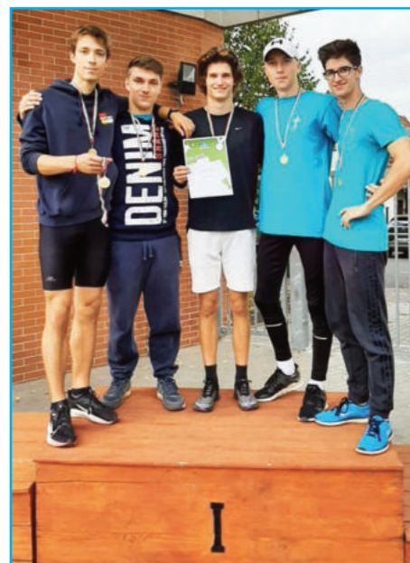
VERKA magasugró csapat