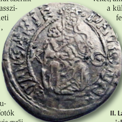
II. Lajos király (1508–26) ezüst pénze – jelenleg a váci múzeumban