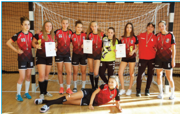
U15 leány csapat