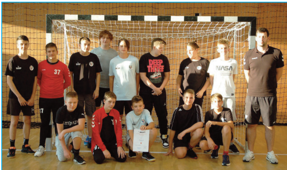
U14 fiú csapat