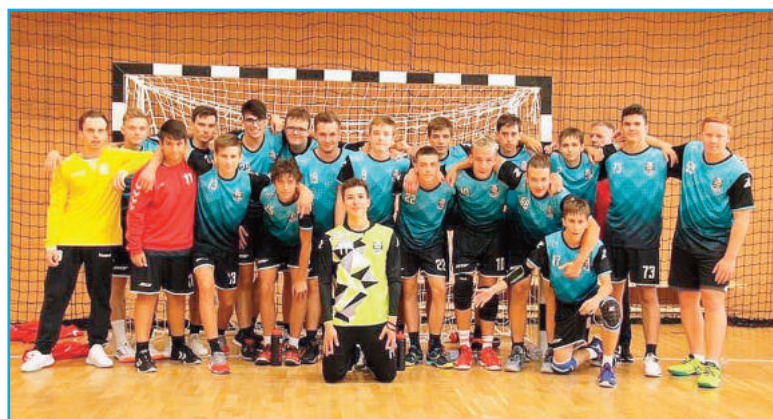
Serdülő fiú csapat