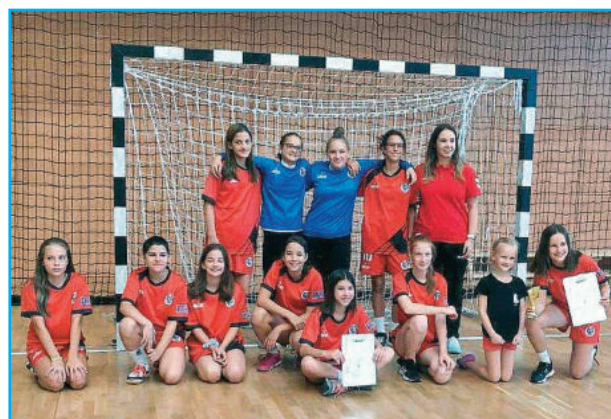
U13 leány csapat