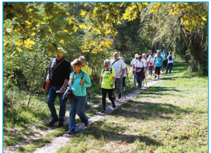
Folytatás a 26. oldalon

Sok ember nagyon sok munkát fektetett abba, hogy ez a nap még jobban sikerüljön, mint az előző évben. Napokkal előtte, jó házigazda módjára, előkészítették mindent, a verseny előtti napon kihelyezték a jelzéseket, előkészítették a terepet. Sajnálatos módon, meggondolatlan emberek vagy csak unatkozó fiatalok szimplán butaságból vagy „viccből” elforgatták a kihelyezett irányjelzőket, ezzel roppant kellemetlen helyzetet okozva, mivel