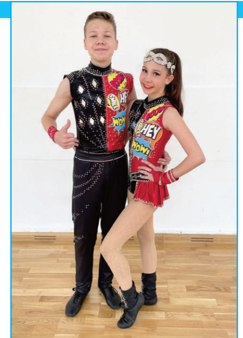
BKG U12-es csapat

cosainknak, illetve intenzív edzések, workshopokat versenyzőinknek. Júniusban még egy regionális és egy országos verseny vár ránk, melyre sportolóink nagy erőbedobással készülnek. Nagy büszkeséggel tölt el bennünket, hogy a Magyar TáncSport Szakszövetség június és augusztus végén ismét Veresegyházra rendezi a magyar válogatott táncosok edzősorozatát, melynek során Magyarország legeredményesebb rock and roll táncosai érkeznek hozzánk.