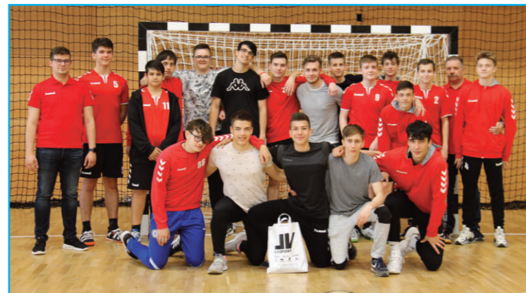
A 3. helyezett serdülő csapat