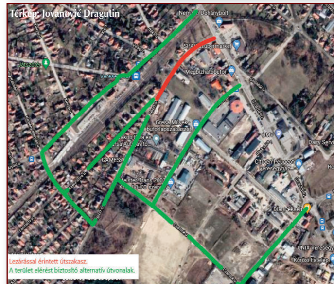
Lezárással érintett útszakasz. A terület elérést biztosító alternatív útvonalak.

Az önkormányzat megkezdte a Szent Imre utca felújítását. Első ütemben a Szadai út és a már felújított híd között zajlanak munkálatok. Az önkormányzat kéri a lakosságot, hogy az építkezés ideje alatt, különösen reggel 7-17 óra között gépjárművel kerüljék el az érintett szakaszt. (A lehetséges kerülő útvonalakról mellékeljük a térképet.) A gyalogos és kerékpáros forgalom lehetősége természetesen biztosított, illetve az érintett útszakaszon üzemelő boltok és szolgáltatók is nyitva lesznek, bár előfordulhat, hogy csak gyalogosan lesznek megközelíthetőek.