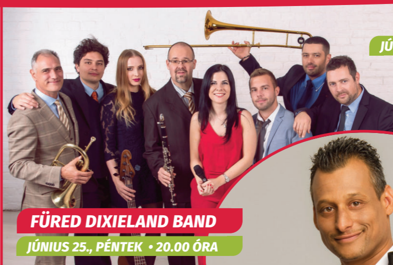
FÜRED DIXIELAND BAND