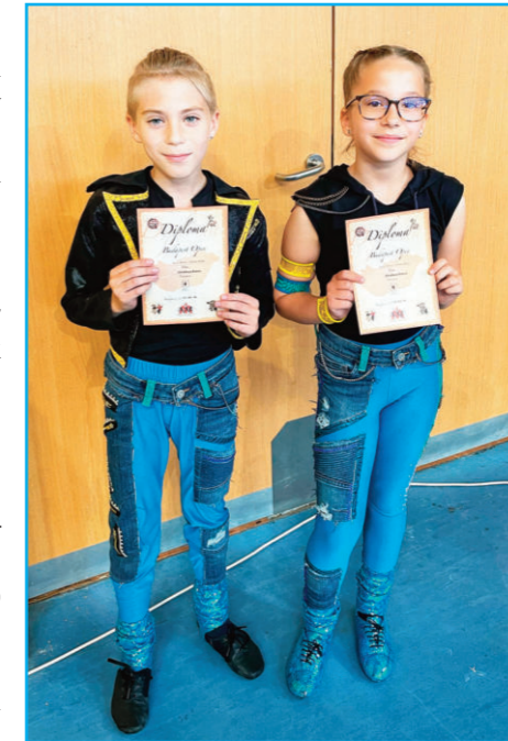
BKG U12-es csapat

Nyáron sem fogunk tétlenkedni, hiszen több nyári tábort szervezünk új és utánpótlás tán-