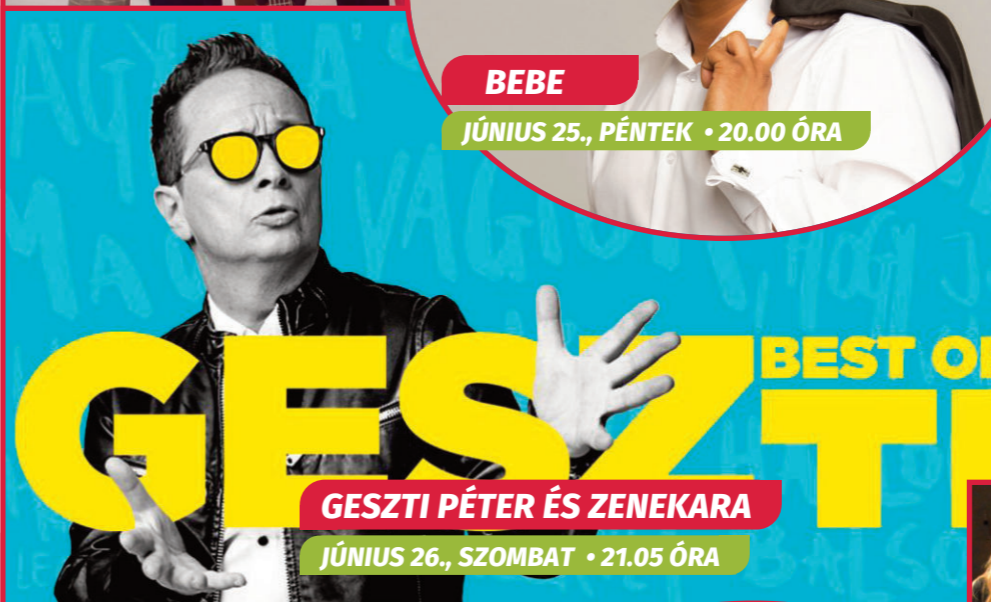
GESZTI PÉTER ÉS ZENEKARA