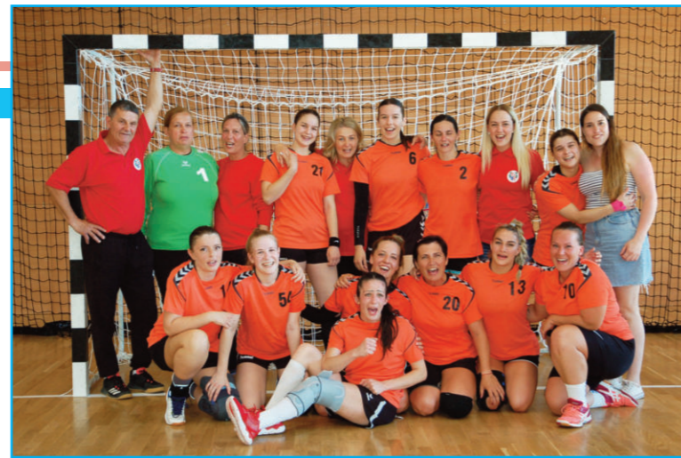
Női felnőtt csapatunk