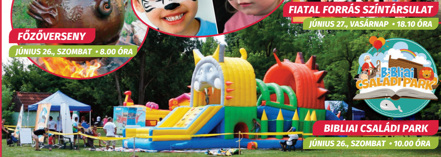
BIBLIAI CSALÁDI PARK