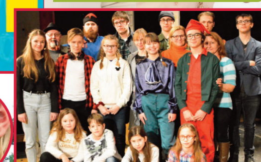
FIATAL FORRÁS SZÍNTÁRSULAT