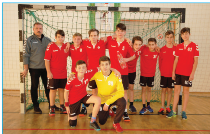
IV. korcsoportos csapat