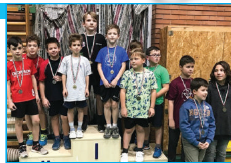
Kálvin Téri kisfiúk – 1. helyezés