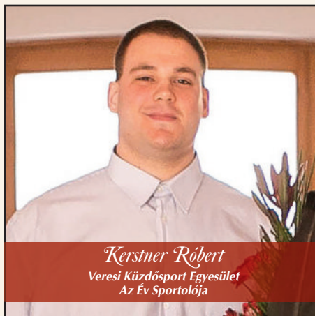
Kerstner Róbert Veresi Küzdősport Egyesület Az Év Sportolója