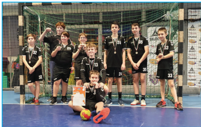
III. korcsoportos csapat