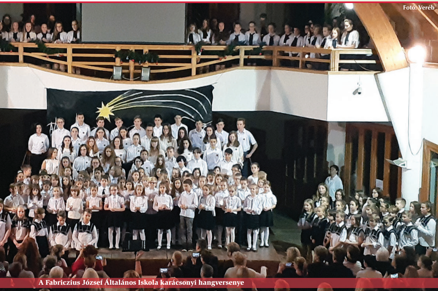
A Fabriczius József Általános Iskola karácsonyi hangversenye