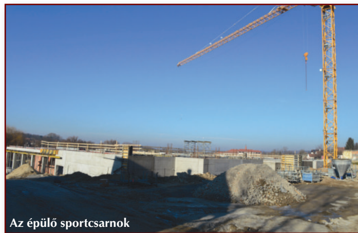
Az épülő sportcsarnok

Megtörtént a Veresegyházi Katolikus Gimnázium (Verka) melletti házak bontása, ezzel előkészítve a terepet a Verka itt építendő röplabda csarnokának, amely az iskola tornatermi igényeit is ki fogja elégíteni. Szintén a gimnáziumhoz tartozó hír, hogy a Fő út-Budapesti út lámpás