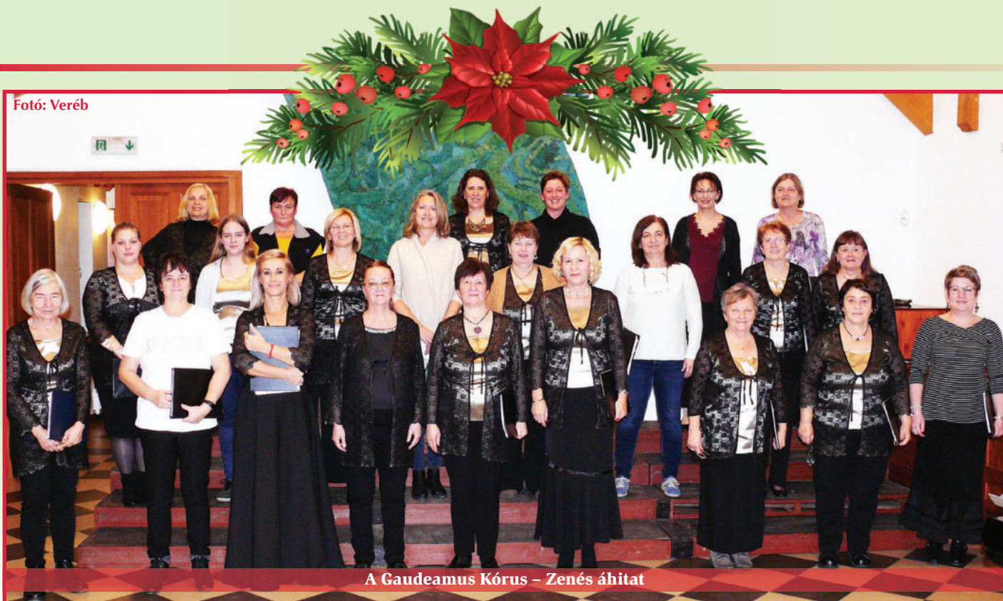
A Gaudeamus Kórus – Zenés áhítat