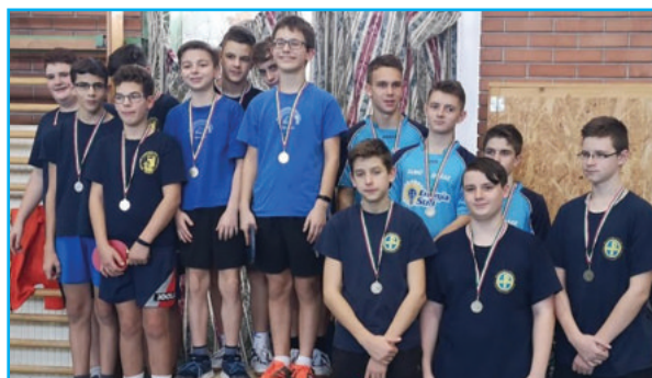
Aranyérmes Kálvin Téri nagyfiúk