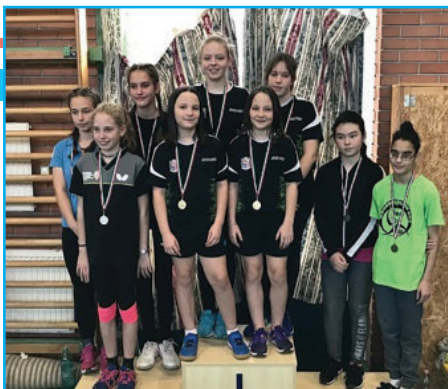
Fabriczius lányok – 1. helyezés

Fiúk (2008-2011): 1. Törőcsik Ferenc, 2. Herman Benedek, 3. Szaszák Áron, 4. Pyka Botond, 5. Csomay Szabolcs, 6. Körtvélyesi Ádám.