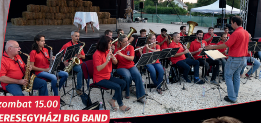
szombat 15.00 VERESEGYHÁZI BIG BAND