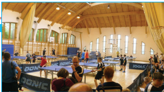
A verseny délelőtt