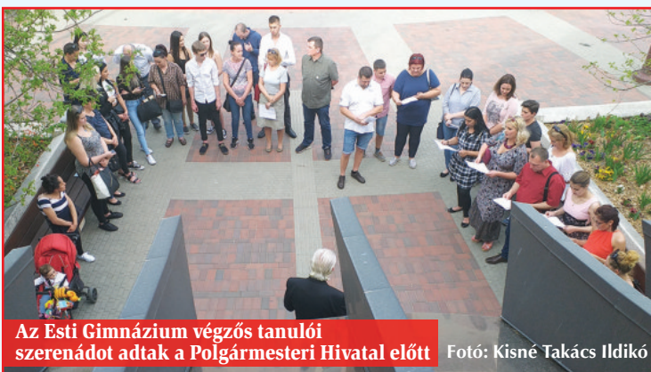
Az Esti Gimnázium végzős tanulói szerenádót adtak a Polgármesteri Hivatal előtt