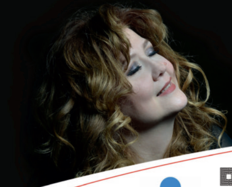
vasárnap 15.00 KOLONITS KLÁRA OPERAÉNEKES