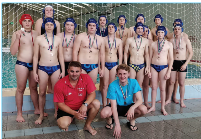
A 2004-es csapat