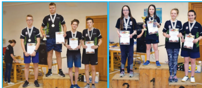
Fű 3. korcsoport