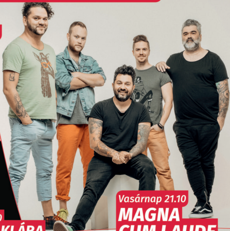
Vasárnap 21.10 MAGNA CUM LAUDE