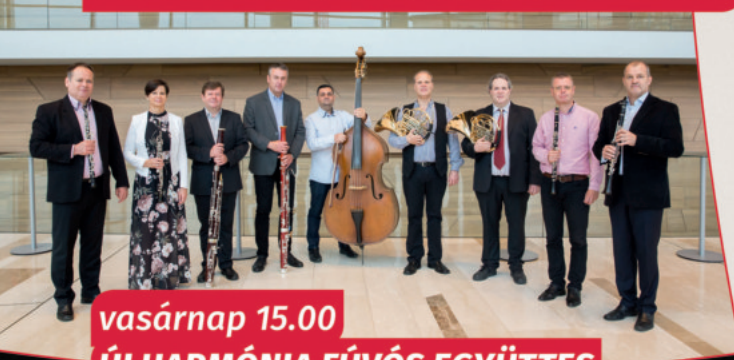
vasárnap 15.00 ÚJ HARMÓNIA FÚVÓS EGYÜTTES