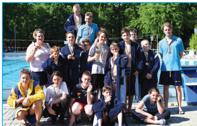
A 2006-os csapat