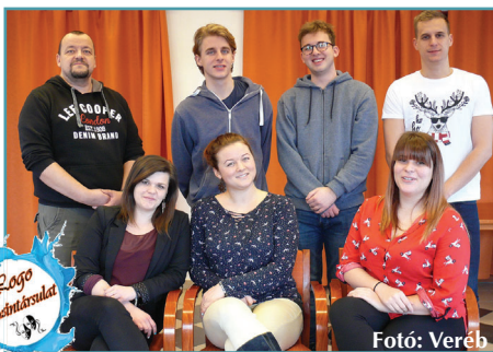
A program szervezői és a Logo Színtársulat

A munkába bevontuk a Logo Színtársulat tagjait, az ő előadásukban kerülnek majd a közönség elé az előre megírt jelenetek.