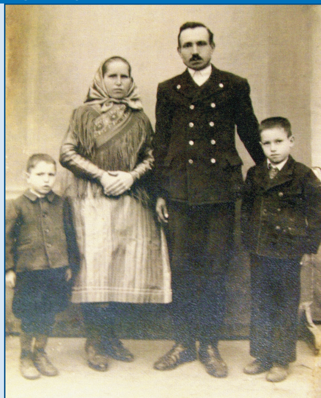
A Pásztor család az 1940-es években