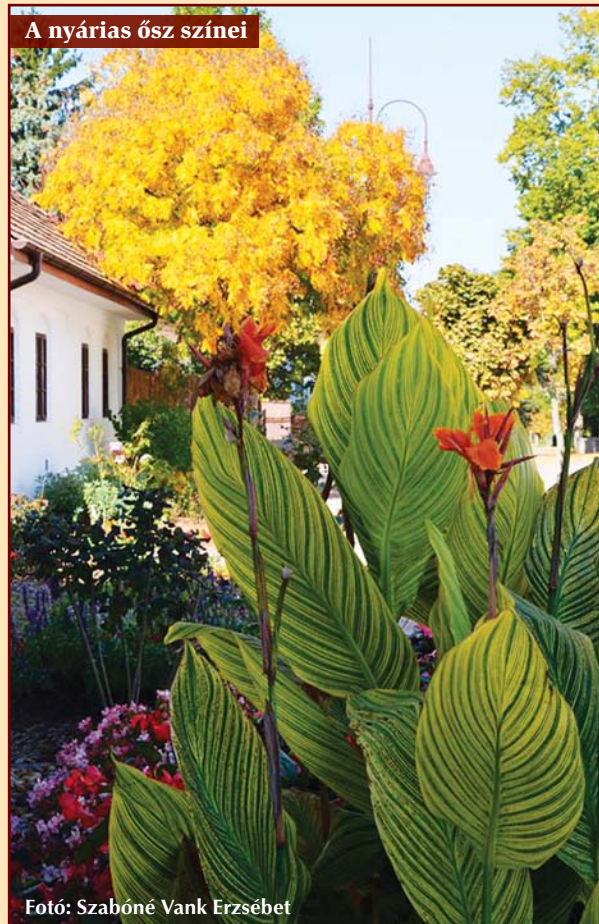
A nyáris ősz színei