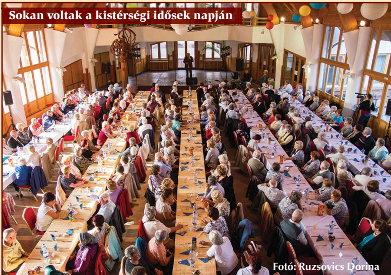
Sokan voltak a kistérségi idősek napján