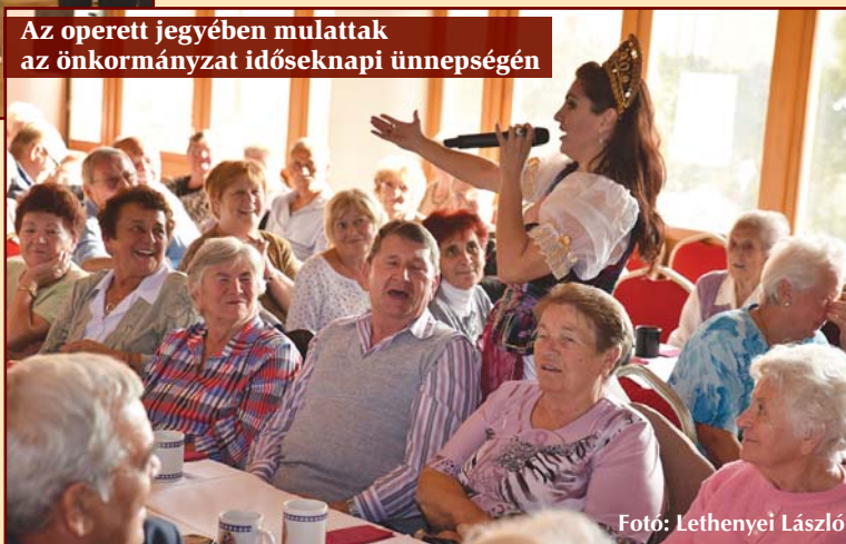
Az operett jegyében mulattak az önkormányzat időseknapi ünnepségén