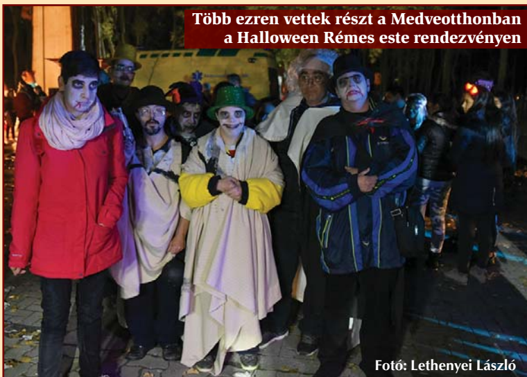
Több ezren vettek részt a Medveotthonban a Halloween Rémes este rendezvényen