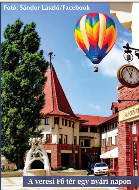
A veresi Fő tér egy nyári napon