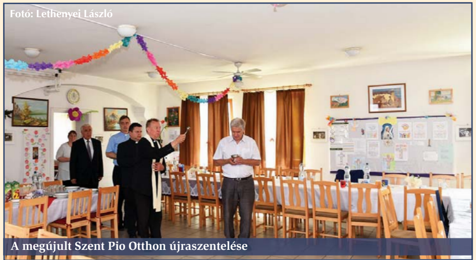
A megújult Szent Pio Otthon újraszentelése