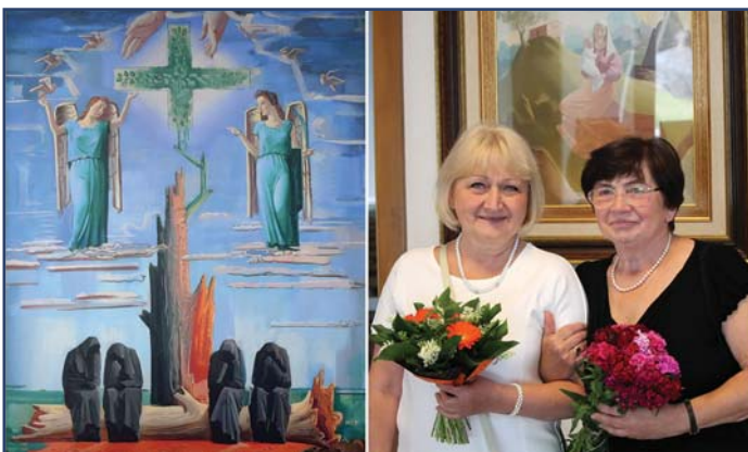
Molnár C. Pál kiállításán (képmontázs)