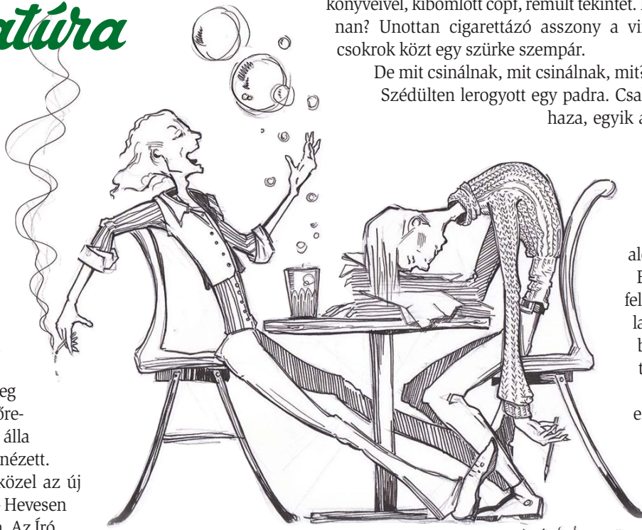
Költő és író (Grafika: Veréb Csilla)