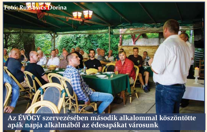
Az ÉVÖGY szervezésében második alkalommal köszöntötte apák napja alkalmából az édesapákat városunk