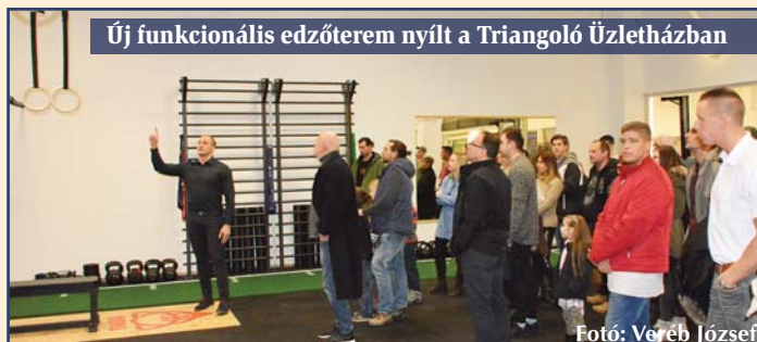
Új funkcionális edzőterem nyílt a Triangoló Üzletházban