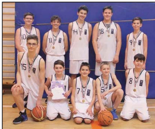
Fabriczius kosárlabda csapata