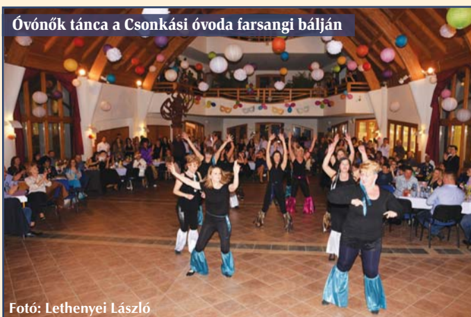
Óvónők tánca a Csonkási óvoda farsangi bálján