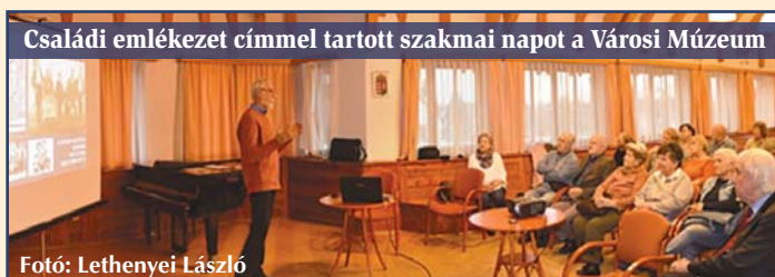
Családi emlékezet címmel tartott szakmai napot a Városi Múzeum