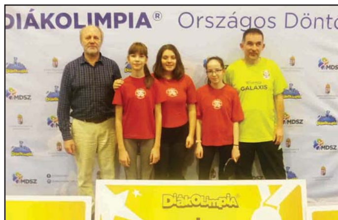
Fabriczius József Általános Iskola leány csapata