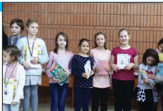
Fabriczius leány sakk csapat