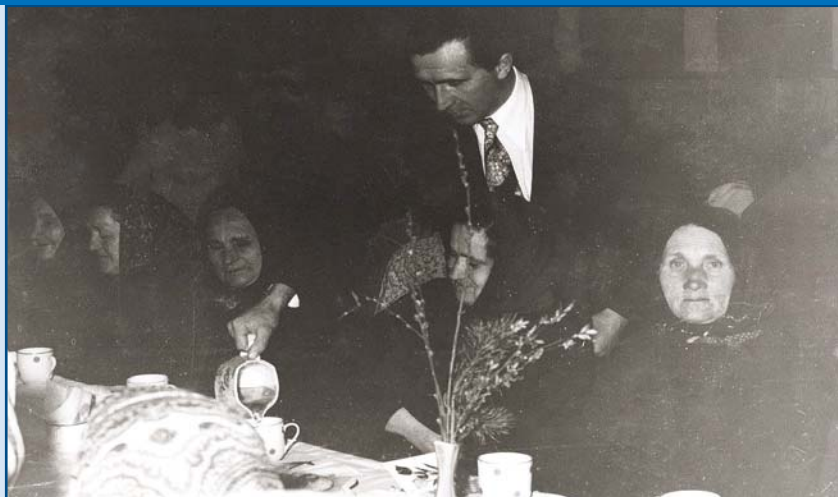
Nőnap az 1970-es évekből