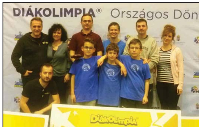
A Kálvin Téri Református Általános Iskola fiú csapata