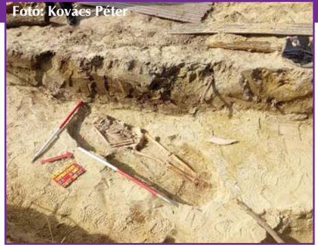
A magányos sírlelet