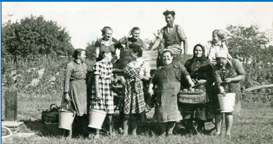
Szüretelők az 1960-as évek elején