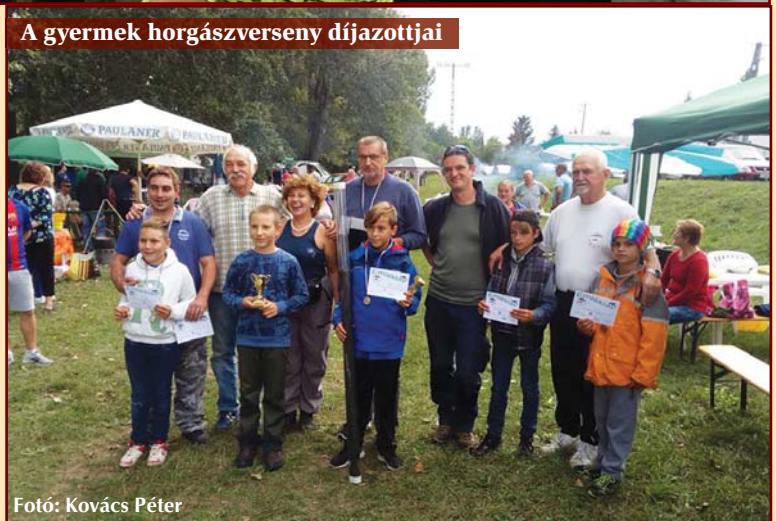
A gyermek horgászverseny díjazottjai