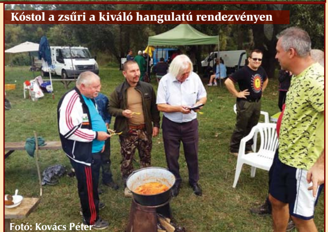
Kóstol a zsűri a kiváló hangulatú rendezvényen