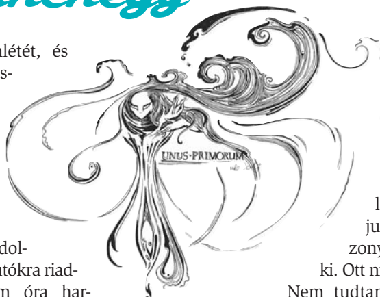
Grafika: Veréb Csilla

(Megjelent 2017-ben az ELTE BTK Szerdai Szalon irodalmi alkotókör antológiai válogatás kötetében.)