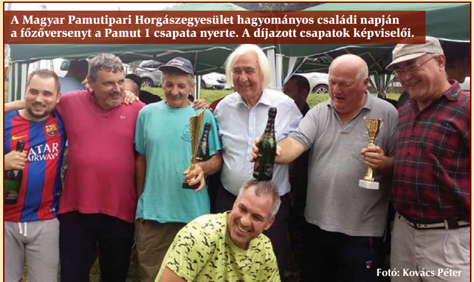
A Magyar Pamutipari Horgászegyesület hagyományos családi napján a főzőversenyt a Pamut 1 csapata nyerte. A díjazott csapatok képviselői.