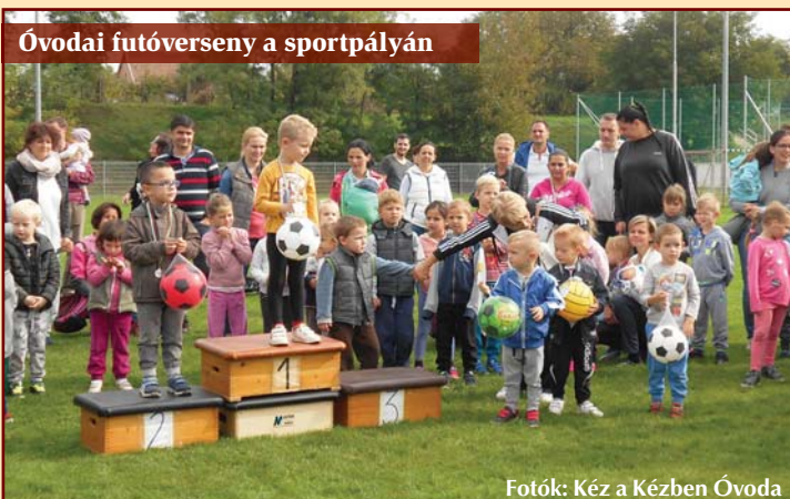
Óvodai futóverseny a sportpályán