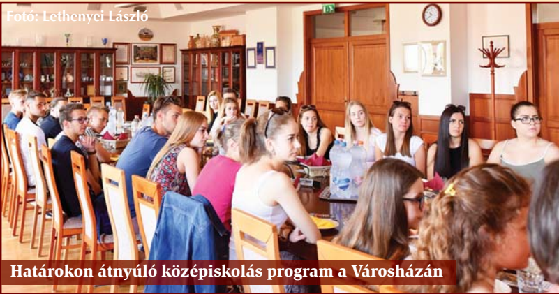
Határokon átnyúló középiskolás program a Városházán