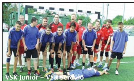
VSK Junior - VSK Serdülő