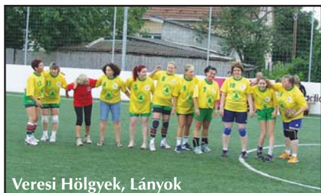
Veresi Hölgyek, Lányok