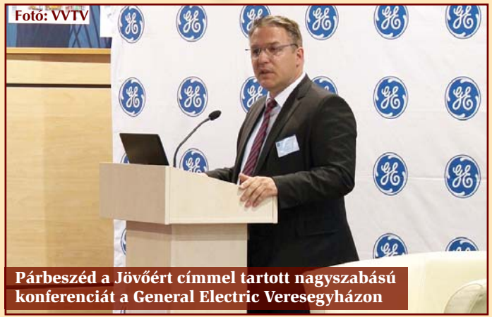
Párbeszéd a Jövőért címmel tartott nagyszabású konferenciát a General Electric Veresegyházon