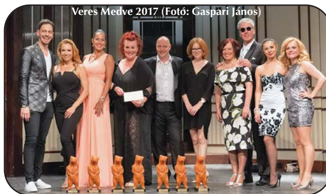
Veres Medve 2017