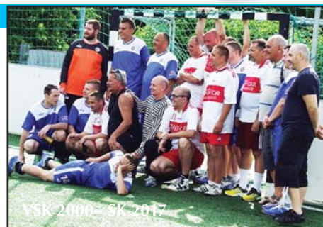
VSK 2000 - SK 2017