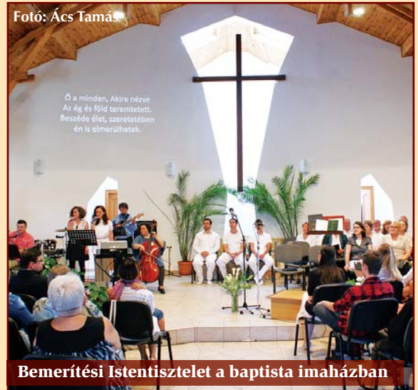
Bemertési Istentisztelet a baptista imaházban