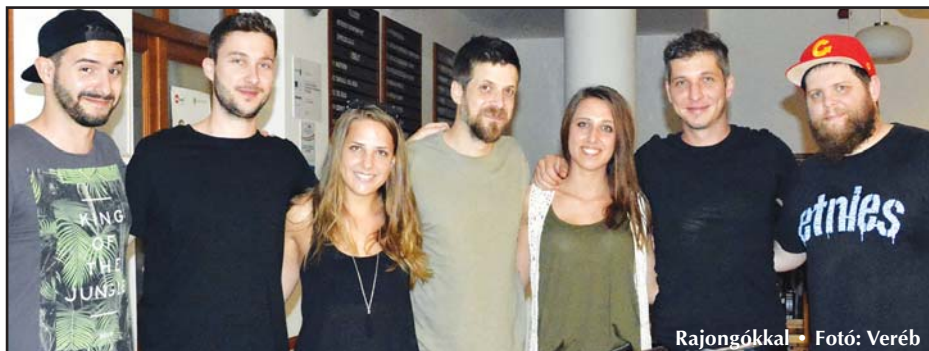
Rajongókkal