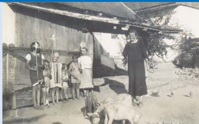
Nyár az 1920-as évek elején