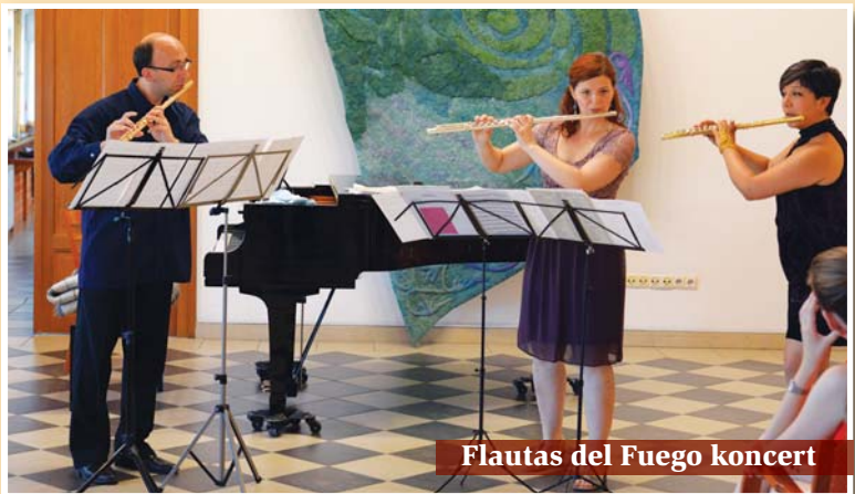
Flautas del Fuego koncert