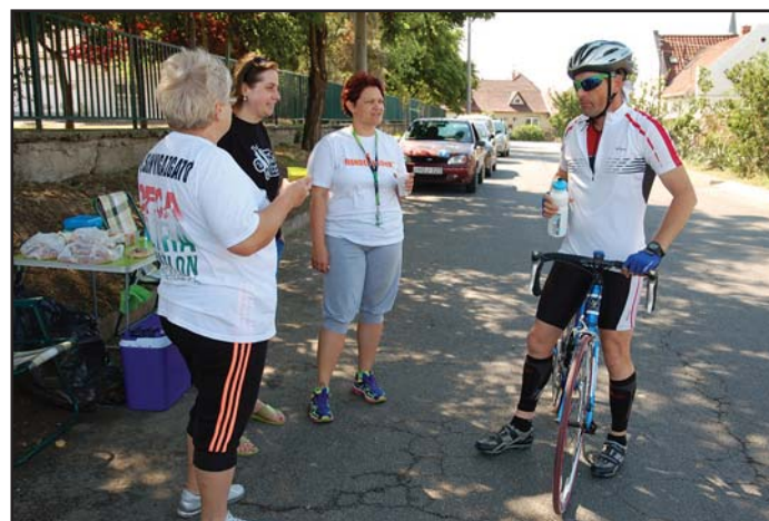
A lelkes segítők

ironman távját Nagyatádon. Innentől nem volt megállás, már verseny után megfogadtuk, hogy megcsináljuk újra. A következő évben én 1,5 órát, Tomi pedig 2,5 órát javított a szintidőn. Azt követően már a dupla ironman-en gondolkodtunk. Nekem sikerült körbefutni a Balatont (négy nap alatt), aztán tripla ironman. És ez a deca volt a csúcs!