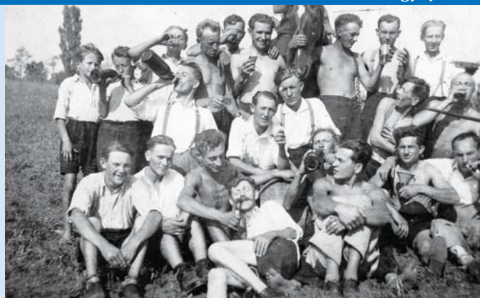
„Kanmuri” az 1940-es években