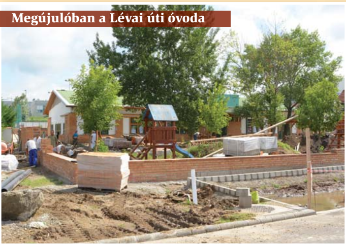
Megújulóban a Lévai úti óvoda