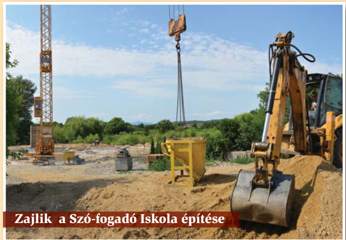
Zajlik a Szó-fogadó Iskola építése