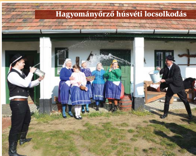
Hagyományőrző húsvéti locsolkodás