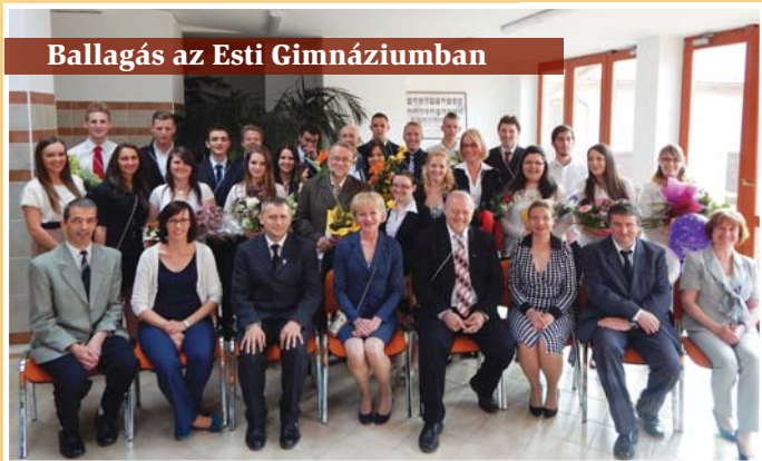
Ballagás az Esti Gimnáziumban