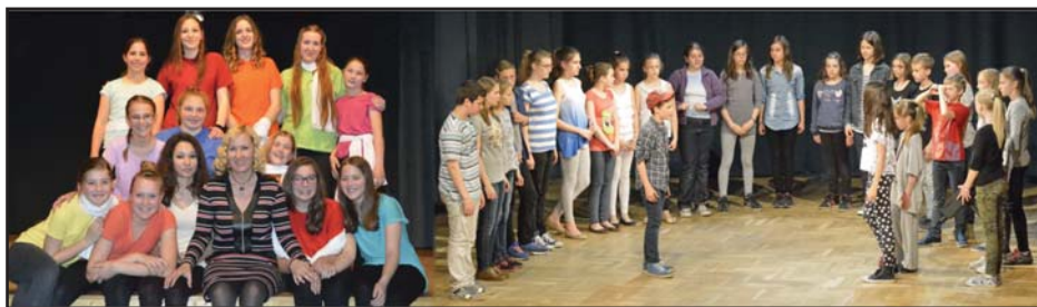
A Tűztestvérek és Tűzmadarak színház csoportok

E sikertől megerősödve folytatták – immár