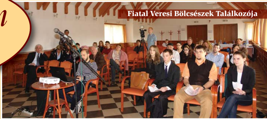
Fiatal Veresi Bölcsészek Találkozója