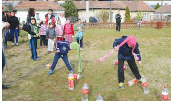
Föld Napja – szemétszedés városszerte