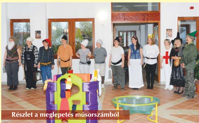
Részlet a meglepetés műsorszámból