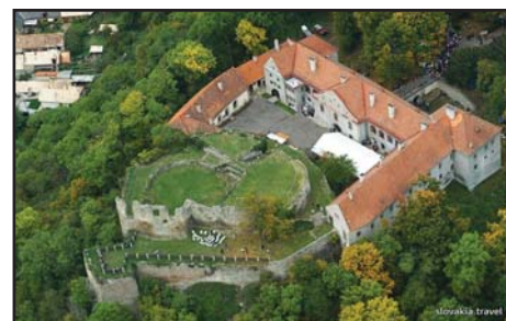
Kékkő (Modrý Kameň)