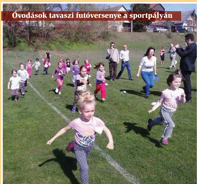
Óvodások tavaszi futóversenye a sportpályán