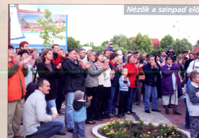
Nézők a színpad előtt