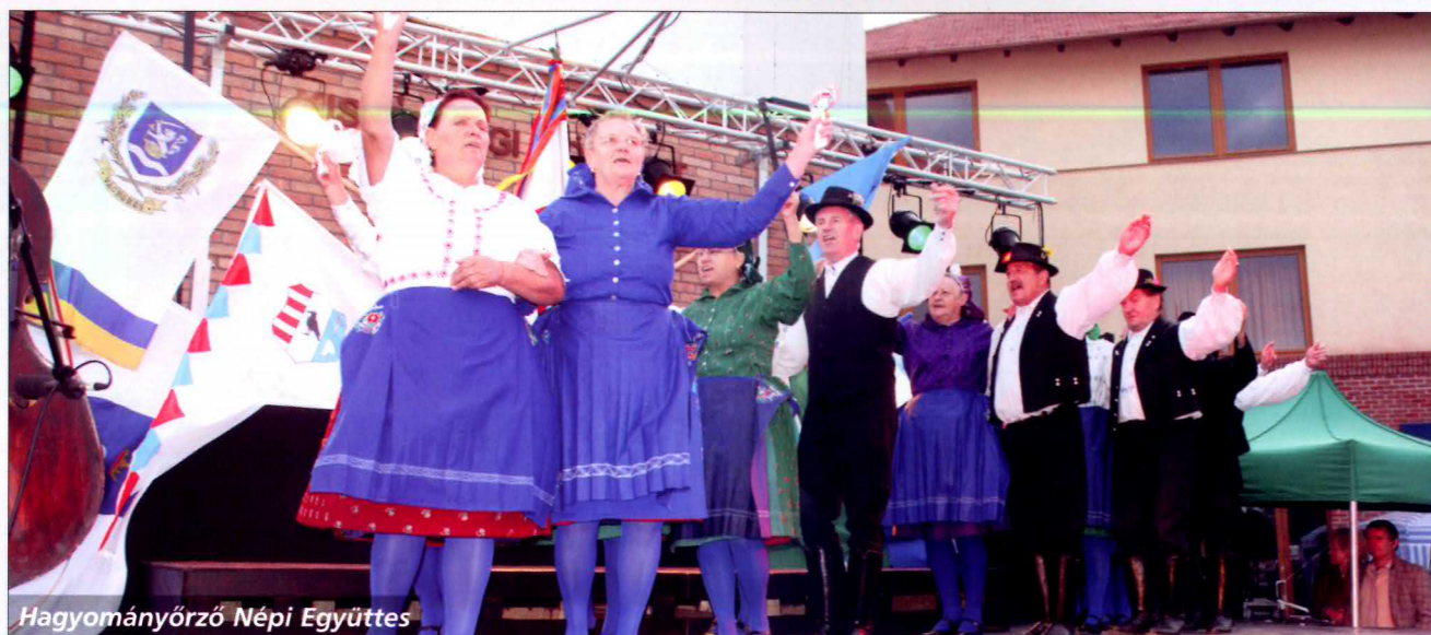
Hagyományörző Népi Együttes