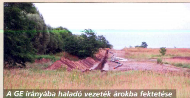
A GE irányába haladó vezeték árokba fektetése