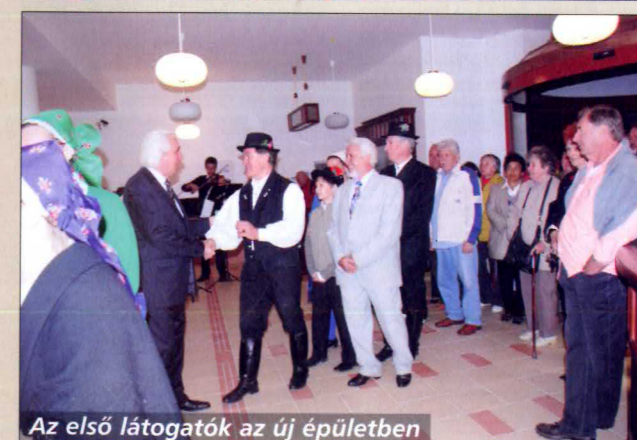
Az első látogatók az új épületben