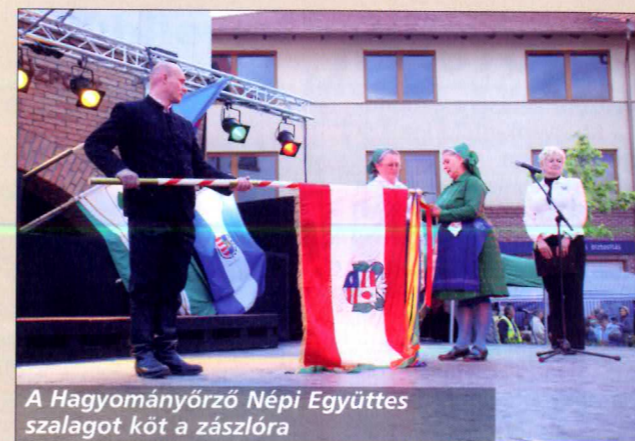
A Hagyományőrző Népi Együttes szalagot köt a zászlóra