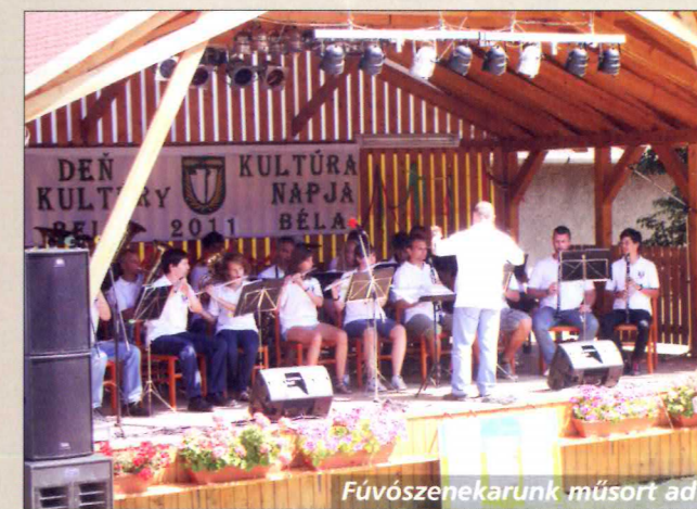
Fúvószenekarunk műsort ad