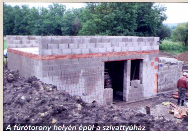
A fúrótorony helyén épül a szivattyúház

A Misszió alatti területen folytak a kútúrás munkálatok, amelyek sikeresek lettek. A fúrófej különösebb gond nélkül süllyedt egyre mélyebbre az agyagos földben, s 1200 méter után elérte a keresett vízadó réteget. Jelenleg már a szivattyúház építése folyik. A látványos rész befejeződött, a továbbiakban már jórészt láthatatlanul, föld alatti útján jut el a hévíz a fogyasztókhoz az előre kiépített csővezetéken. (A fúrás azért is izgalmas volt, mert Gödöllőn és Szadán is eredménytelenül folyt hasonló munka, Gödöllőn szinte ugyan abban az időszakban, s egyedül nálunk fejeződött be sikeresen).