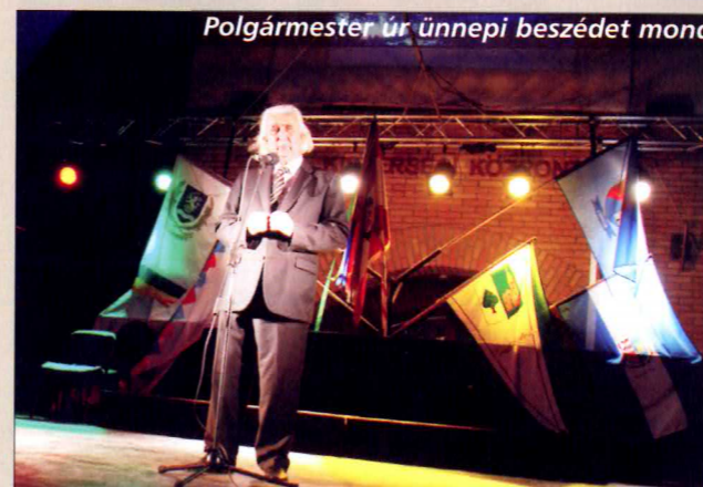
Polgármester úr ünnepi beszédet mond