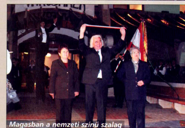
Magasban a nemzeti színű szalag