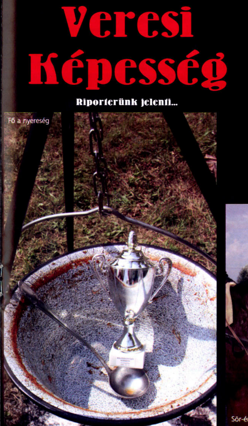
Fő a nyereség