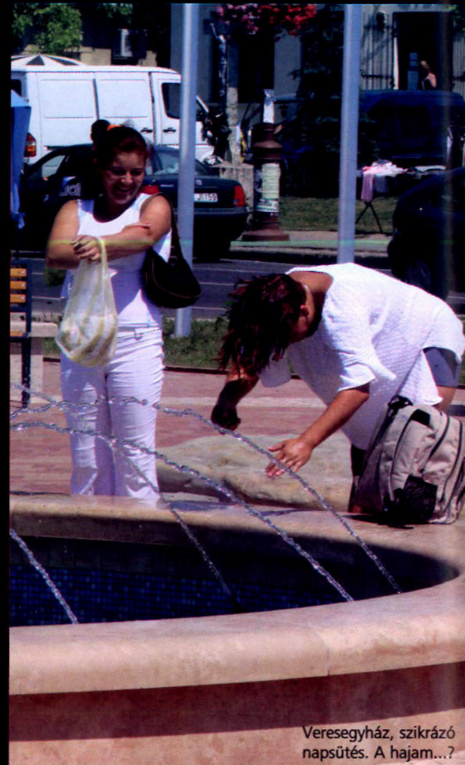
Veresegyház, szikrázó napsütés. A hajam...?