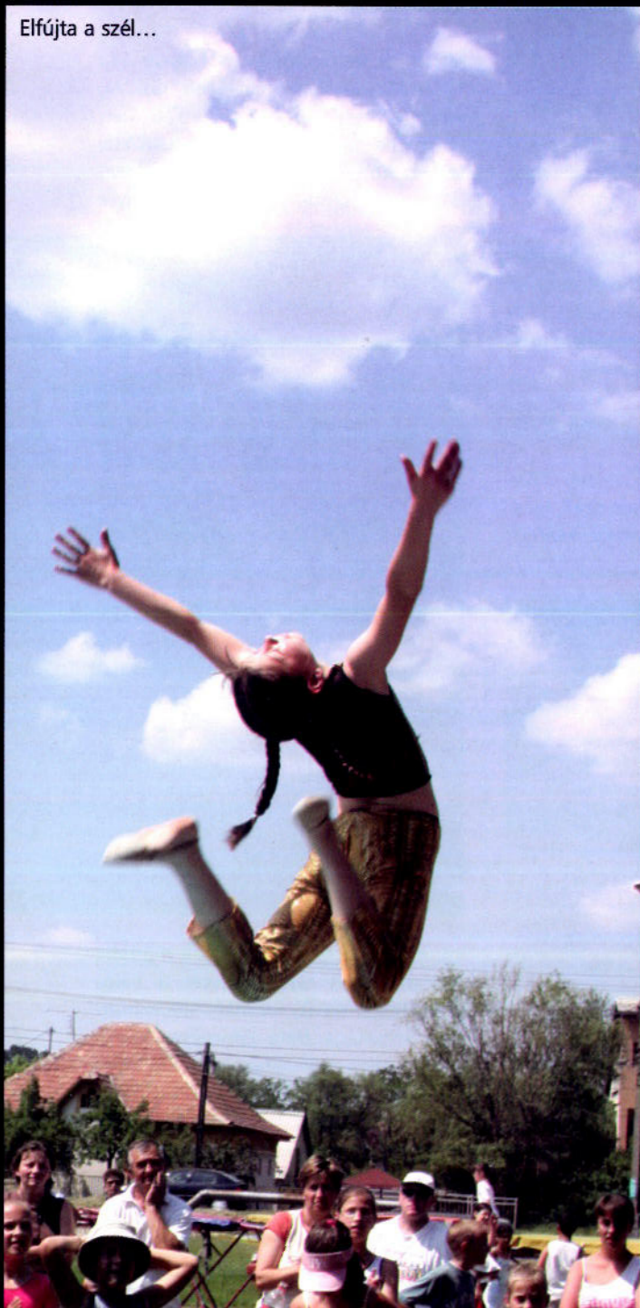
Elfújta a szél...