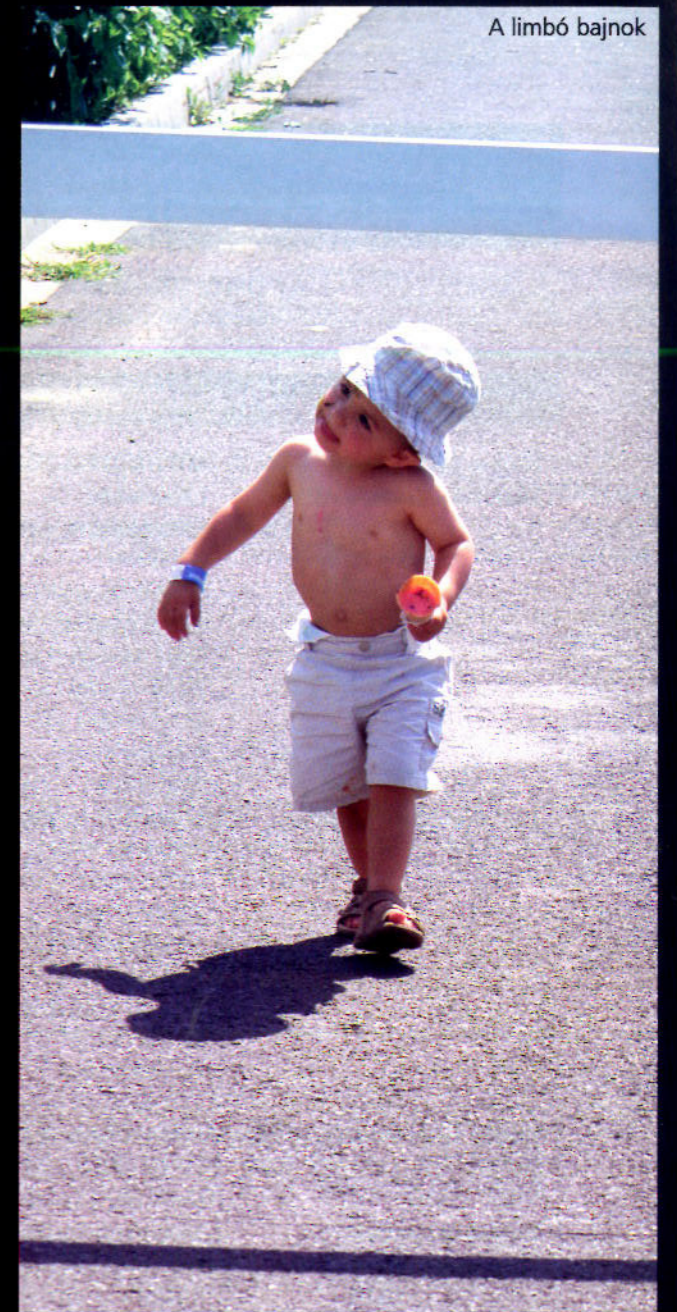
A limbó bajnok