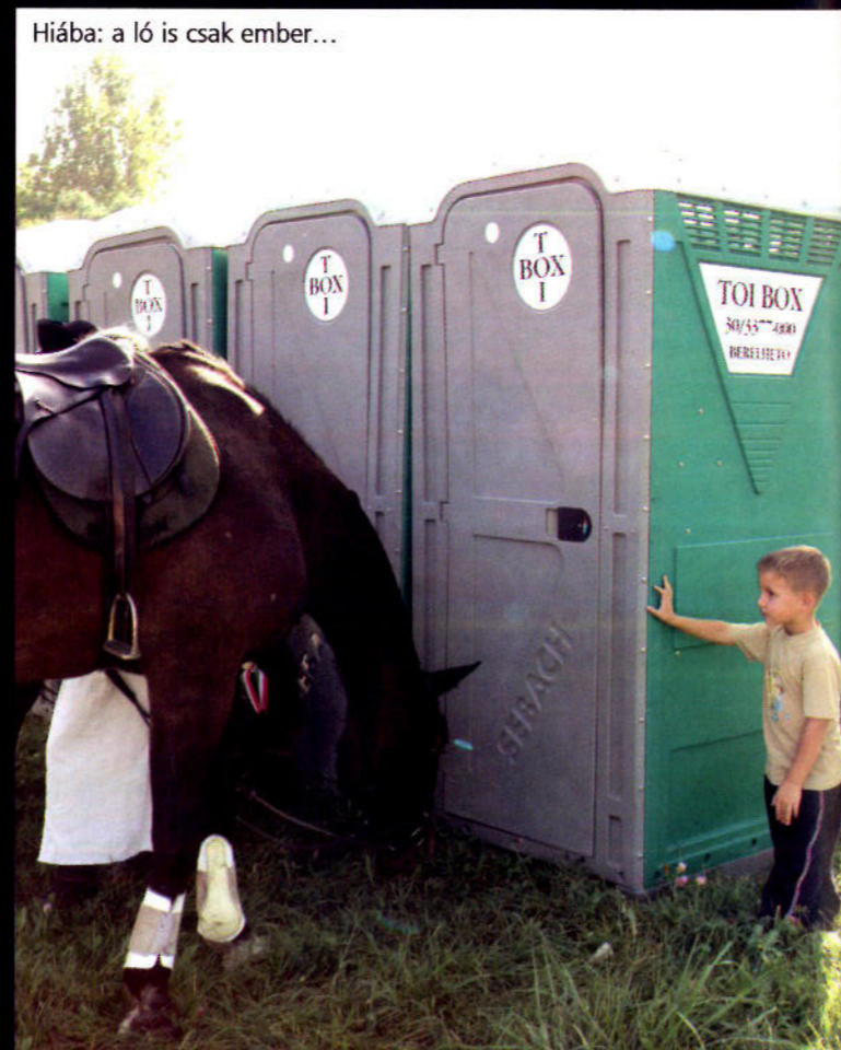
Hiába: a ló is csak ember...