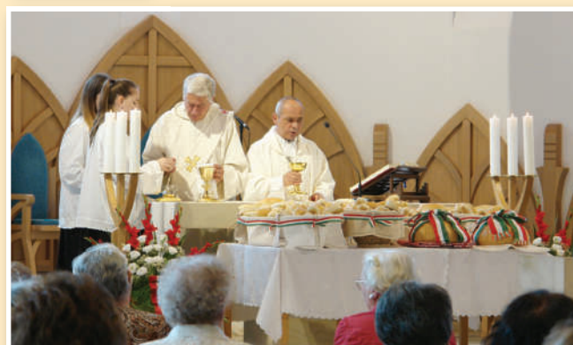
2020. AUGUSZTUS 20-ÁN 9.30 ÓRAKOR KENYÉRSZENTELŐ ÜNNEPI SZENTMISE A SZENTLÉLEK-TEPLOMBAN