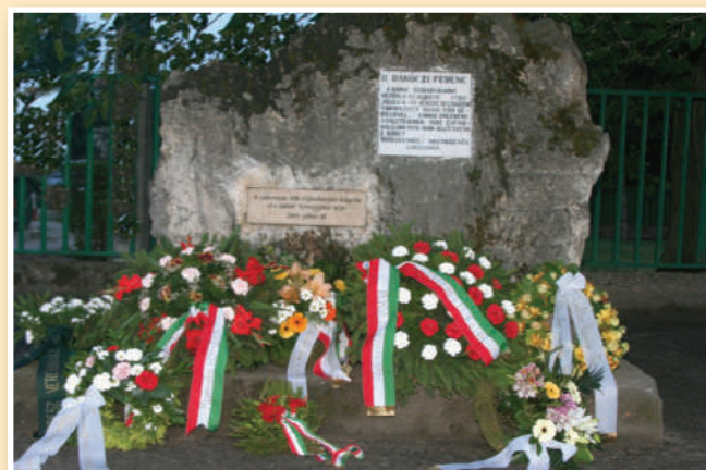
2020. AUGUSZTUS 20-ÁN 11 ÓRAKOR A II. RÁKÓCZI FERENC EMLÉKKŐ KOSZORÚZÁSA A KATONAI HAGYOMÁNYŐRZŐ EGYESÜLETTEL A TALÁLKOZÓK ÚTJÁN, A TERMÁLFÜRDŐ BEJÁRATÁNÁL