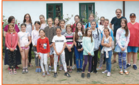
Felső Művészeti Tábor