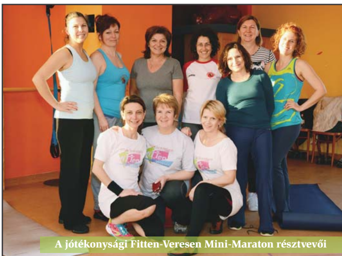
A jótékonyági Fitten-Veresen Mini-Maraton résztvevői

fittenveresen.hu • 70 311 0955 info@fittenveresen.hu