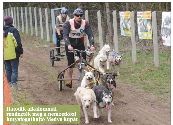
Hatodik alkalommal rendezték meg a nemzetközi kutya-fogathajtó Medve kupát