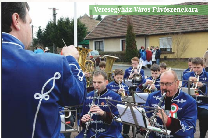
Veresgyház Város Fúvószenekeara