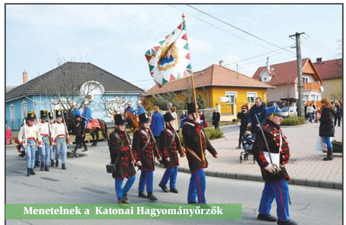
Menetelnek a Katonai Hagyományőrök