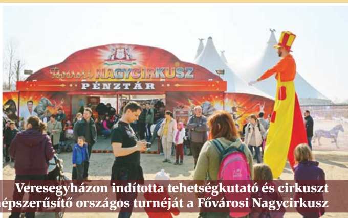
Veregyházaon indította tehetségkutató és cirkuszt népszerűsítő országos turnéját a Fővárosi Nagycirkusz