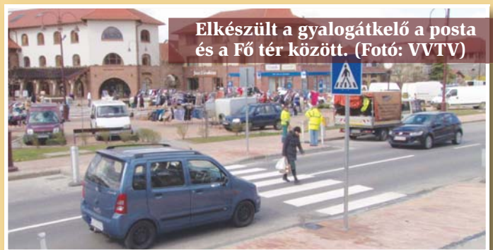
Elkészült a gyalogátkelő a posta és a Fő tér között.