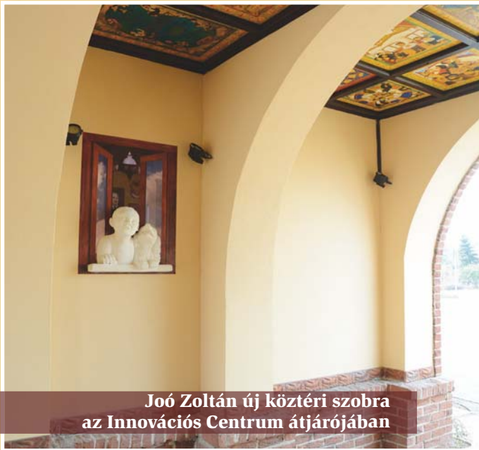
Joó Zoltán új köztéri szobra az Innovációs Centrum átjárójában