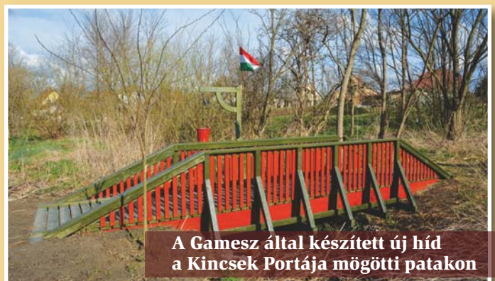
A Gamesz által készített új híd a Kincsek Portája mögötti patakon