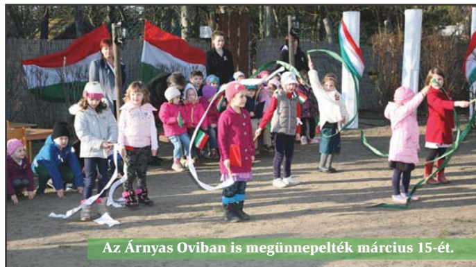
Az Árnyas Oviban is megünnepelték március 15-ét.