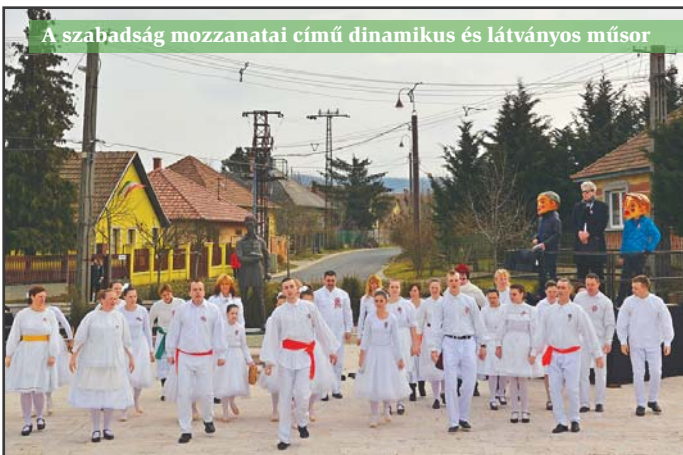
A szabadság mozzanatai című dinamikus és látványos műsor