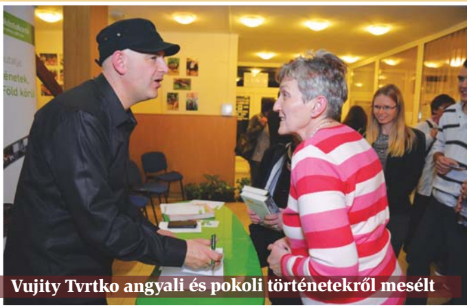
Vujity Tvrtko anyagi és pokoli történetekről mesélt