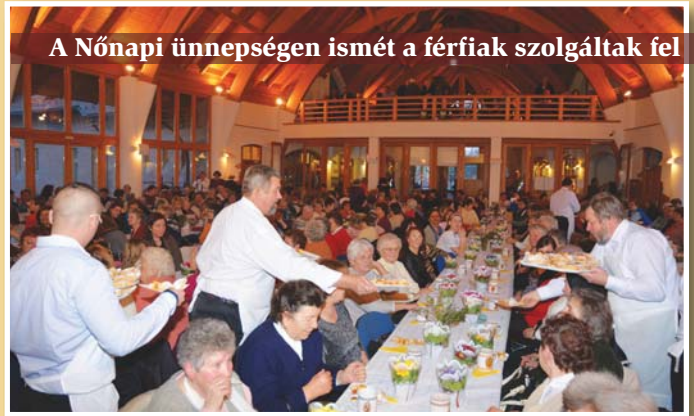
A Nőnapra ünnepség ismét a férfiak szolgáltak fel