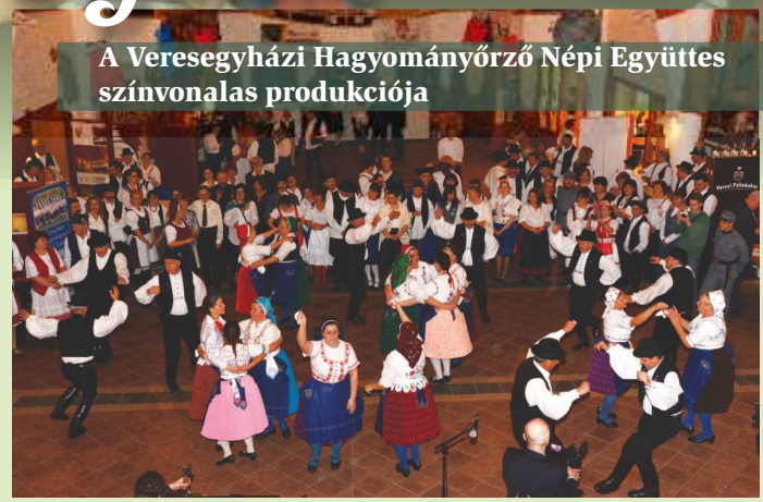
A Veresegyházi Hagyományörző Népi Együttes színvonalas produkciója