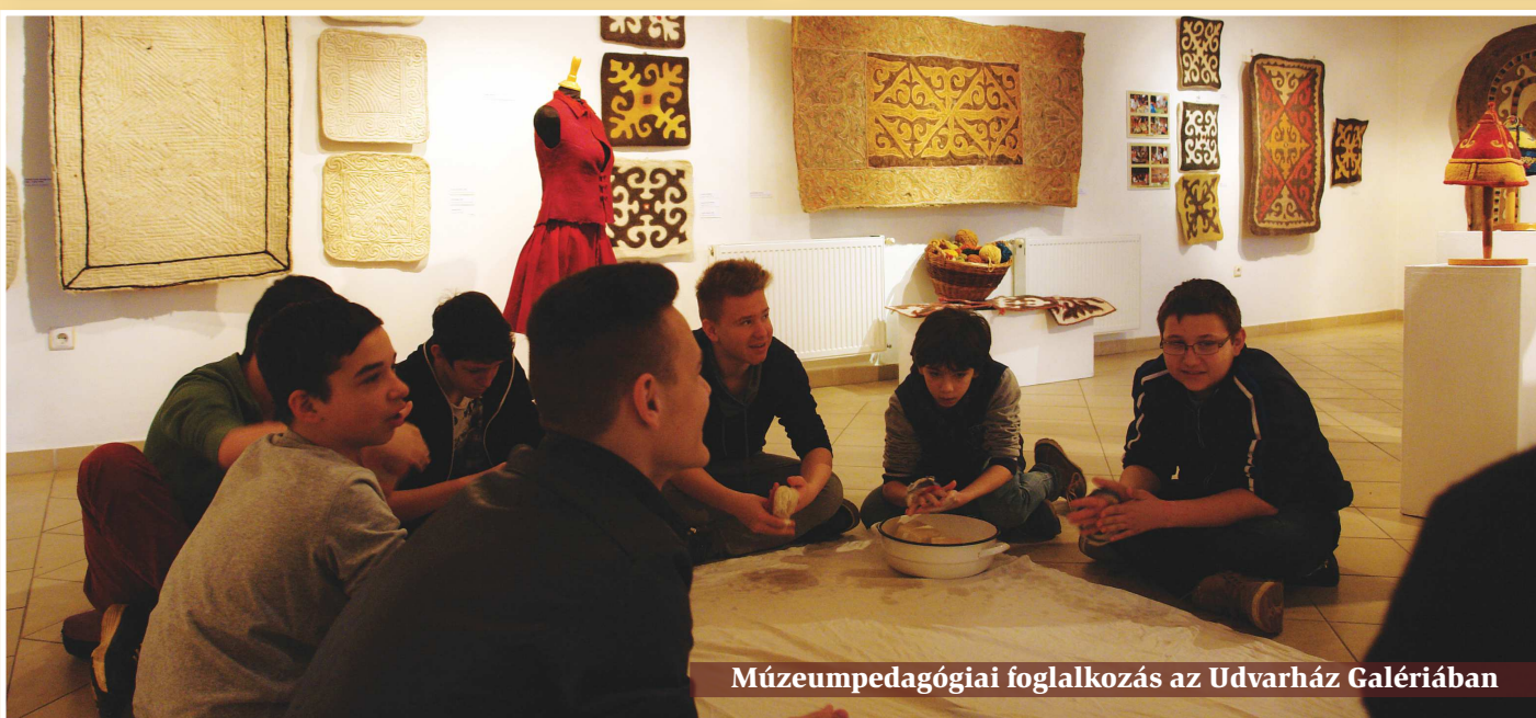
Múzeumpedagógiai foglalkozás az Udvarház Galériában