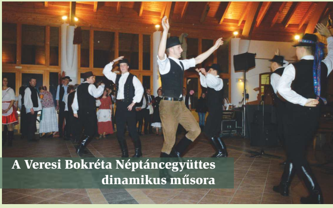
A Veresi Bokréta Néptáncegyüttes dinamikus műsora