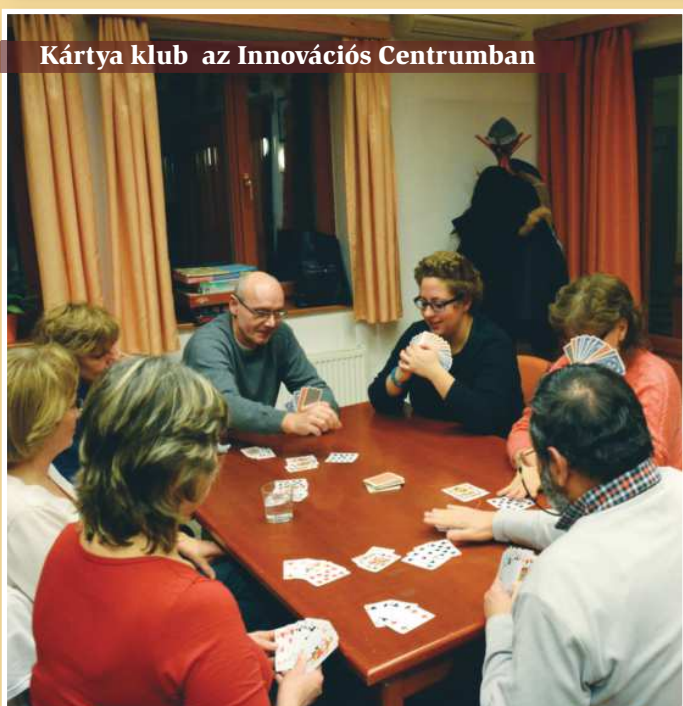
Kártya klub az Innovációs Centrumban