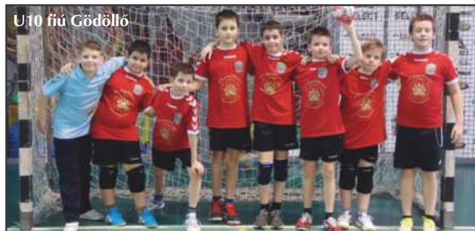
U10 fiú Gödöllő