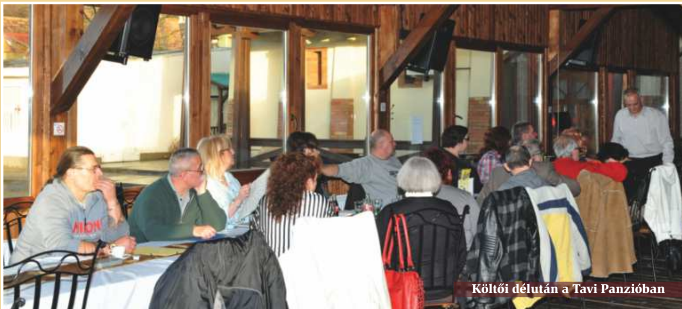
Költői délután a Tavi Panzióban