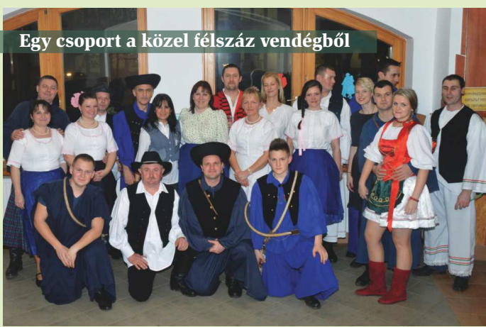
Egy csoport a közel félszáz vendégből