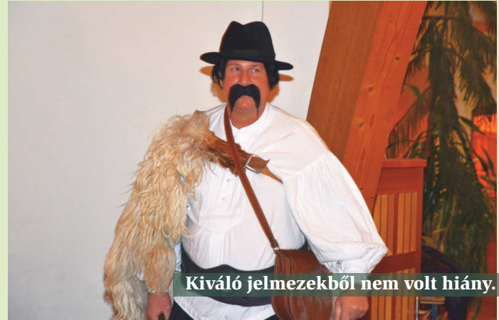
Kiváló jelmezekből nem volt hiány.