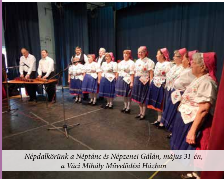
Népdalkörünk a Néptánc és Népzenei Gálán, május 31-én, a Váci Mihály Művelődési Házban