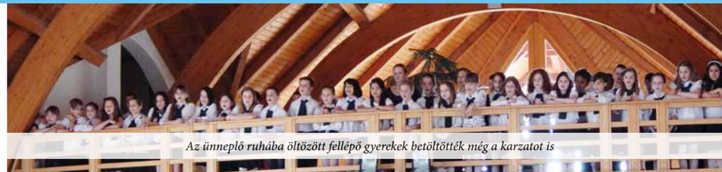
Az ünneplő ruhába öltözött fellépő gyerekek betöltötték még a karzatot is

Július 28- augusztus 1. Kézműves tábor Szabadidős Központ