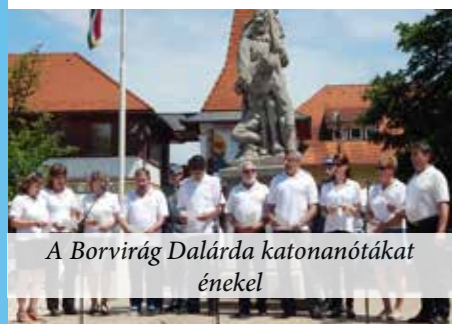
A Borvirág Dalárda katonanótákat énekel