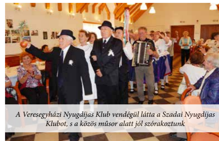
A Veresegyházi Nyugdíjas Klub vendégül látta a Szadai Nyugdíjas Klubot, s a közös műsor alatt jól szórakoztunk