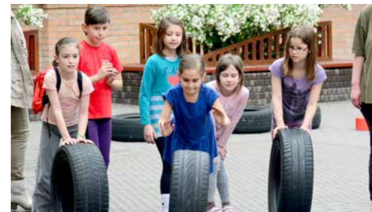
Nem maradt el az idén sem a Rinya Túra