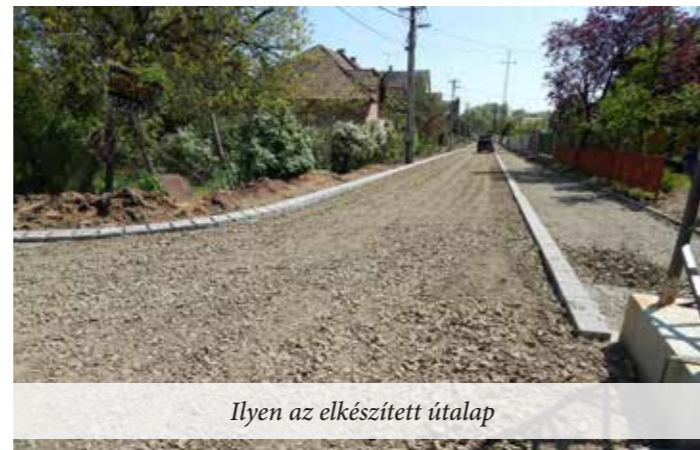
Ilyen az elkészített útalap