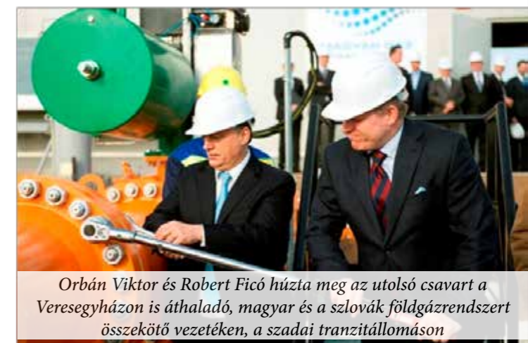
Orbán Viktor és Robert Ficó húzta meg az utolsó csavart a Veresegyházon is áthaladó, magyar és a szlovák földgázrendszer összekötő vezetéken, a szadai tranzitállomáson