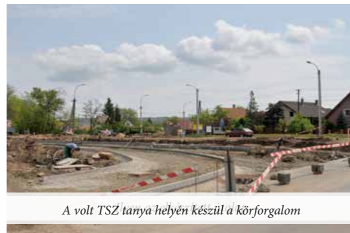
A volt TSZ tanya helyén készül a körforgalom

Veresegyház Város Polgármestere 2112 Veresegyház, Fő út 35. Tel: 28-588-600 Fax: 28-588-646