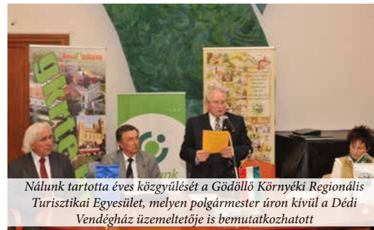
Nálunk tartotta éves közgyűlést a Gödöllő Környéki Regionális Turisztikai Egyesület, melyen polgármester úron kívül a Dédi Vendégház üzemeltetője is bemutatkozhatott