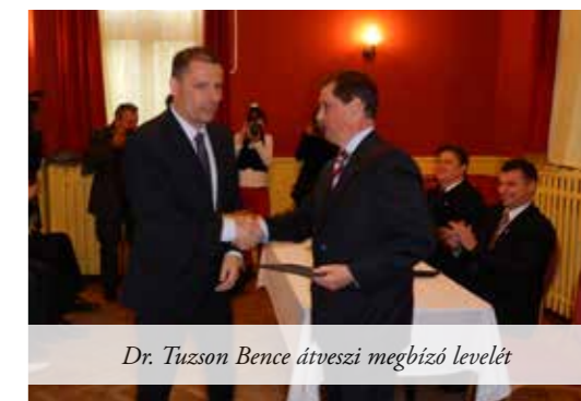
Dr. Tuzson Bence átveszi megbízó levelét