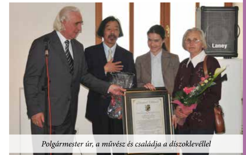
Polgármester úr, a művész és családja a díszoklevéllel