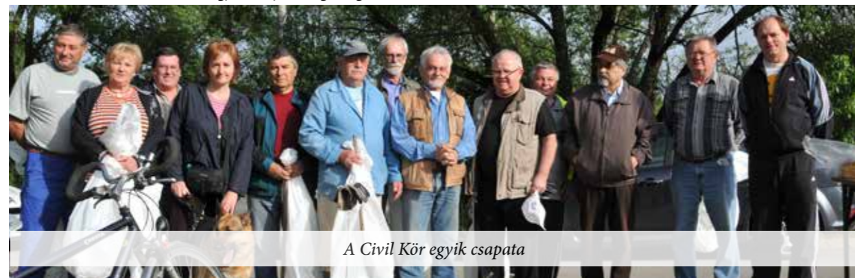
A Civil Kör egyik csapata

A kullancs, ha az embert megcsípi, azt észre sem vesszük, mert mielőtt vért szívna, előbb fájdalomcsillapítót juttat a sebbe. Így nem érzünk fájdalmat. Célszerű azonban a kullancsot minél előbb eltávolítani. Nem kell szesszel vagy kenőccsel kengetni, egy kisebb csipesszel néhány félfordulatos mozdulattal kiszedhetjük. Ha azonban a kullancs feje véletlenül beleszakad, akkor forduljunk orvoshoz, mert az már magától nem jön ki. A kullancs mielőbbi eltávolítása rendkívül fontos, mert sajnos az emberre veszélyes betegségeknek is a vektora, amitől szerencsétlen esetben nagyon súlyos megbetegedés is kialakulhat.