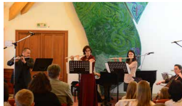
Nagy érdeklődés övezte a Zeneiskola Tanári hangversenyét