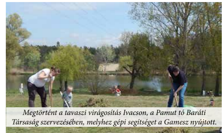
Megtörtént a tavaszi virágosítás Ivacson, a Pamut tó Baráti Társaság szervezésében, melyhez gépi segítséget a Gamesz nyújtott.