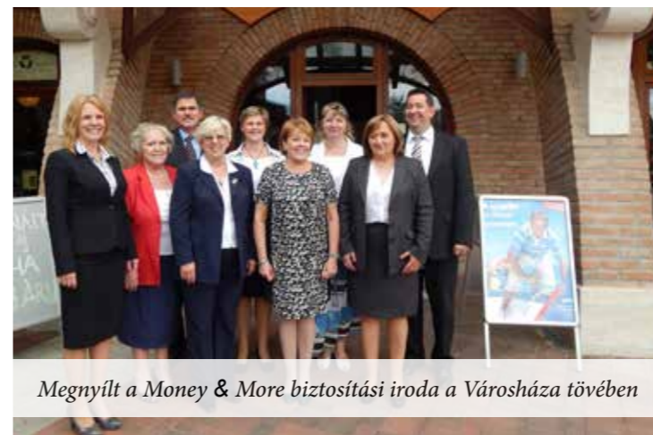
Megnyílt a Money & More biztosítási iroda a Városháza tövében