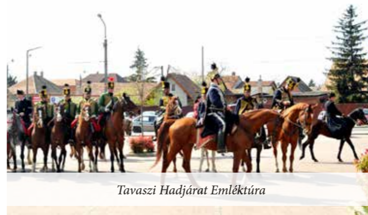
Tavaszi Hadjárat Emléktúra