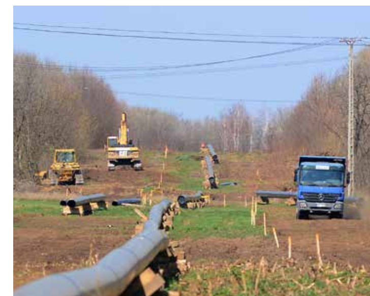
Átépítik a határban a Barátság Kőolajvezeték csőrendszerét

Tájékoztatás ingyenes jogsegély szolgáltatásról