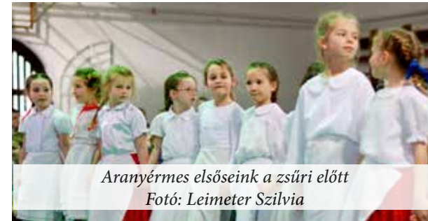
Aranyérmes elsőseink a zsűri előtt