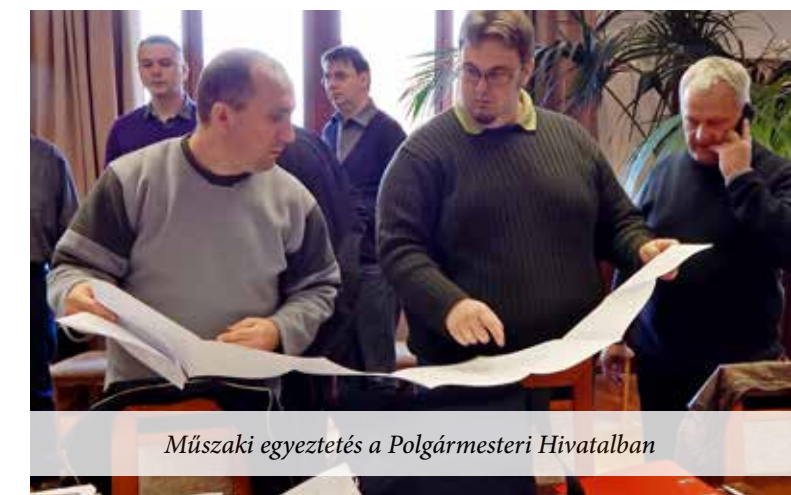
Műszaki egyeztetés a Polgármesteri Hivatalban

Veresegyház Város Önkormányzata megbízásából kiadja a Windhager Kft. Decens Kiadója. • Kiadó: 2120 Dunakeszi, Vörösmarty u. 2. • Szerkesztőség: 2111 Szada, Dózsa György út 166. I. em 6. iroda (VIDAutó autószerelő emeletén) • Telefon: 06-30-335-9050 • Fax: 06-27-342-108 • windhager@decens.eu • www.decens.eu • Főszerkesztő: Windhager Károly • Fotó: Lethenyi László • Nyomdai előkészítés: Kontreczki-Catalan Júlia • Nyomda: Berei és Tsa. Kft.