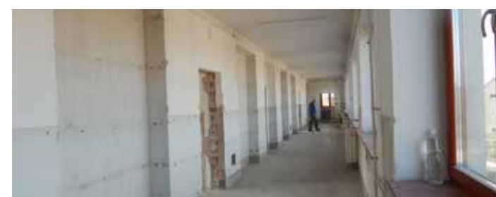
Lecsupasztított folyosó az 1. emeleten