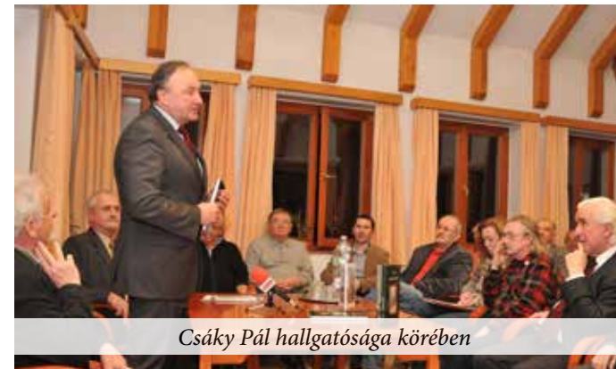
Csáky Pál hallgatósága körében

A Civil Kör meghívására március elején városunkba érkezett egy esti foglalkozás erejéig Csáky Pál szlovákiai író, politikus. A kör tagjai mellett népes hallgatóság fogadta, akik közül többen meleg szeretettel köszöntötték őt, mint régi ismerőst. Az előadását a nemrég megjelent új könyve ismertetésével kezdte. A Csend és lélek című gyűjtemény emberi sorsokon keresztül mutatja be a szlovákiai magyarság életét. Előadásában fontos megállapításokat hallhattunk tőle. A legfontosabb megjegyzése a hármas identitása volt. Mindenek előtt magyarnak tartja magát, aki kényesen ügyel arra, hogy a beszédében és az írásaiban hibátlan magyarsággal jelenjen meg. Másodszorban szlovák állampolgár, aki magára nézve kötelezően elfogadja az országa törvényeit. Két ciklusban volt miniszterelnök-helyettes, több kormányulást vezetett és sok törvény még mindig az ő aláírásával van érvényben. Társai harcos magyar politikusnak tartották és tartják ma is. Harmadszorban európai uniós állampolgárnak tartja magát, aki sokat tett azért, hogy országa az unióhoz csatlakozzon. A közelgő választásokon pártja euro-parlamenti listáját vezeti. Beszélte a magyarság ottani megosztottságáról és arról az igen kedvezőtlennek tartott tendenciáról, hogy jelentősen csökken a szlovákiai magyarság lélekszáma. Ennek oka egyrészt demográfiai, vagyis alacsonyabb a születések száma, oka az elvándorlás, mert sokan keresnek boldogulást külföldön, és igen jelentős az asszimiláció.