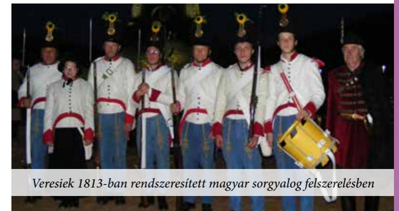
Veresiek 1813-ban rendszeresített magyar sorgyalog felszerelésben