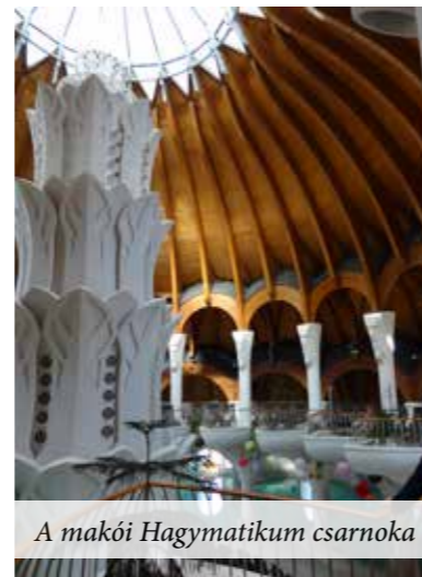
A makói Hagymatikum csarnoka

A kirándulás igen hasznos tapasztalatokkal zárult. Mindkét fürdő vezetése átfogó és részletes tájékoztatást nyújtott a küldöttség számára. Betekintést engedtek az üzemeltetés költségeibe, a gazdaságos működtetés hatékony módszereibe. Természetesen Veresegyház nem lehet versenytárs számukra - már csak a városaink egymástól való távolságát tekintve sem – így beruházásunkkal és a tőlük kapott tapasztalatokkal nem sértjük üzleti érdekeiket. A számtalan hasznos és nélkülözhetetlen ismeretanyagért köszönettel tartozunk. Az általuk megélt tapasztalatokból, pozitív és negatív élethelyzetekből nekünk már csak okulnunk kell.