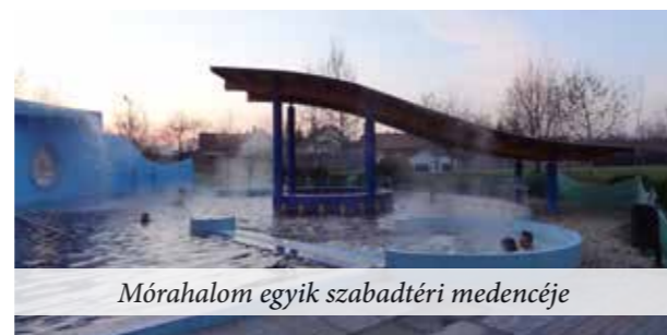
Mórahalom egyik szabadtéri medencéje