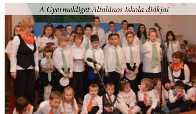
A Gyermekliget Általános Iskola diákjai