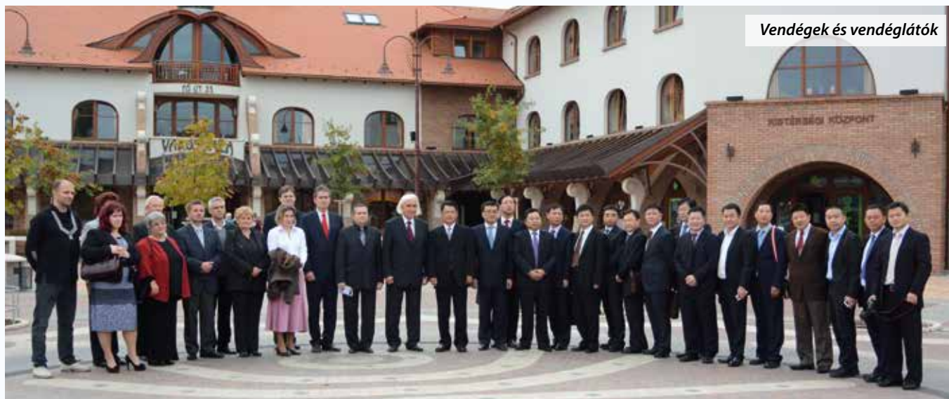
Vendégek és vendéglátók

Többszöri veresegyházi látogatást követően október 28-án ismét vendégek érkeztek Kínából. Xianning város vezetői tették tiszteletüket abból a célból, hogy kinyilvánítsák szándékukat Veresegyház és Xianning testvérvárosi programjáról, valamint megállapodást kössenek a kínai-magyar oktatási és kulturális együttműködés előmozdítása érdekében.