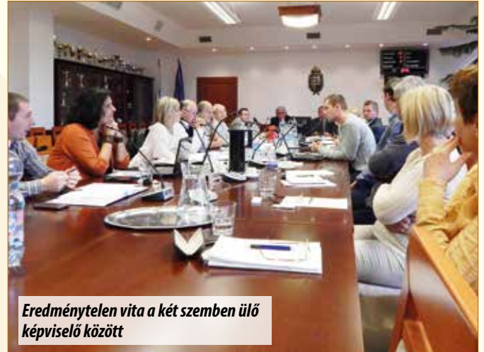
Eredménytelen vita a két szemben ülő képviselő között