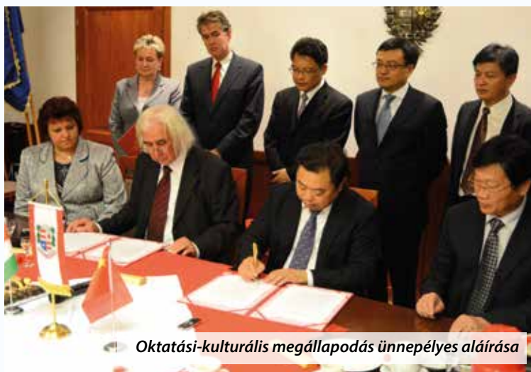
Oktatási-kulturális megállapodás ünnepélyes aláírása

Reményt keltő ez a testvérvárosi kapcsolat, sokat tanulhatunk keleti barátainktól több tekintetben is, s egy esetleges kínai beruházás Veresegyházon szintén hozzájárulhat városunk további fejlődéséhez, gyarapodásához.