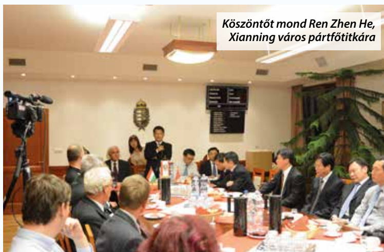
Köszöntőt mond Ren Zhen He, Xianning város pártfőtitkára