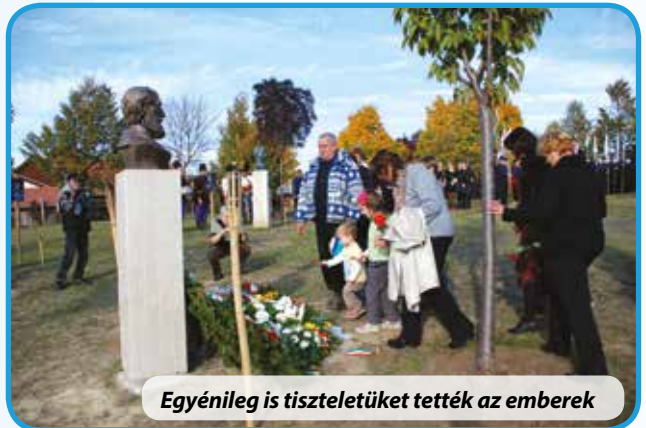
Egyénileg is tiszteletüket tették az emberek