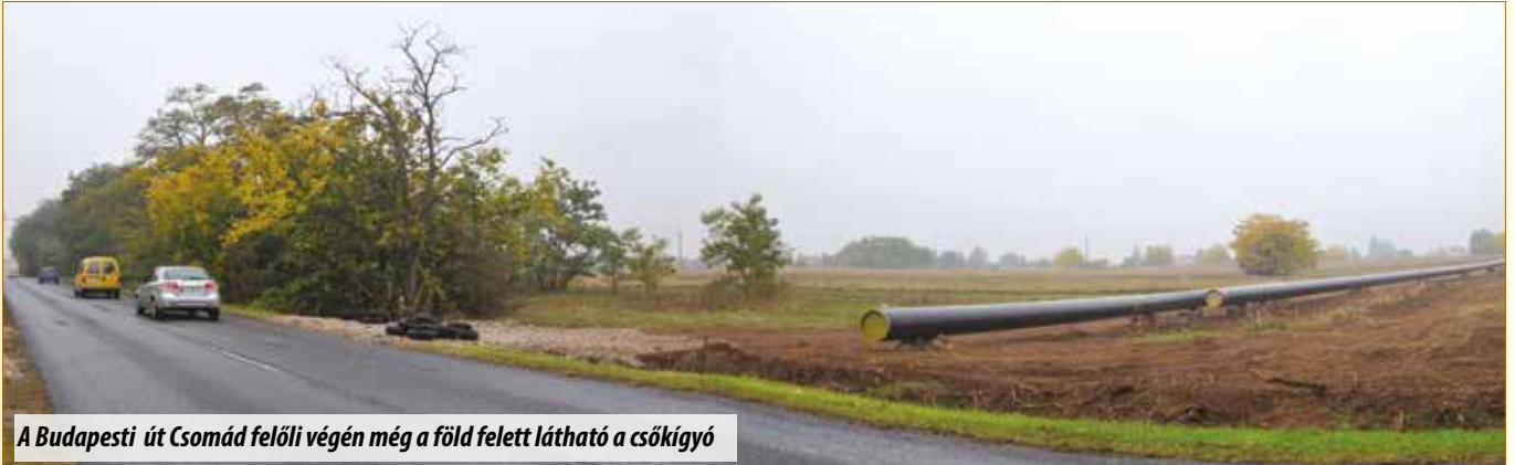
A Budapesti út Csomád felőli végén még a föld felett látható a csőkígyó

Mint ismert, az összesen 111 kilométer hosszú, kétirányú, 75 bar nyomású csővezeték magyarországi szakasza 92 kilométer hosszú lesz, két végpontja Vecsés és Balassagyarmat. A kivitelezés során az átlagosan 18 méter hosszú, 800 milliméter átmérőjű csőszálakat a nyomvonal mentén, a terepi viszonyoknak megfelelően hajlítják, összehegesztik és árokba fektetik, majd a nyomáspróba után betakarják.