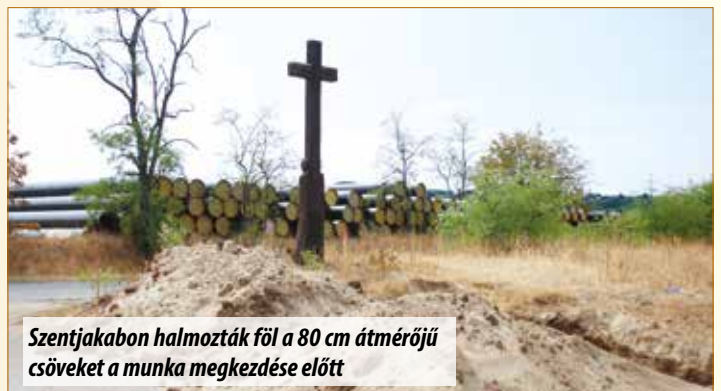
Szentjakabon halmozták föl a 80 cm átmérőjű csöveket a munka megkezdése előtt

A csöveket 200 cm mély árokban, 120 cm-es földtakarással helyezik el. A kivitelezési munkálatokat augusztus közepén kezdték meg Veresegyházon, s várhatóan a jövő évben fejeződnek be.