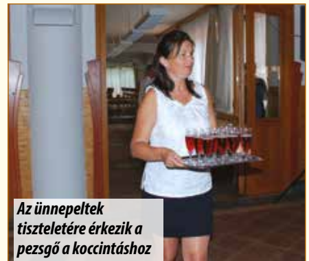
Az ünnepek tisztelőre érkezik a pezsgő a koccintáshoz