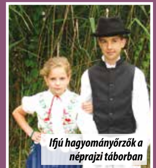
Ifjú hagyományörzők a néprajzi táborban

A Fülöp Ferenc decsi paraszti táncosról elnevezett díjat, a Muharay Elemér Népművészeti Szövetség két évente nyújtja át a versenyen kimagasló teljesítményt nyújtó szólistáknak.