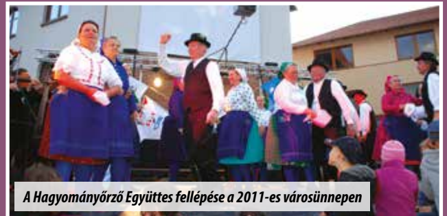
A Hagyományörző Együttes fellépése a 2011-es városünnepen

Vankóné Dudás Juliról elnevezett díj: a Galga-mente népművészetének, hagyományainak fenntartásában és megőrzésében legeredményesebben tevékenykedők elismerése.