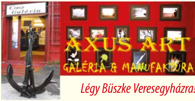
Légy Büszke Veresegyházra!