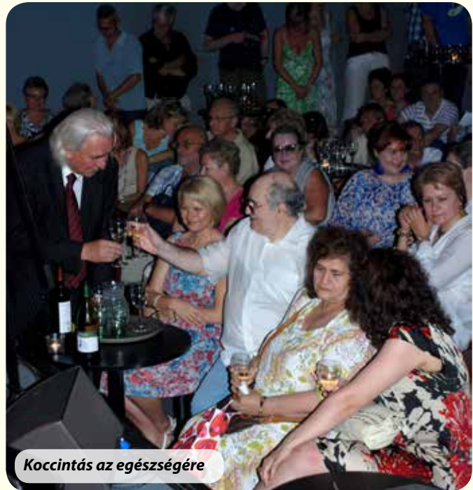
Koccintás az egészségére

„Tudom azt is, hogy Dohnányi nem vett fel a Zeneakadémia zongora szakára olyan növendéket, aki nem tudott improvizálni. A 17. és 18. században ez a tudás a zenélés természetes része volt, elég a