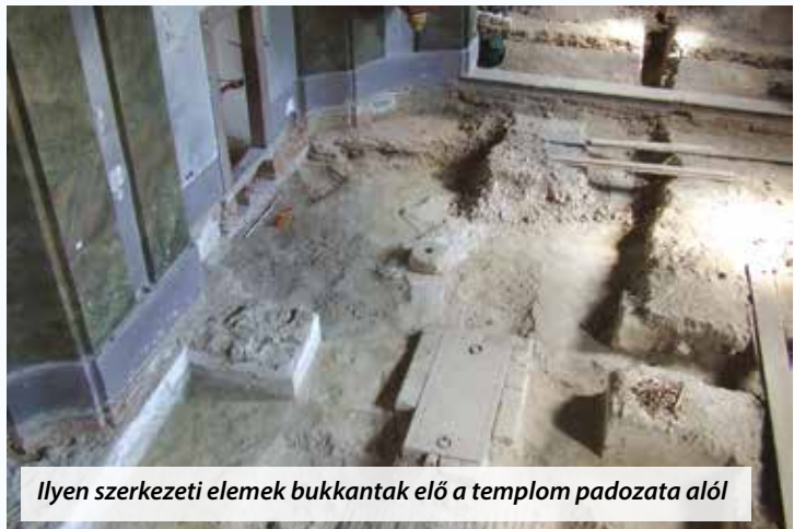
Ilyen szerkezeti elemek bukkantak elő a templom padozata alól