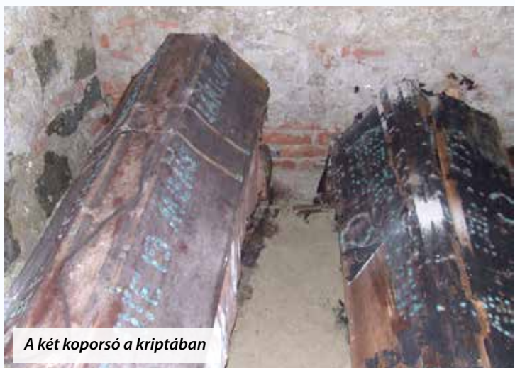
A két koporsó a kriptában