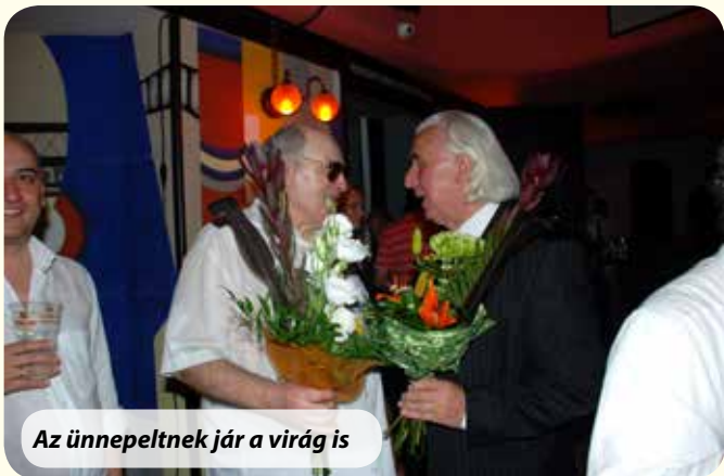
Az ünnepeltnek jár a virág is