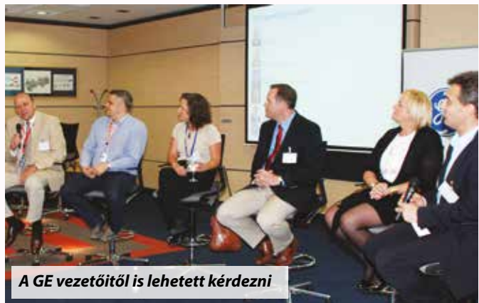
A GE vezetőitől is lehetett kérdezni

Az ösztöndíjra évente öt magyar egyetem – a Budapesti Corvinus Egyetem, a Budapesti Műszaki és Gazdaságtudományi Egyetem, a Miskolci Egyetem, a Pécsi Tudományegyetem és a Pannon Egyetem - közgazdasági, menedzsment, mérnöki vagy műszaki területen ta-