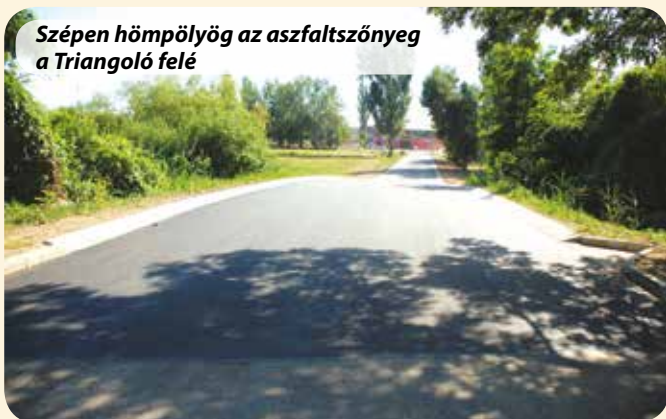
Szépen hőmpölyög az aszfaltszőnyeg a Triangoló felé