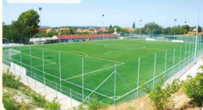
A műfüves focipálya