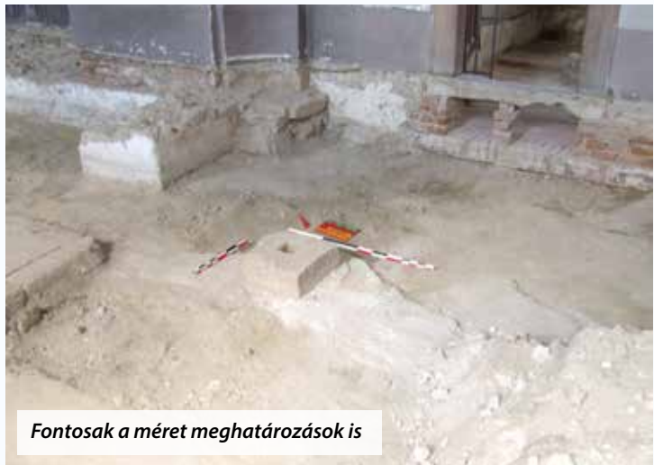
Fontosak a méret meghatározások is