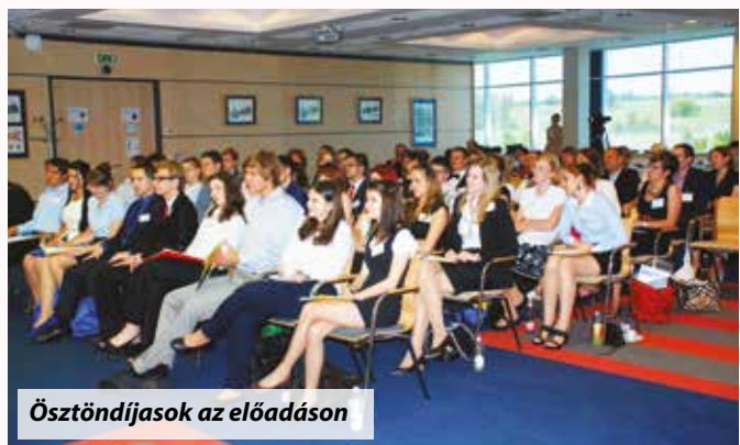
Ösztöndíjasok az előadáson

Erre a lehetőségre a Heller Farkas Szakkollégium levelezőlistáján akadtam rá. Jelentkeztem és egy kétfordulós tesztelésen kellett sikeresen megfelelni. Az első fordulóban egy ezer szavas esszét kellett írni angol