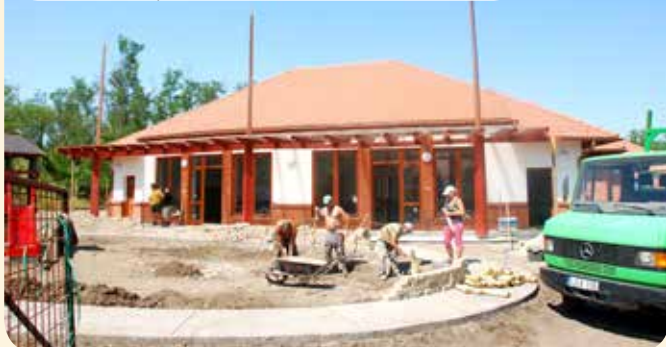
Hamarosan átadják a Meseliget Bölcsőde új épületszárnyát, már a parkosításnál tartanak