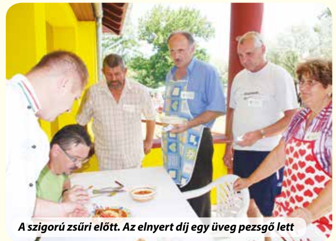
A szigorú zsűri előtt. Az elnyert díj egy üveg pezsgő lett

Egybordalösszeállítást adtunk elő, aminek az volt a különlegessége, hogy egy dalon belül két hangnemben játszottunk, kétféle hangolású, A és D citerákat használtunk, egyiket a másik után. Az első dallam nagy hangterjedelmű volt, mélyen, A-ban énekeltünk és a közjátékot játszottuk hangszeres változatban D-ben. Később ugyan ebben a D-ben kezdtük a másik dallamot, ami viszont kisebb hangterjedelmű volt, így a magasabb fekvés sem okozott nehézséget. Elénekeltek D-ben az első dalt, utána visszajött megint A-ban a közjátékként, majd visszamentünk megint D-be az ének utolsó versszakára.