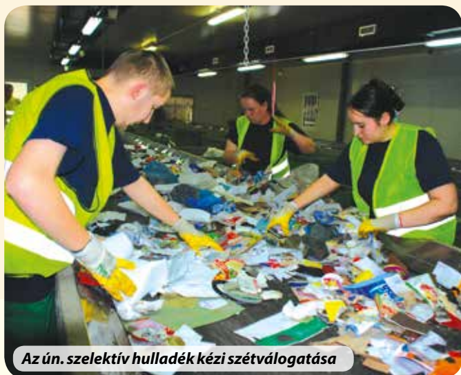
Az ún. szelektív hulladék kézi szétválogatása

(A Zöld Híd Ökörtelek-völgyi telephelye közigazgatásilag Kerepeshez tartozik, de megközelíteni Gödöllő felől a repülőtér mellett elhaladva lehet)