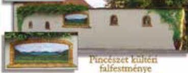
Pincészet külső falfestménye