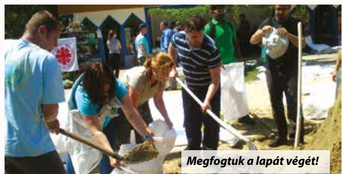
Megfogluk a lapát végét!