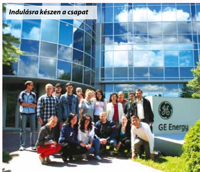
Indulásra készen a csapat

Június elején árvíz fenyegette a Duna menti településeket. A veresegyházi „nagy” GE önkéntesei, mintegy 20 fő utazott Vácra június 7-én délután, hogy kétkézi munkájukkal segítsenek a város védelmében. Erről láthatnak képes riportot az alábbiakban: