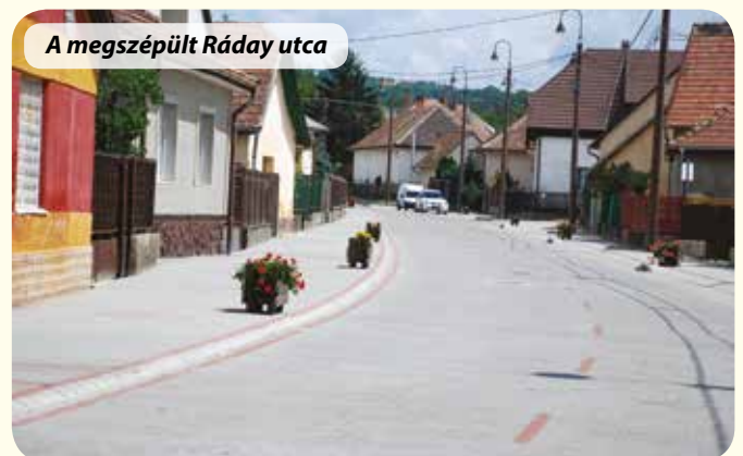
A megszépült Ráday utca