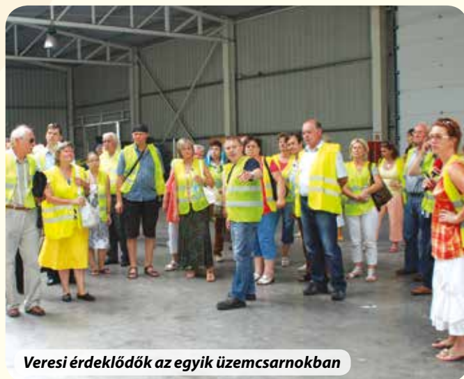
Veresi érdeklődők az egyik üzemcsarnokban