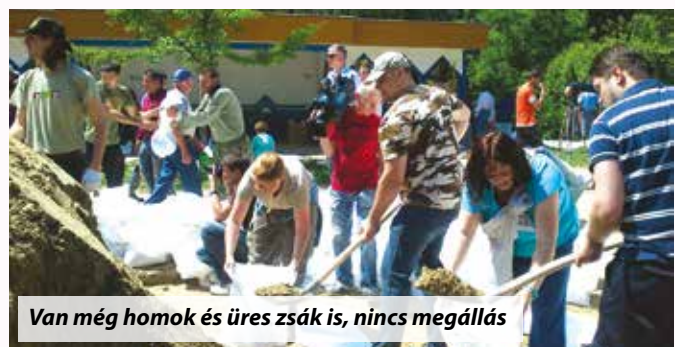
Van még homok és üres zsák is, nincs megállás