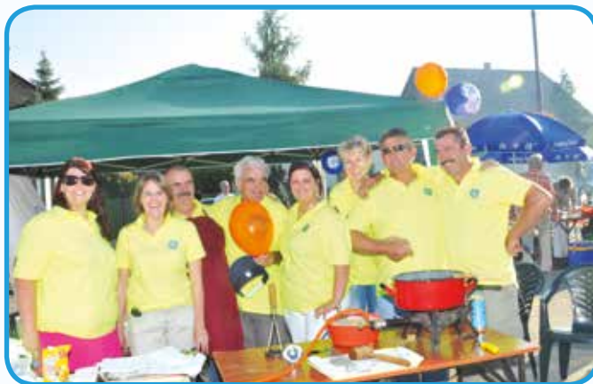
A Takarékszövetkezet csapata az előző évben nyert kupával, ekkor még nem tudhatták, hogy ez másodszor is sikerül nekik.