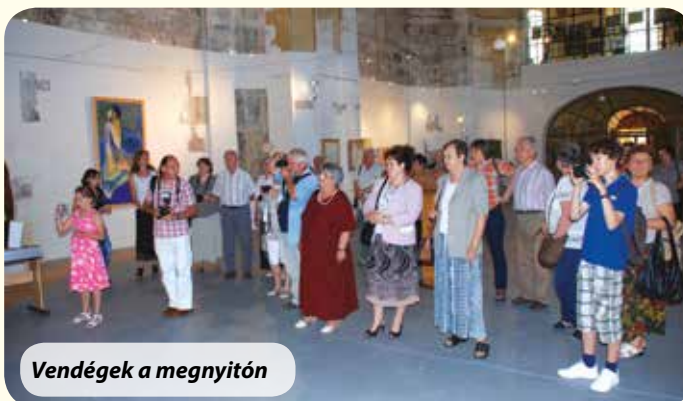
Vendégek a megnyitón