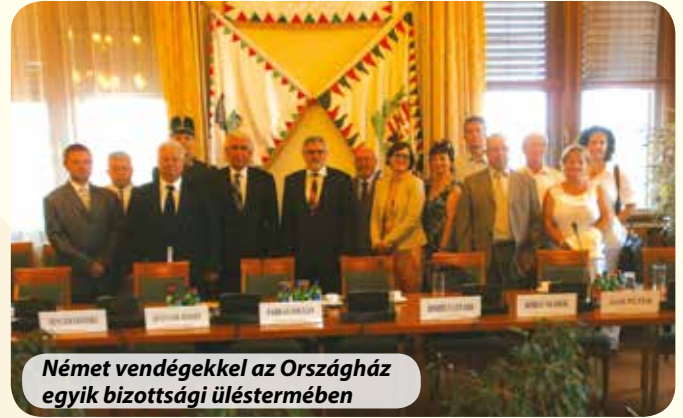
Német vendégekkel az Országház egyik bizottsági üléstermében