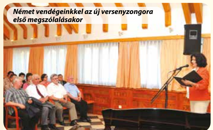
Német vendégeinkkel az új versenyzongora első megszólalásakor