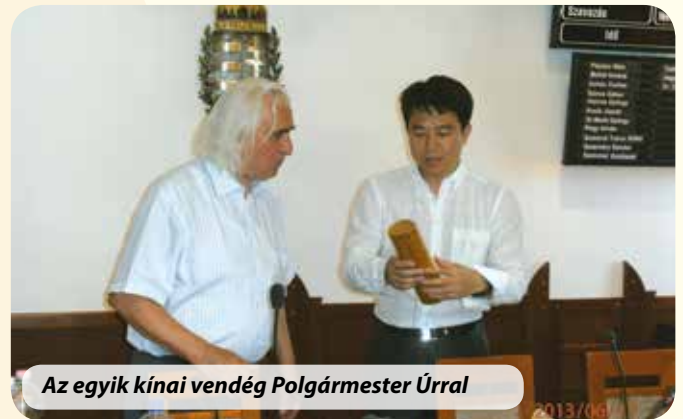
Az egyik kínai vendég Polgármester Úrral