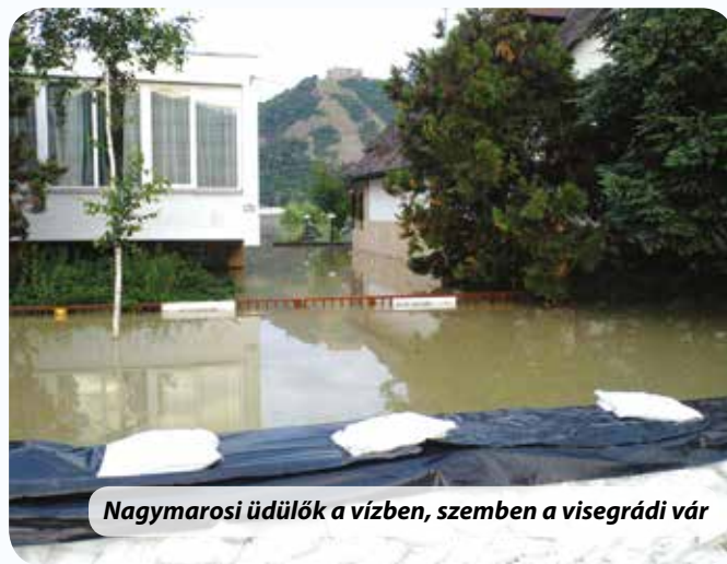
Nagymarosi üdülők a vízben, szemben a visegrádi vár

A Duna csak jön. Halkan, csendben, minden percben emelkedik egy kicsit, félóránként szemmel is látható, hogy feljebb van... de ugyan úgy emelkedik a töltés is, mindig valamivel magasabbra, mint az ár. Percről percre, óráról órára, egyforma erővel dolgoznak az emberek.