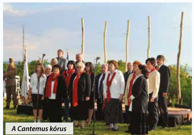
A Cantemus kórus