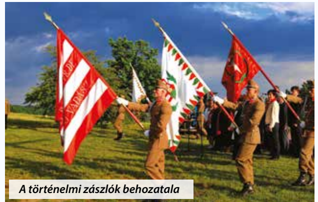
A történelmi zászlók behozatala