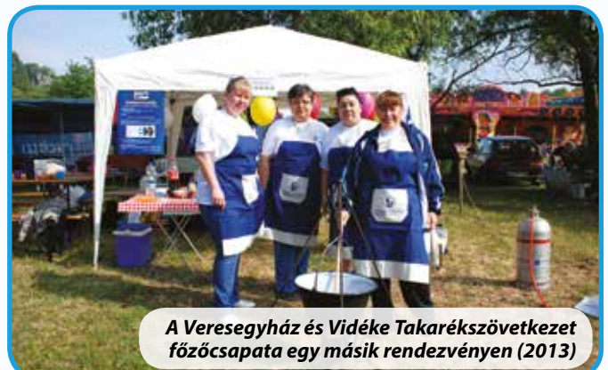
A Veresegyház és Vidéke Takarékszövetkezet főzőcsapata egy másik rendezvényen (2013)