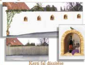
Kerti fal díszítése

Üzleti ingatlanok, helyiségek (üzlet, iroda, panzió, vendéglő, borospince, tárgyaló stb.) egyedi arculatának kialakítása kültéren és beltéren. Privát megrendelést is vállalok.