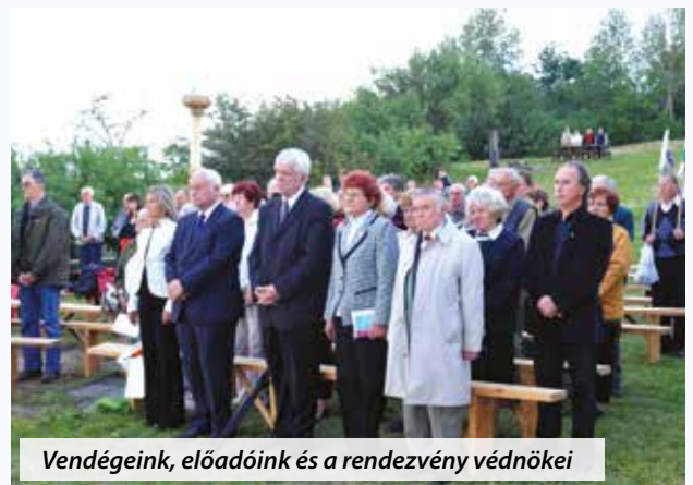
Vendégeink, előadóink és a rendezvény védnökei