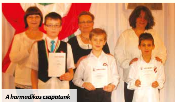
A harmadik csapatunk