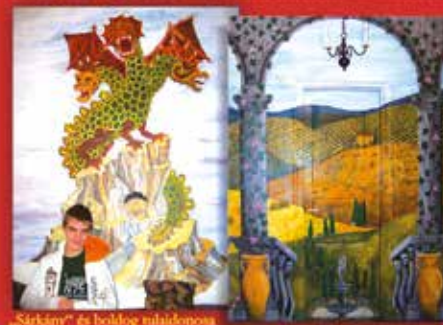
„Sárkány” és boldog tulajdonosa

Egyedi falfestmények a nappali, az ebédlő, a fürdő, a gyerekszoba, a könyvtárszoba, a háló, a borospince, a kerti fal, a medencetér díszítésére.