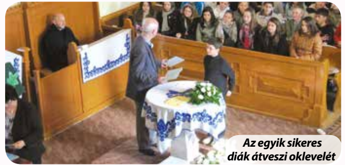
Az egyik sikeres diák átveszi oklevelét

Iskolánk igazgatójaként köszönetemet szeretném kifejezni a gyerekeknek, hogy komoly felkészülésről, hitről és odaszánt életről tettek tanú-bizonyosságot. Köszönöm a tanítók, tanárok munkáját, mellyel hozzásegítették a tanulókat az eredményes szerepléshez, köszönöm a családoknak a biztatást, a támogatást, az otthon nyújtott segítséget, a zsűri munkáját, és köszönjük együtt a Mindenható Istennek kegyelmét, áldásait. Legyen mindenért Istenünké a dicsőség!