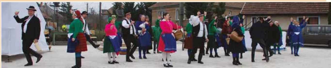
Hagyományörző Népi Együttes

Az időjárás ez alkalommal már lehetővé tette, hogy a népes közönség megcsodálhassa a remek emlékműsort, mely ezen a napon is hasonlóan időszerű volt. Vendégeink voltak a huszárokon és a lovas szabadcsapatok képviselőin túl német-osztrák katonai hagyományörzők is, akik elismeréssel adóztak az egykori hadviselés emlékeit is felsorakoztató ágyús, elöltöltős puskákból leadott sortűztűzzel is megtűzdelte rendezvénynek.