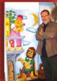
„Szereplő” és az alkotó