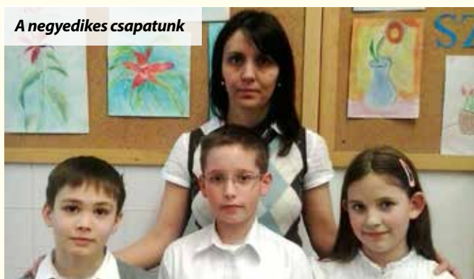
A negyedik csapatunk