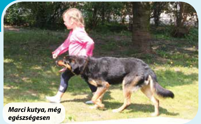
Marci kutya, még egészségesen

Bágyadtnak, erőtlennek látszott és rengeteg sebet cipelt a fején. Komoly csaták nyomait. Tátongó lyukak mindkét arcon, roncsolt sebek a fülein, felduzzadt orrhát, kétségbeesetten leromlott kondíció. A nyála csurgott, a száját alig tudta bezárni. Olyan szagot árasztott, mint egy romlott étellel teli kukás edény. Ha ilyen szájalomra méltó