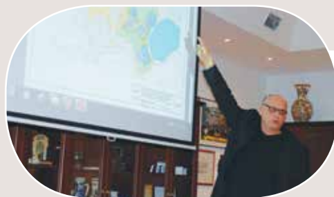
Egy érdeklődő az elképzeléseit a térképen mutatja be

Veresegyház Város Önkormányzata megbízásából kiadja a Windhager Kft. Decens Kiadója.