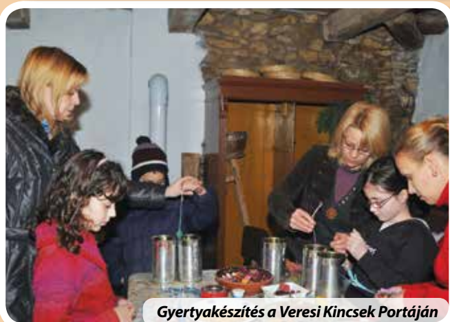
Gyertyakészítés a Veresi Kincsek Portáján