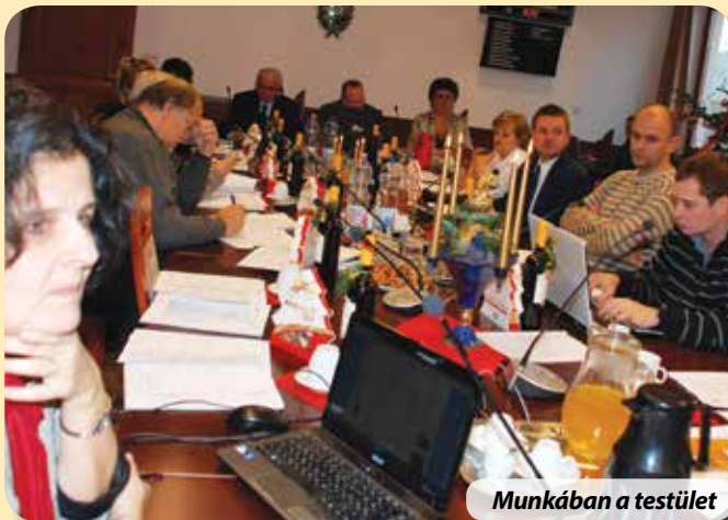
Munkában a testület

December 18-án tartotta az év utolsó ülését az önkormányzat, az alkalomhoz illő környezetben: karácsonyfával, szépen feldíszített asztallal, gyertyákkal, bejglivel. A képviselők előtt a jegyzetek és laptopok azonban jelezték, hogy mégis komoly döntések előkészítése, majd megszavazása történik ez alkalommal is.