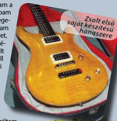
Zsolt első saját készítésű hangszere