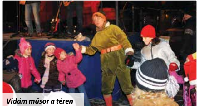
Vidám műsor a téren