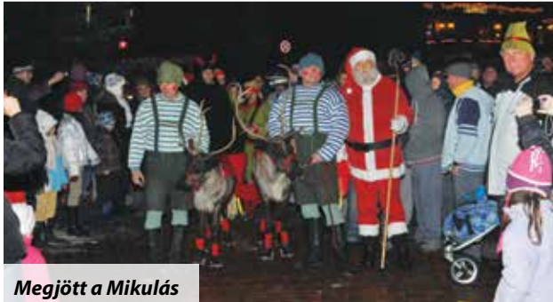
Megjött a Mikulás

A Mikulás bokros teendői közt december 5-én ért el Veresegyház főterére rénszarvasaival