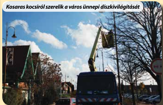
Kosaras kocsiról szerelik a város ünnepi díszkivilágítását

Természetesen az adventi idősakra készülve a GAMESZ gondoskodik a díszkivilágításról és a város karácsonyfájának elhelyezéséről is. Oldalsó képünkön éppen a díszkivilágítás zsinórozása folyik.