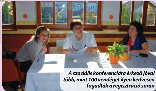
A szociális konferenciára érkező jóval több, mint 100 vendéget ilyen kedvesen fogadták a regisztráció során

• Elszünnedni, vagy elébe menni? Hogyan kezeljük a változások