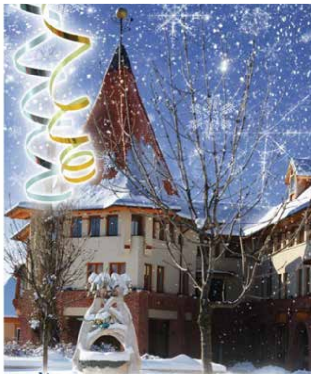
HAMAROSAN BEKÖSZÖNT A TÉL. KÖZELEDIK A KARÁCSONY. AZ Ő-ÉV. ÖRÖMTELI ÜNNEPI VÁRAKOZÁST, ELŐKÉSZÜLETEKET KIVÁN MINDEN VENDÉGÉNEI A VÁCI MIHÁLYMŰVELŐDÉSI HÁZ ÉS A SZABADIDŐS ÉS GAZDASÁGI INNOVÁCIÓS KÖZPONT.

Helyszín: Szabadidős és Gazdasági Központ