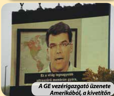
A GE vezérigazgató üzenete Amerikából, a kivetítőn

Büszkék vagyunk rá, hogy Tatabányán és Oroszlányban működik kutatóközpont, amely membránszál kutatást és termékfejlesztést folytat.