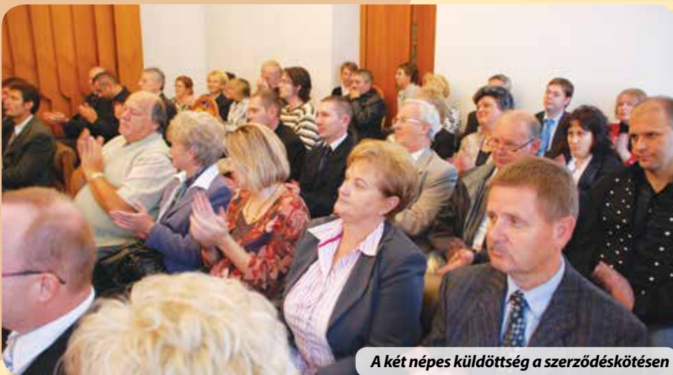
A két népes küldöttség a szerződéskötésen