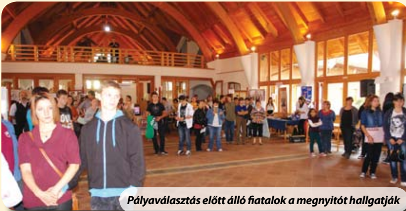
Pályaválasztás előtt álló fiatalok a megnyitót hallgatják