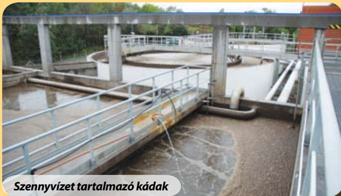
Szennyvizet tartalmazó kádak

A pénzügyi teljesítésről külön kell szólnom, mert számomra nagyon